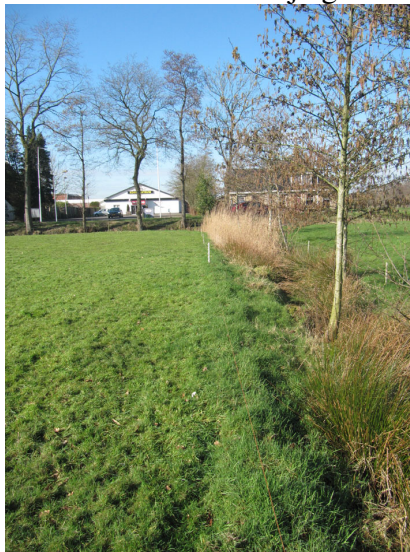
Foto 3. Half dicht gegroeide slootje richting het Zuid

Wat betreft de extra beschermde groep van vleermuizen is het belang van de aanwezige houtwallen structuur langs Het Zuid en de wijdere omgeving essentieel. Bij het oprichten van een woning aan het Zuid zal hiermee wel rekening dienen te worden gehouden, evenals met verstoring door licht. Voor de soorten zie bijlage 2.