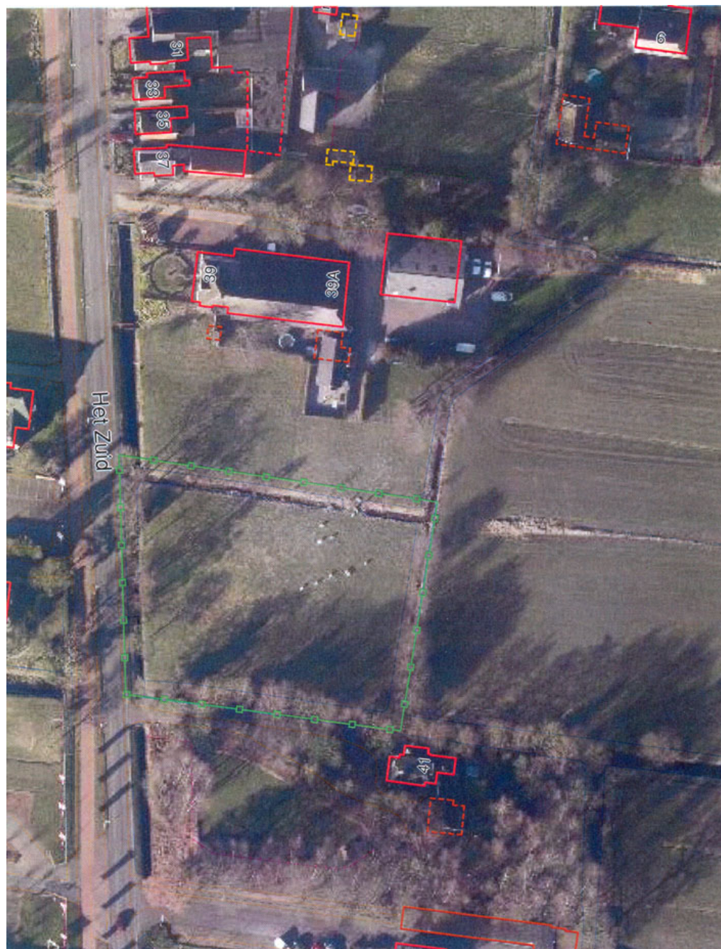
Fig 1. Luchtfoto van huidige situatie (bron: Gemeente Smallingerland)

Op bovenstaande luchtfoto (welwillend ter beschikking gesteld door mevr. Stenveld) is binnen de groene lijn het betreffende perceel, kadastraal bekend als 2525 te zien. Op moment van het maken van de luchtfoto waren er een aantal schapen aanwezig. De huidige bestemming is dan ook landbouwkundig gebruik met waarden (Gemeente Smallingerland).