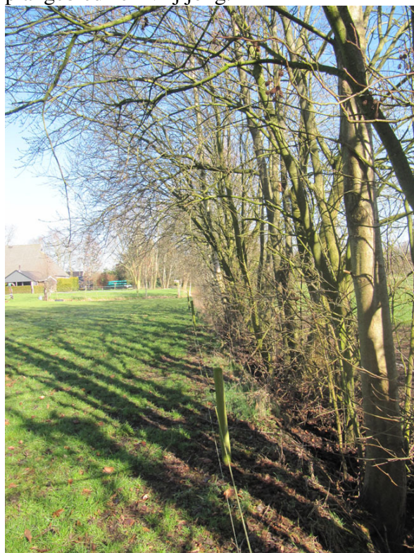
Foto 4. Jonge houtwal aan oostzijde perceel.

Er stonden Buro Elodea geen nadere broedvogelgegevens ter beschikking voor de omgeving van het plangebied. Het plangebied lijkt mij echter alleen voor algemene soorten een geringe rol te spelen. Er waren geen oudere monumentale bomen waarin holenbroeders of roofvogels zouden kunnen voorkomen. De oudste bomen zijn aanwezig rond Het Zuid 41 wat net naast het plangebied ligt. Zoals onderstaande foto laat zien zijn de bomen in het plangebied zelf vrij jong.