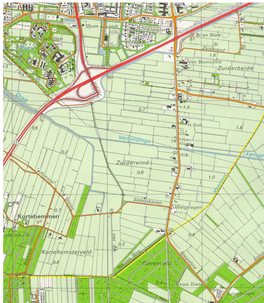
Kaart 1. Omgeving plangebied (Wolters-Noordhof Atlas 1989).

Het terrein ligt aan de oostzijde van de weg van Drachten naar Beetsterzwaag (Het Zuid of It Sud). Aan de zuidzijde wordt het terreintje begrensd door een brede waterlossing waarachter zich een houtwal met forse bomen bevindt en een erf + woonboerderij. Aan de oostzijde is een jonge en ijle houtwasl aanwezig waarachter een weiland aan de noordzijde ligt een belendend graslandperceel waarop de woonboerderij van 39 en 39a aanwezig zijn en het bedrijf Teak en Tûn gevestigd is. Het Zuid vormt de westgrens aan de overzijde ligt het groenbedrijf Tuindorado (zie ook bijlage 1 terreinbeschrijving).