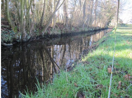
Foto 5. Grens met perceel waarop Het Zuid 41 ligt.