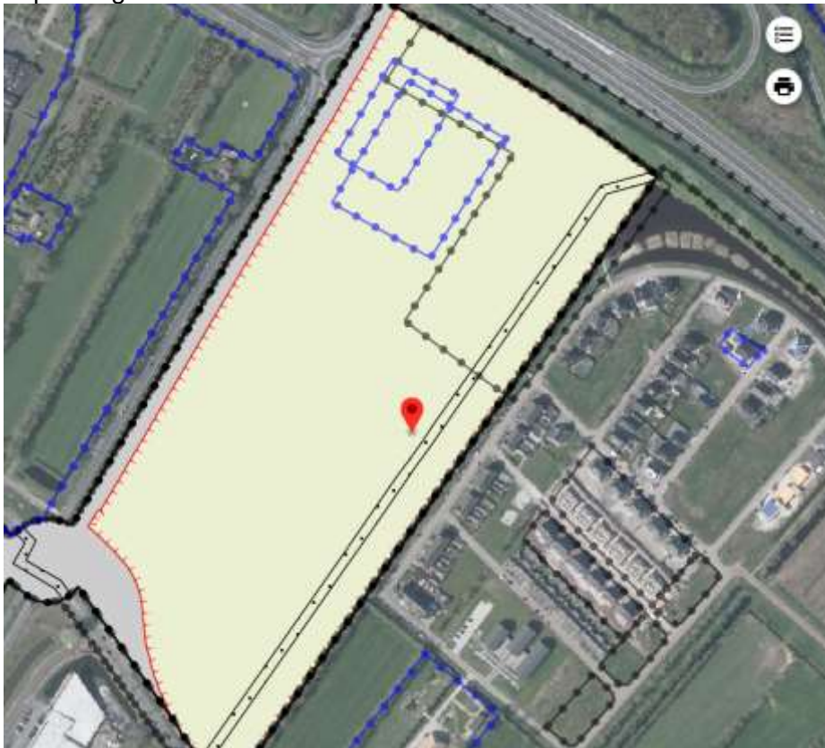
Bestemmingsplan Bedrijventerrein Noorderhogeweg

Een deel van het perceel heeft daarnaast de dubbelbestemming "Leiding – Water". Op grond van het bestemmingsplan art. 12.4.1 geldt een vergunningplicht voor werkzaamheden m.b.t. beplanting of bomen.