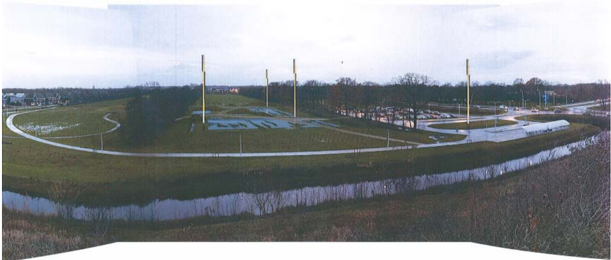
Figuur 2: schetsoverzicht kunstwerk in het gebied.