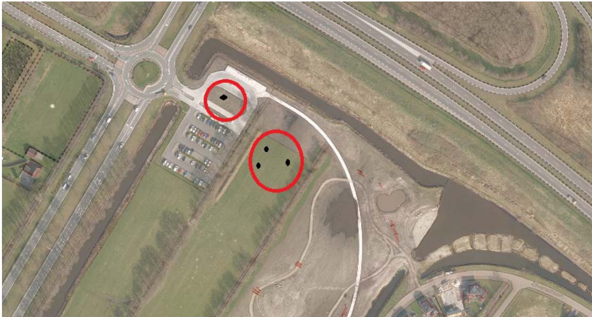
Figuur 1: Locatie plangebied

De locatie van de aanvraag omgevingsvergunning is gelegen in het noorden van Drachten nabij de aansluiting van de N31 met N369 en ten westen van de woonwijk Vrijburgh. Er zal ten zuiden en oosten van de carpoolvoorziening een kunstwerk worden gerealiseerd in het kader van het project "Bestemming Drachten". Het kunstwerk bestaat uit vier palen van circa 18 meter.