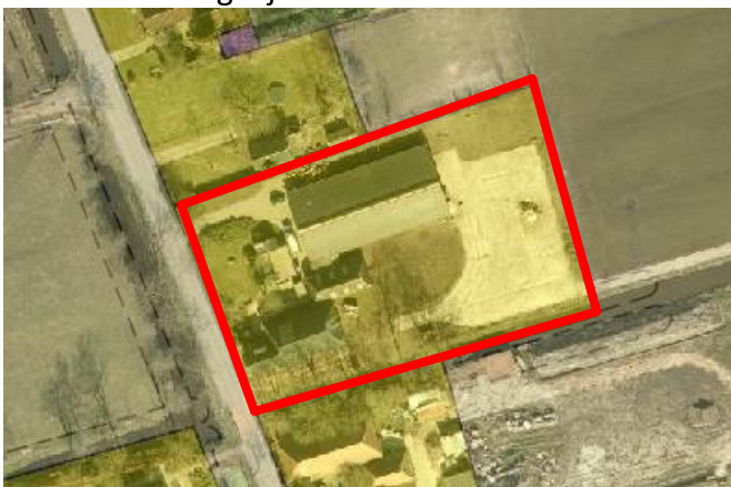
Afbeelding 3: Het perceel De Feart 49 te Drachtstercompagnie, Wonen-Woonboerderij (Geel).

Het perceel De Feart 49 ligt binnen het plangebied van bestemmingsplan Buitengebied. Het perceel heeft daarin de bestemming Wonen-Woonboerderij. Binnen deze bestemming is één woning toegestaan. Dat is de woning van de eigenaren in de voormalige boerderij. Het permanent huisvesten van cliënten in een bijgebouw is in strijd met het bestemmingsplan. Binnen deze bestemming kunnen burgemeester en wethouders de bestemming wijzigen in Bedrijf, Maatschappelijk en Recreatie 2. Er is geen binnenplanse mogelijkheid om een bijzondere woonvorm mogelijk te maken.