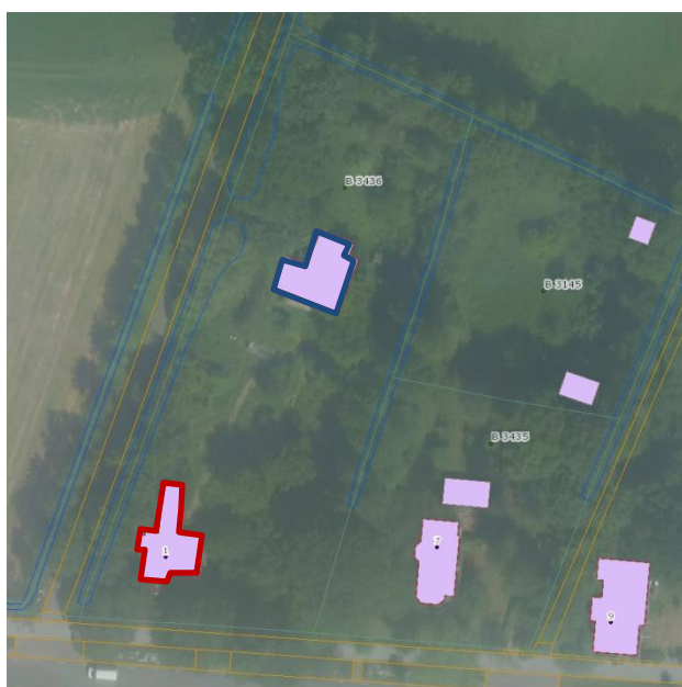
Afbeelding 1: Het perceel Nijtap 1 te Opeinde met hoofdbouw in rood en het Rijksmonument in blauw.

Het Rijksmonument is in gebruik geweest als gastenverblijf, béd en brochje, voor fietsers.