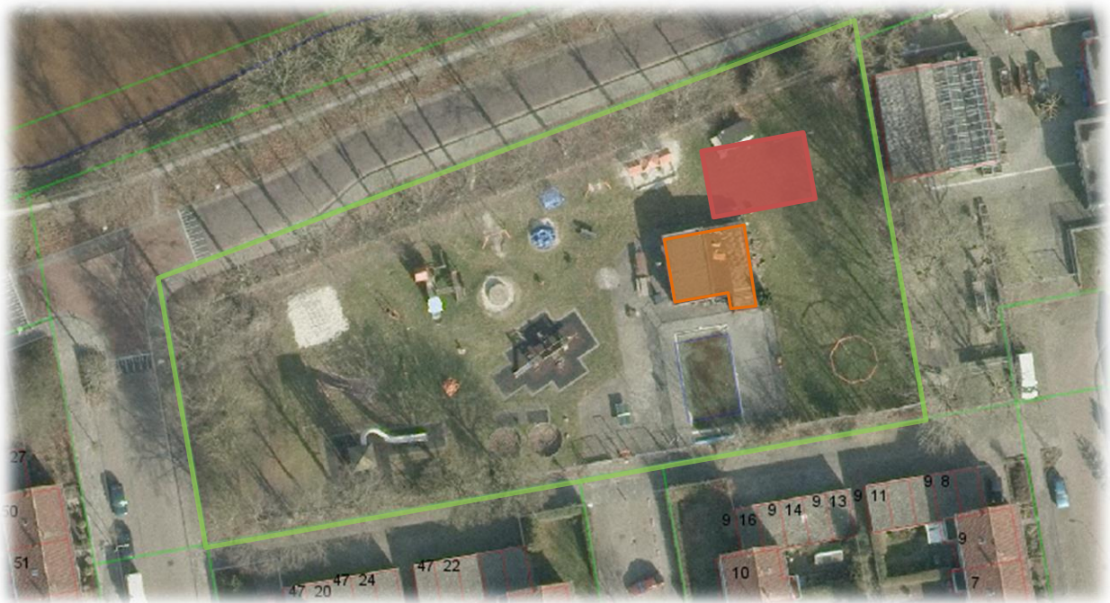
Afbeelding 1 Locatie van het huidige (oranje) en het nieuwe (rood) speeltuingebouw.

Het huidige gebouwtje staat dicht op het zwembad. Het nieuwe gebouw zal op een grotere afstand van het zwembad worden gerealiseerd. Beide gebouwen hebben ongeveer een oppervlakte van 105 m 2 .