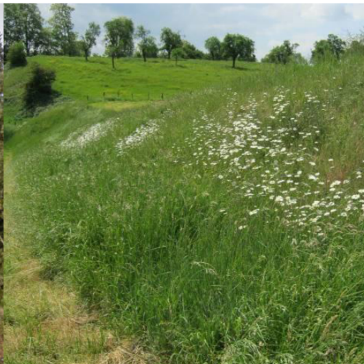
Natuurlijke gras en kruiden