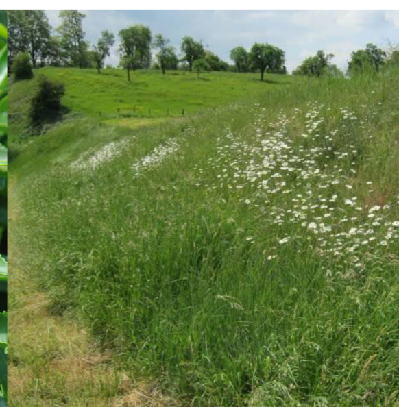
Natuurlijke gras en kruiden