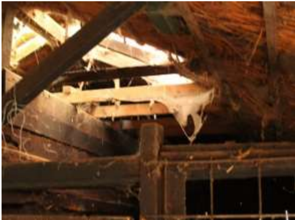
De houten schuur is toegankelijk voor vogels om in te gaan nestelen door openingen in het dakvlak

Het plangebied behoort tot functioneel leefgebied van verschillende vogelsoorten. Vogels benutten het plangebied als foerageergebied en mogelijk nestelen er jaarlijks vogels in de bebouwing in het plangebied. Met uitzondering van de meest zuidelijk gelegen schuur, beschikt alle bebouwing over openingen waardoor vogels hier een nestplaats in kunnen bezetten. Vogelsoorten die mogelijk in het plangebied nestelen zijn merel, houtduif, holenduif en winterkoning. In één van de schuren is een oud en deels vervallen nest van de huismus aangetroffen. Gelet op de leegstand van de schuur en het ontbreken van huismussen op en rond het erf, en de slechts staat van het nest, wordt aangenomen dat er geen huismussen in de te slopen gebouwen nestelen. Het intensief beheerd grasland vormt geen nestplaats voor (weide)vogels maar dient wel als foerageergebied voor tal vogels die foerageren in het open, grasland. Er zijn geen aanwijzingen gevonden dat steen- of kerkuil er een vaste rust- of nestplaats bezetten. Aanwezigheid van deze soorten in gebouwen is doorgaans gemakkelijk vast te stellen aan de hand van braakballen, schijtsporen en ruiveren.