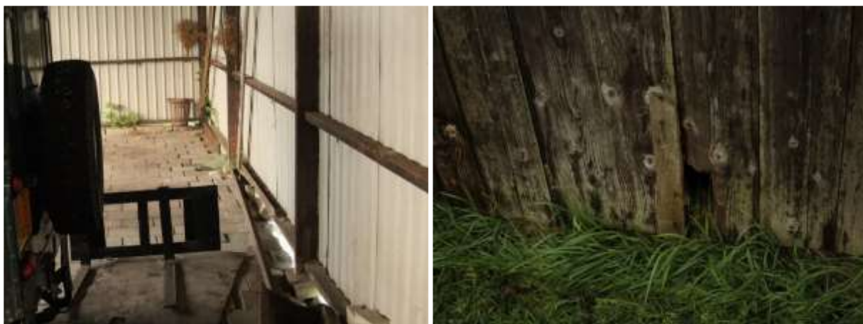
Foto links; Bos- en huisspitsmuizen kunnen een rust- en voortplantingsplaats bezetten onder opgeslagen goederen/voertuigen/materialen in kapschuur. Foto rechts; Toegang voor bos- en huisspitsmuizen in noordelijk gelegen houten schuur.

Door het verwijderen van opgeslagen goederen/materialen/voertuigen en het slopen van bebouwing wordt mogelijk een grondgebonden zoogdieren gedood en wordt mogelijk een vaste rust- en/of voortplantingsplaats beschadigd en vernield. Als gevolg van de voorgenomen activiteiten neemt de betekenis van het plangebied als foerageergebied voor grondgebonden zoogdieren niet af.