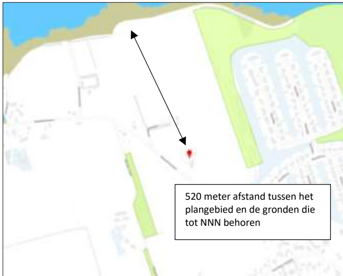
Ligging van Natuurnetwerk Nederland in de omgeving van het plangebied. De ligging van het plangebied wordt met de rode marker aangeduid. Gronden die tot Natuurnetwerk Nederland behoren worden met de blauwe en bruine kleur op de kaart aangeduid. De lichtgroene kleur valt buiten de NNN.