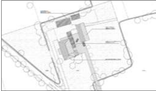
Verbeelding van het wenselijk eindbeeld.

Het voornemen bestaat om alle bebouwing in het plangebied te slopen en een nieuw bijgebouw te realiseren. Het nieuwe bijgebouw wordt d.m.v. een nieuw aan te leggen verharde inrit in verbinding gebracht met de zuidelijk gelegen weg Kleasterkampen. Op onderstaande afbeelding wordt een plattegrond van het wenselijk eindbeeld weergegeven.