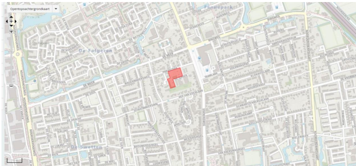
Figuur 1: plangebied perceel Aan de Tuinen te Drachten

Op 25 november 2021 hebben wij uw verzoek ontvangen voor het beoordelen van de woningbouwontwikkeling locatie De Tuinen te Drachten op de milieuaspecten externe veiligheid, luchtkwaliteit en geluid. Bij de gemeente liggen plannen om op het braakliggend perceel 'Aan de Tuinen', woningbouw mogelijk te maken voor circa 17 woningen. Op dit perceel geldt nu volgens het bestemmingsplan 'Drachten de Swetten' de bestemming 'Maatschappelijk'. Binnen deze bestemming is geen ruimte voor woningbouw. De gemeente dient dus het bestemmingsplan te wijzigen. Ten behoeve van die vaststelling heeft de gemeente aan de FUMO gevraagd, onderzoeken uit te voeren naar de aspecten externe veiligheid, luchtkwaliteit en wegverkeerslawaai.