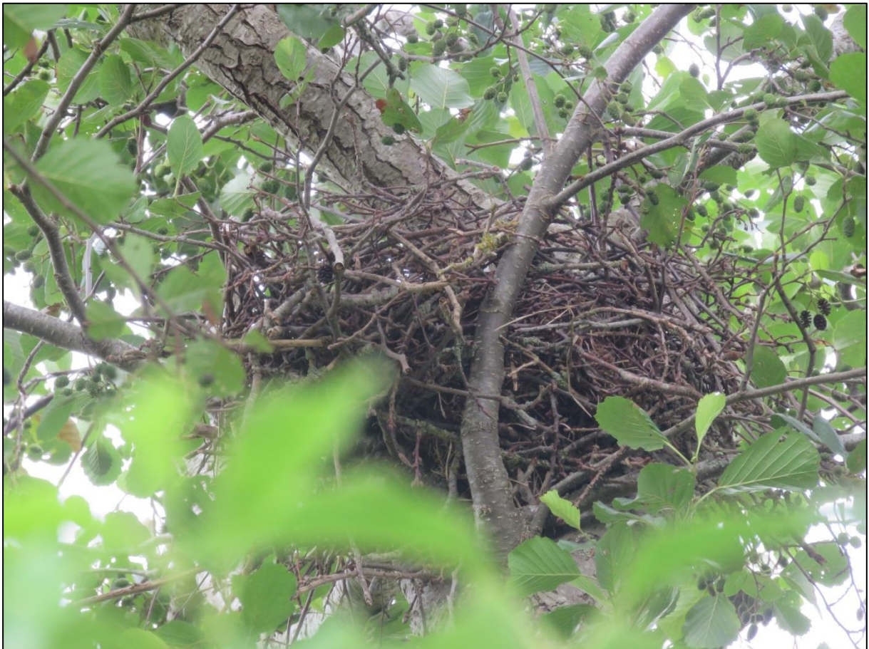
Figuur 2.2. Een aangetroffen eksternest waar bij benadering een buizerd van weg vloog.

Het plangebied is tevens gecontroleerd op jaarrond beschermde nestlocaties van vogels die in gebouwen of andere kunstmatige bouwwerken tot broeden komen. Echter, binnen het plangebied zijn geen gebouwen of andere kunstmatige bouwwerken aanwezig. Het voorkomen van in gebouwen broedende vogelsoorten binnen het plangebied kan derhalve op voorhand worden uitgesloten.