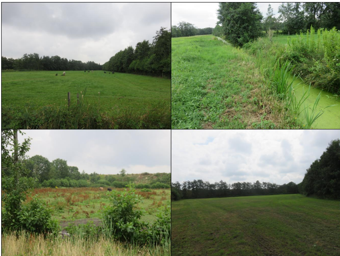
Figuur 1.2. Impressie van de plangebieden.

Het planvoornemen bestaat uit het uitvoeren van een locatieonderzoek voor de scholenbundeling Drachten in het noordwestelijke plangebied waarbij het zuidoostelijke plangebied ook in beeld is, evenals het realiseren van nieuwbouw woningen in het zuid-oostelijke plangebied.