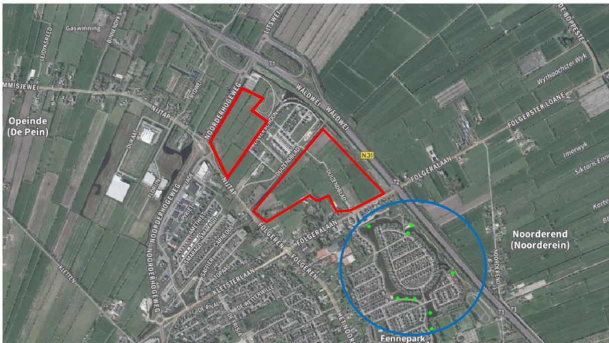
Figuur 2.7. Waarnemingen van de kleine modderkruiper (blauw) vlak buiten de plangebieden (rood).

Tijdens de bureaustudie zijn geen vormen van gebiedsbescherming naar voren gekomen die betrekking hebben op de plangebieden. De plangebieden vallen niet onder de EHS/NNN of Natura2000 en zijn niet aangewezen als ganzenfoeragegebied of weidevogelgebied. Wel liggen de plangebieden op circa 7 km afstand van het natura2000 gebied Alde Feanen. Één van de habitatsoorten voor dit gebied is de kleine modderkruiper. Vlak buiten de plangebieden zijn meerdere waarnemingen van deze soort bekend (figuur 2.8). Hierdoor kan het voorkomen van deze soort binnen de plangebieden niet op voorhand worden uitgesloten. Echter, de plangebieden bevinden zich op dusdanig grote afstand van het natura2000 gebied Alde Feanen, dat wanneer dit mogelijke leefgebied verloren gaat, negatieve effecten op de instanthoudingsdoelstellingen van het natura2000 gebied alsnog op voorhand kunnen worden uitgesloten.