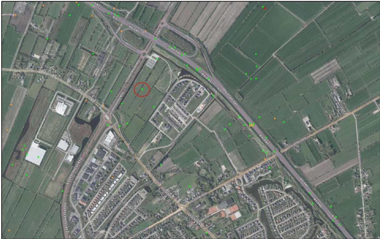
Figuur 2.3. Waarnemingen van de buizerd binnen en vlak buiten de plangebieden. De rood omringde waarneming is tevens de locatie waar ten tijde van het veldbezoek een buizerd werd waargenomen (bron: NDFP).