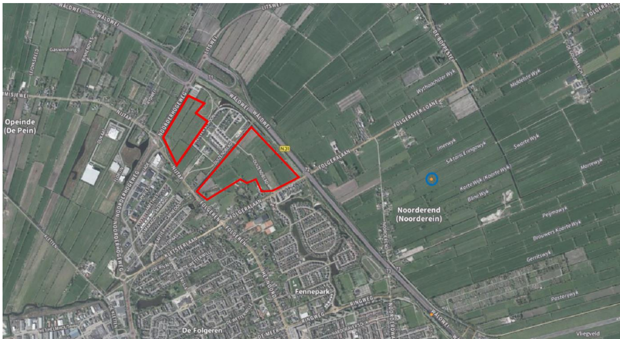
Figuur 2.7. Waarneming van de soort grote modderkruiper (blauw) in de omgeving van de plangebieden (rood).

Echter, enkele sloten in de plangebieden vormen dusdanig geschikte habitats voor de soort dat het voorkomen hiervan niet op voorhand kan worden uitgesloten. Binnen het plangebied kunnen tevens andere, meer algemene, (vrijgestelde) soorten voorkomen. Voor deze soorten geldt de zorgplicht (Bijlage I).