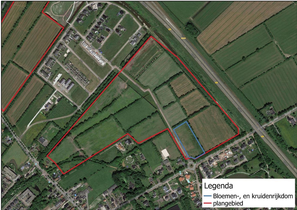
Figuur 2.9. De locatie van het gebied met de meest verhoogde kruiden-, en bloemenrijkdom (blauw) binnen het oostelijk gelegen plangebied (rood).