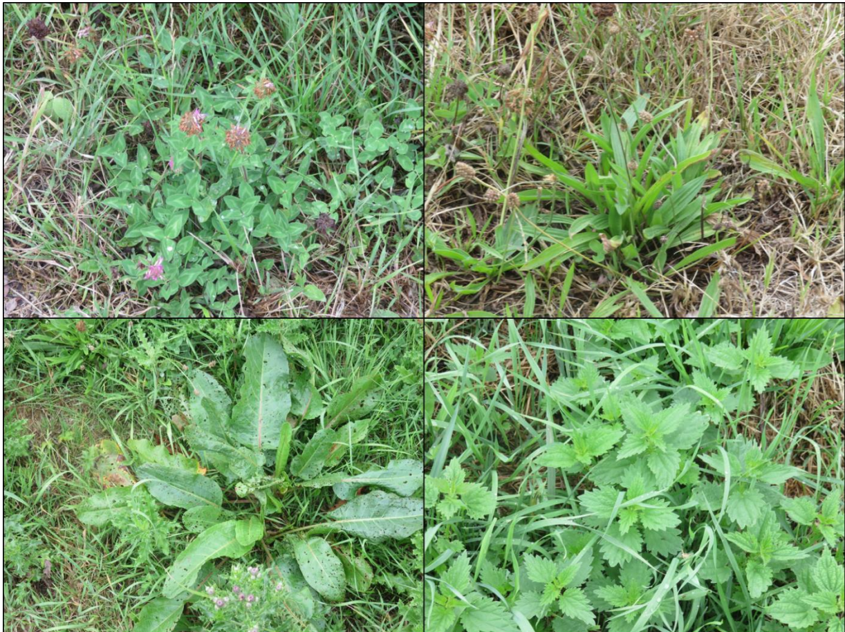
Figuur 2.1. Impressie van de flora in het plangebied met v.l.b.n.r.o.: rode klaver, weegbree, ridderzuring en grote brandnetel.