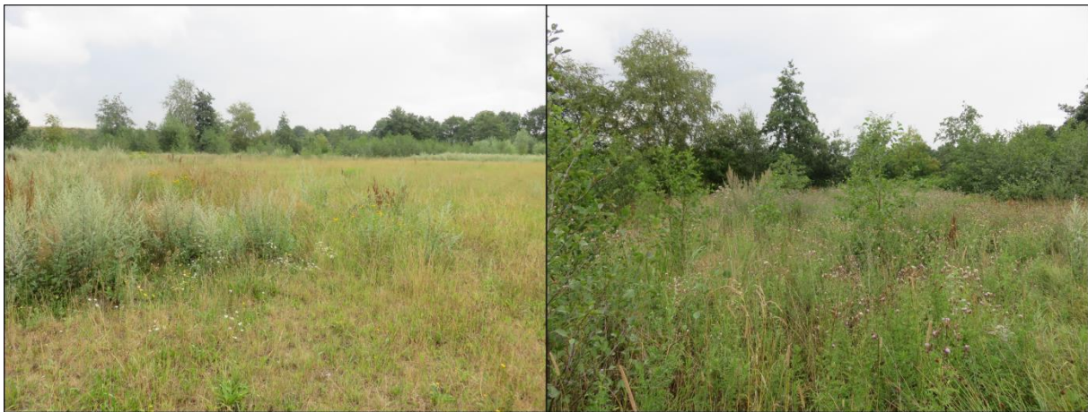
Figuur 2.8. Opvallende bloemen-, en kruidenrijkdom in het oostelijk gelegen plangebied.

Biodiversum kan het traject volledig begeleiden; van ecologische ontwerpsets, inrichtingsplan, beheerplan tot uitvoering en het volgen van de ontwikkelingen door monitoring van de biodiversiteit.