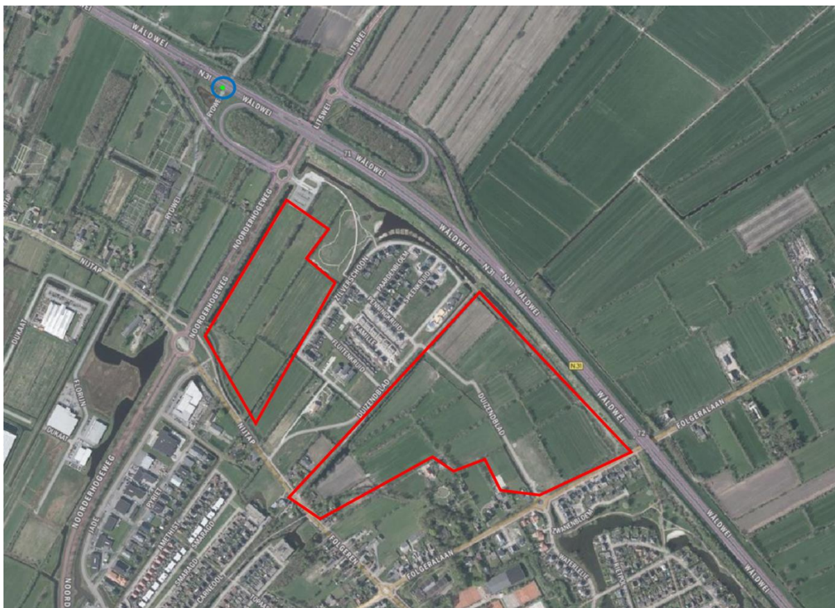
Figuur 2.6. Waarneming van de soort boomarter (blauw) in de omgeving van de plangebieden (rood).

Binnen de plangebieden kunnen tevens lichter beschermde (vrijgestelde) zoogdiersoorten voorkomen, zoals de veldmuis. Hoewel deze soorten voor ruimtelijke ingrepen zijn vrijgesteld binnen de provincie Fryslân, dient men zich wel te houden aan de voor deze soorten geldende zorgplicht.