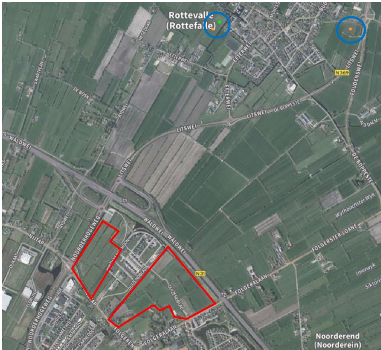
Figuur 2.5. Waarneming van de soort waterspitsmuis (blauw) in de omgeving van de plangebieden (rood) (bron: NDFD).

Het voorkomen van verblijfplaatsen van overige beschermde soorten zoogdieren, zoals de otter kan op voorhand worden uitgesloten op basis van verspreidingsgegevens (bron: NDFD) en habitateigenschappen. Uitzonderingen hierop worden gevormd door de waterspitsmuis en de boommarter. De waterspitsmuis verblijft in snel stromende tot stilstaande wateren met voldoende oevervegetatie. In de sloten binnen het plangebied is voldoende geschikt habitat (oevervegetatie, voedsel) aanwezig voor deze soort. Hiernaast zijn er van de soort enkele waarnemingen bekend in de omgeving van de plangebieden (figuur 2.5). Doordat deze soort schuw is voor mensen, kunnen negatieve effecten als gevolg van nieuwbouw en het eventuele aanpassen van de sloten binnen de plangebieden niet op voorhand worden uitgesloten.