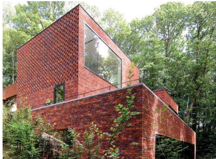
Referentiebeelden voor de hoofdvorm, massaopbouw, aanzichten en opmaak van de woningen