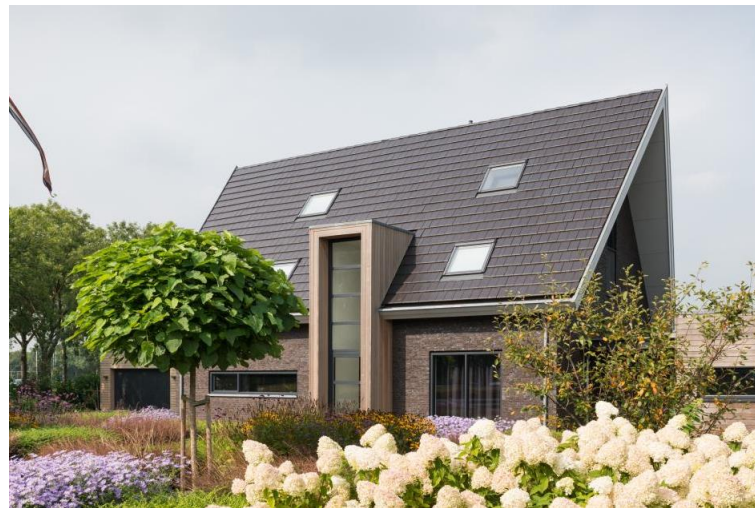
Referentiebeelden voor de hoofdvorm, massaopbouw, aanzichten en opmaak van de woningen