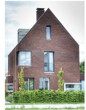
Referentiebeelden voor de hoofdvorm, massaopbouw, aanzichten en opmaak van de woningen