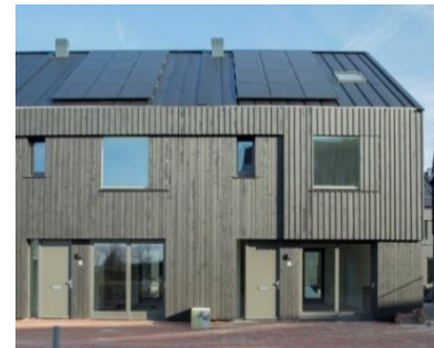
Referentiebeelden voor de hoofdvorm, massaopbouw, aanzichten en opmaak van de woningen