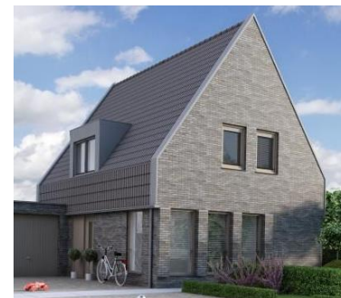
Referentiebeelden voor de hoofdvorm, massaopbouw, aanzichten en opmaak van de woningen