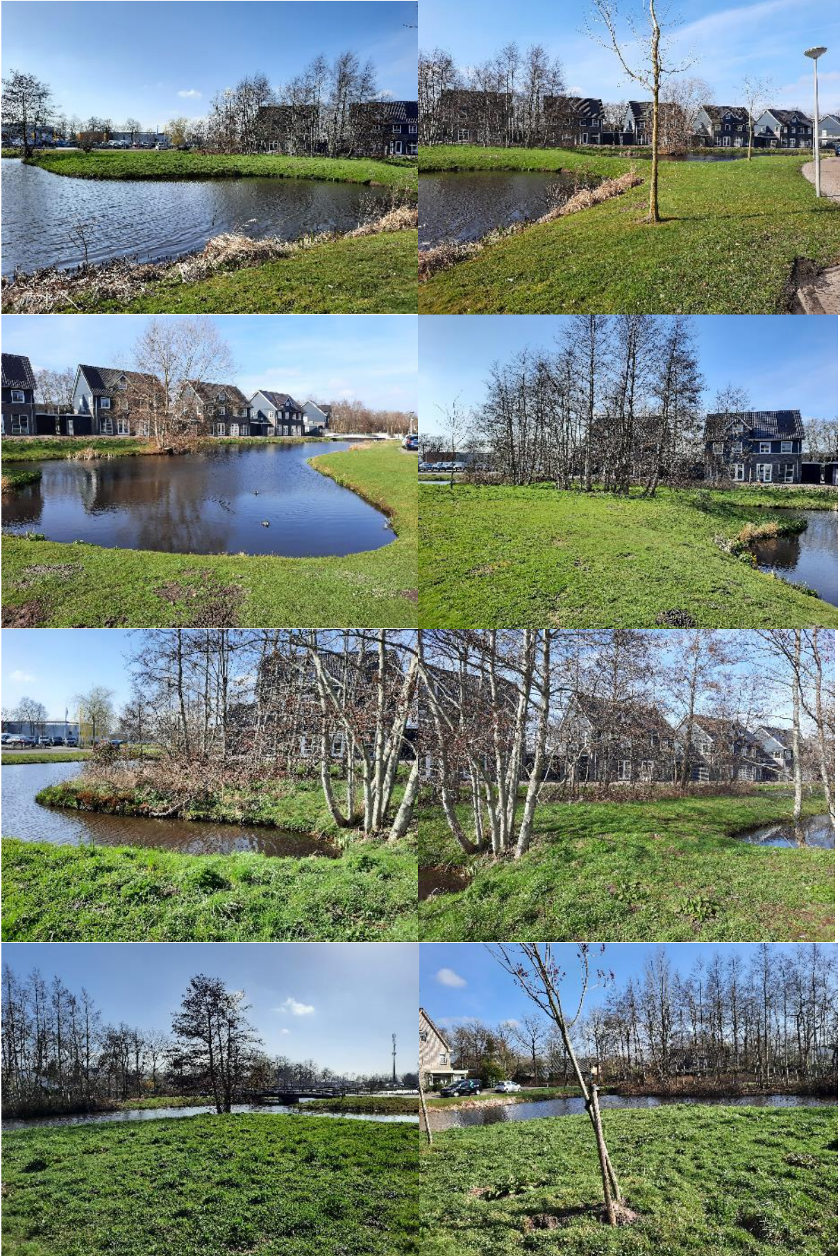
Bijlage 3. Fotobijlage. Impressie van het plangebied en de directe omgeving.