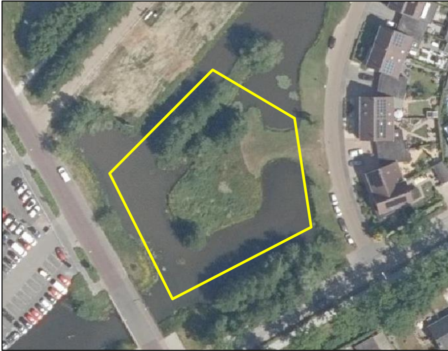
Begrenzing van het onderzoeksgebied, deze wordt met de gele lijn aangeduid.