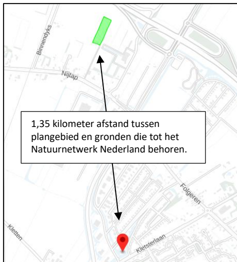
Ligging van Natuurnetwerk Nederland in de omgeving van het plangebied. De ligging van het plangebied wordt aangeduid door de rode marker. Gronden die tot het Natuurnetwerk Nederland behoren worden met de lichtgroene kleur op de kaart aangeduid.