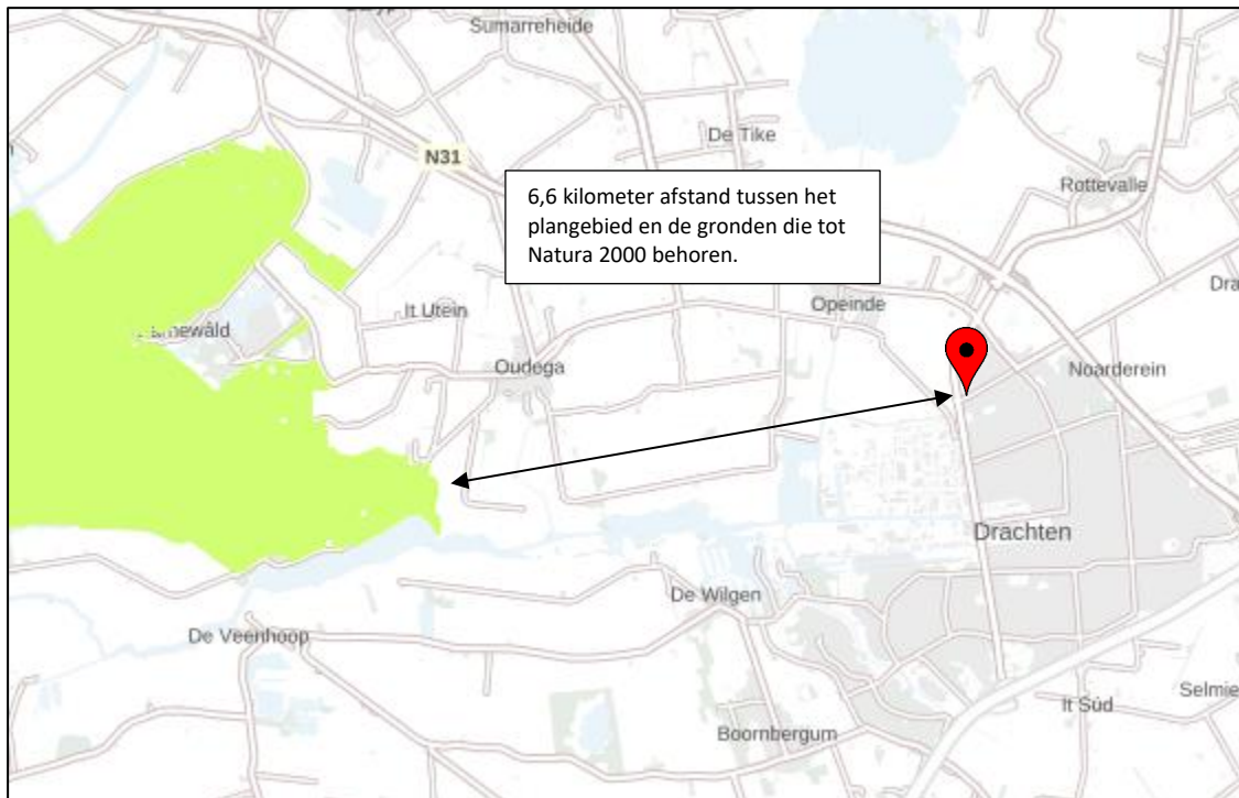
Ligging van Natura 2000-gebied in de omgeving van het plangebied. De ligging van het plangebied wordt met de rode marker aangeduid. Gronden die tot Natura 2000 behoren worden met de lichtgroene kleur aangeduid.