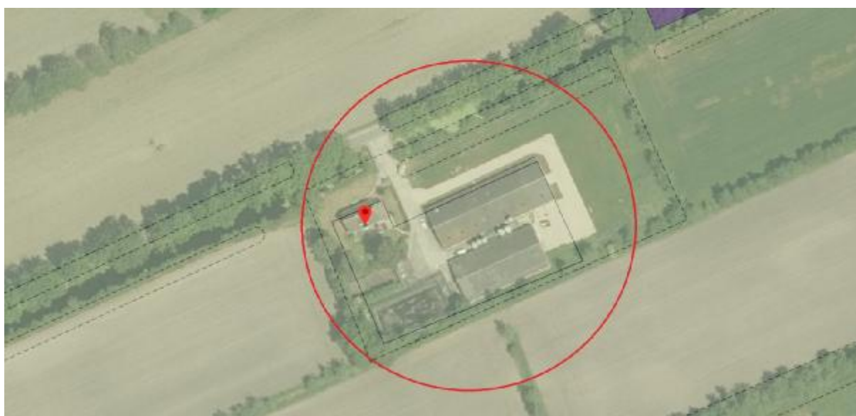
Figuur 4: fragment bestemmingsplan Buitengebied Smallingerland 2013 (bron: www.ruimtelijkeplannen.nl )

Geconcludeerd kan worden dat aan het gemeentelijk beleid wordt voldaan met uitzondering van de omvang van het kleinschalige kampeerterrein. In plaats van 0,5 ha. is daarvoor 0,4 ha. beschikbaar. Gelet echter op het provinciale beleid, het feit dat er maximaal in 15 kampeerplaatsen is voorzien in plaats van 25 kampeerplaatsen en het feit dat de intensieve veehouderij bestemming vervalt is het iets kleinere kampeerterrein acceptabel.