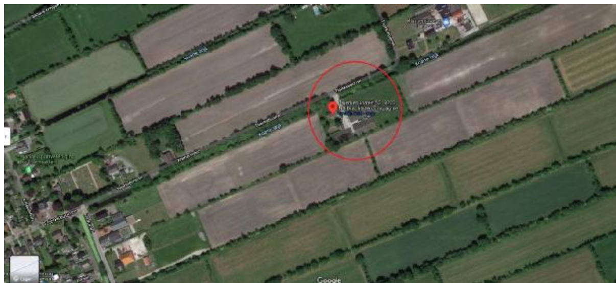
Figuur 1: globale ligging van het plangebied

Zoals uit het bovenstaande duidelijk is geworden omvat het plangebied het onderhavige agrarische perceel. Het plangebied is indicatief weergegeven in figuur 1.