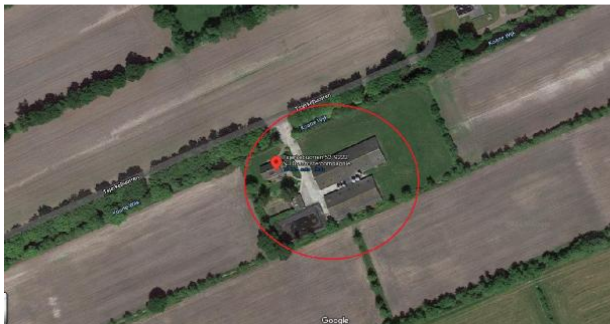
Figuur 2: Luchtfoto bebouwing Tsjerkebuorren

De Tsjerkebuorren is ca. 1 km lang en loopt vanuit het dorp oostwaarts tot in het buitengebied. Aaneengesloten bebouwing is aanwezig langs de Tsjerkebuorren voor zover gelegen in de dorpskom. Eenmaal buiten de dorpskern is het onderhavige perceel het enige bebouwde perceel. De bebouwing in de dorpskern bevindt zich ingevolge de provinciale omgevingsverordening Romte Fryslân 2014 in stedelijk gebied. Het onderhavige perceel bevindt zich in landelijk gebied.