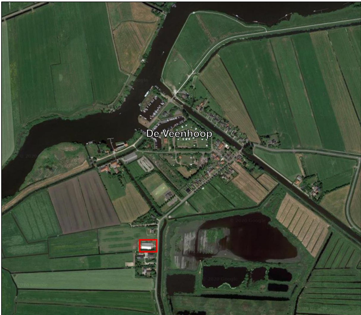
Figuur 1.1. Ligging van het plangebied weergegeven met een rood kader.

Het plangebied (figuur 1.1) betreft een agrarisch perceel met een paardenstal aan de Kraenlânswei tussen nummer 18 en 20 ten zuiden binnen de bebouwde kom van De Veenhoop. Het terrein wordt aan de zuidkant begrensd door een kleine bomensingel van jonge bomen en omringd door sloten. Daaromheen liggen landbouwpercelen. De paardenstal bestaat uit enkelsteen muren met golfplaten, gevelbetimmering en -dak. Binnen de paardenstal is een extra ruimte opgebouwd uit houtplaten en golfplaten met isolatie materiaal. De ruimte bevat enkele gaten in de betonvloer en muren. Het planvoornemen is de paardenstal te slopen om ervoor in de plaats een woning en bijgebouw te realiseren. De bomen en de sloten rondom het plangebied blijven voor zover ons bekend is ongemoeid.