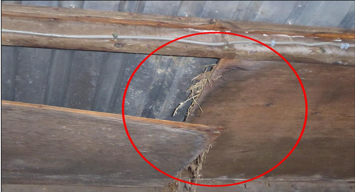
Figuur 2.2. Indicatie voor huismus nestgelegenheid in de paardenstal.

Daarnaast zijn er vogelsoorten waarvan de nesten jaarrond beschermd zijn die juist onder dakpannen of achter/tussen dak- of gevelelementen van gebouwen gaan nesten. Gezien de hoogte van de paardenstal is het gebouw enkel geschikt voor huismus. Tijdens het veldbezoek zijn er ook huismussen (>10) waargenomen in de paardenstal. Daarnaast zijn in de stal aanwijzingen voor nesten van huismus aangetroffen tussen de golfplaten, dak en losliggende houtplaten bij de extra ruimte aan de noordoostkant van de paardenstal (figuur 2.2).