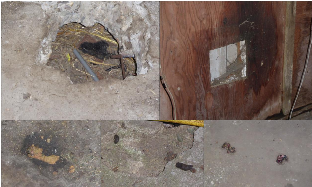
Figuur 2.4. Indicaties steenmarter in de extra ruimte van de paardenstal. Boven: mogelijke toegangswegen naar verblijfplaatsen; onder: feces en prooiresten.