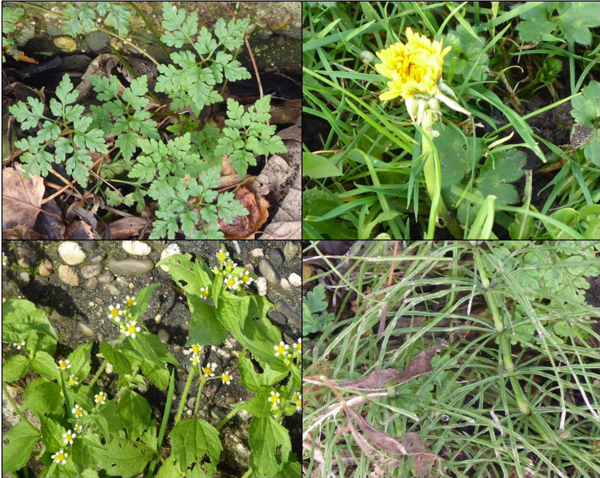
Figuur 2.1. Impressie aangetroffen flora binnen het plangebied.

Het plangebied wordt gekenmerkt door grasland met soorten zoals Engels raaigras, madelief, brede weegbree, paardenbloem, ridderzuring en andere voedselrijke soorten (figuur 2.1). Daarnaast wordt het terrein ten zuiden begrensd door een bomensingel van jonge bomen (o.a. berk) en struiken (o.a. braam). Het plangebied is vanwege habitateigenschappen ongeschikt voor beschermde flora en deze zijn ook niet aangetroffen.