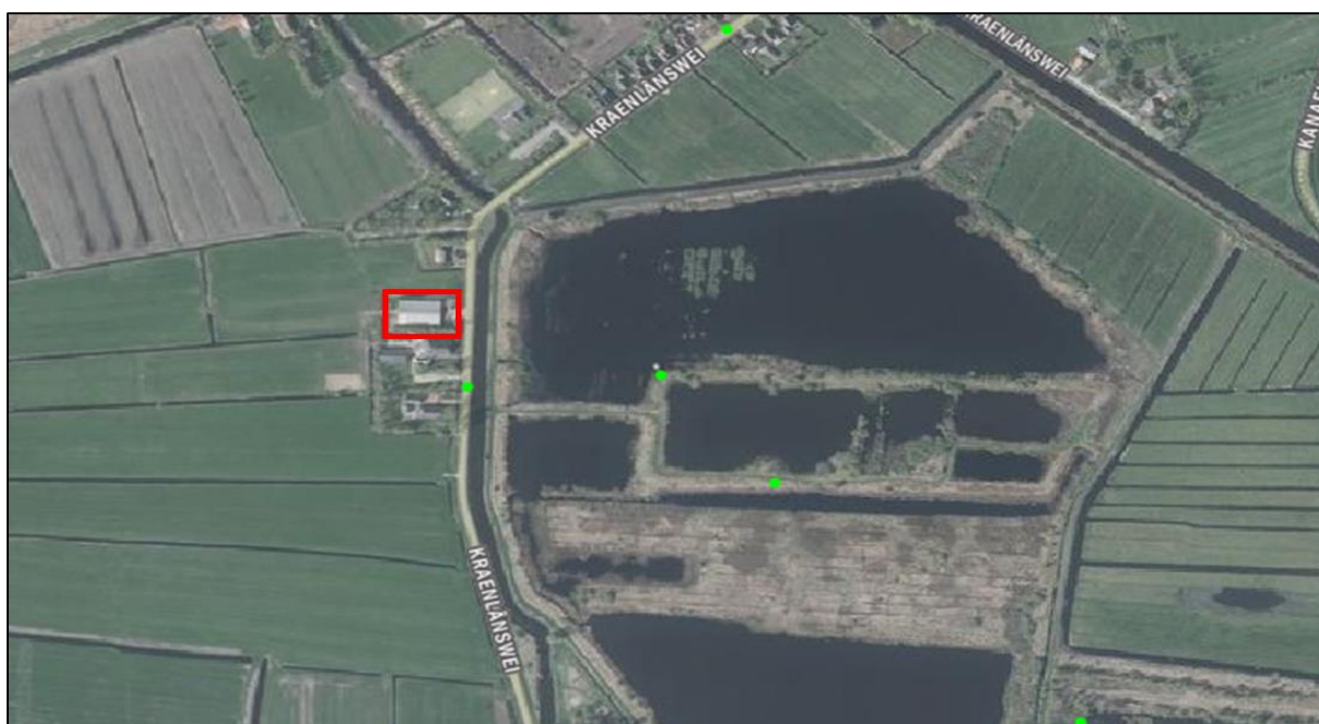
Figuur 2.3. Verspreidingsgegevens steenmarter van 2015-2020 rondom het plangebied.

Wel is het plangebied op basis van de habitat, alsmede de verspreidingsgegevens, geschikt voor vrijgestelde zoogdieren zoals steenmarter (figuur 2.3-2.4) en mol, waar ook indicaties van zijn aangetroffen (feces en prooiresten en molshopen). Voor vrijgestelde soorten geldt zorgplicht.