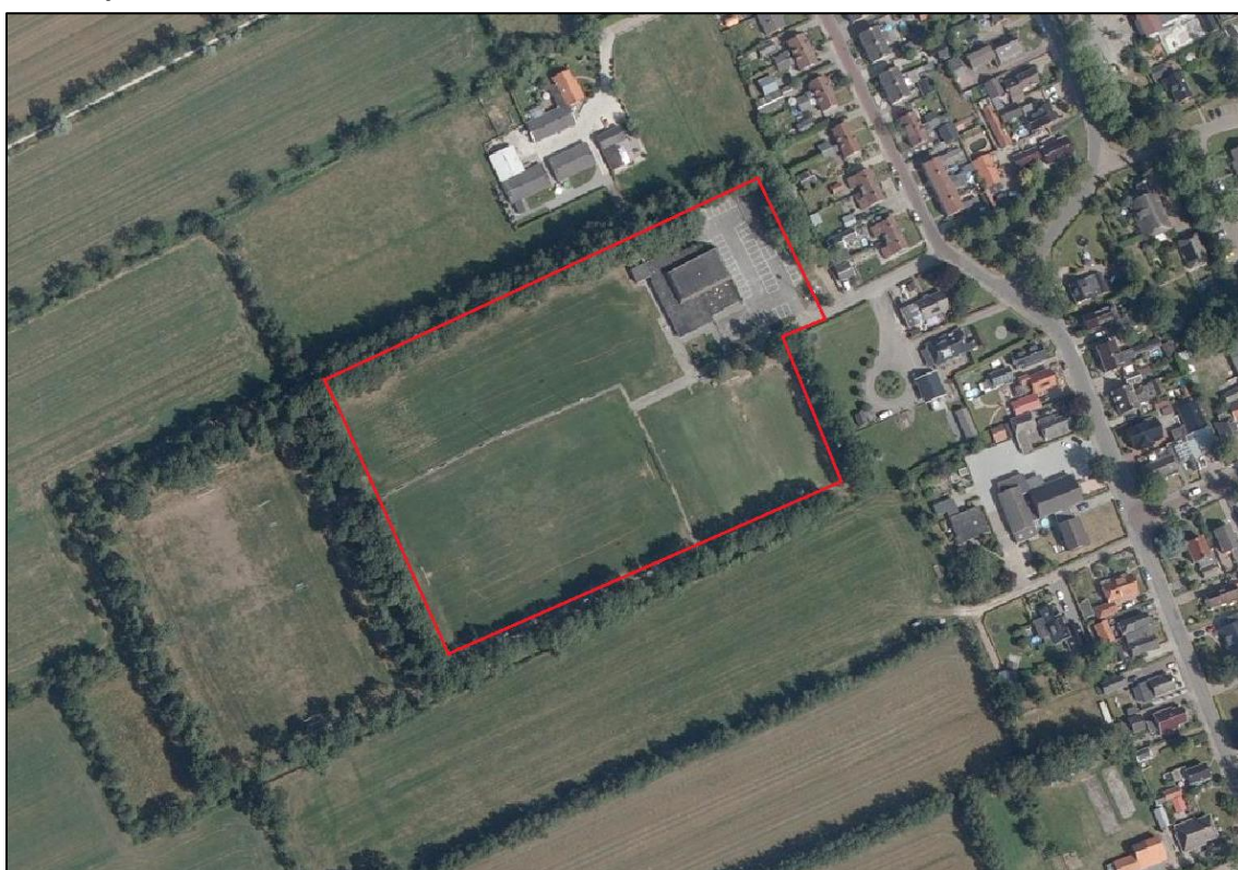
Figuur 1. Luchtfoto met de locatie van het plangebied (rood).

De ontwikkelingen bestaan uit de realisatie een nieuw multifunctioneel centrum op het sportcomplex. Het huidige kantinegebouw, de speeltuin en het entreehokje zullen worden gesloopt om plaats te maken voor een nieuw parkeerterrein. Ten westen van het huidige gebouw zal een nieuw gebouw en een pannakooi worden gerealiseerd. Verder wordt verharding aangelegd om de bebouwing en sportvelden bereikbaar te maken. Daarnaast wordt groen aangelegd tussen de te realiseren parkeerplaatsen. Voor de ontwikkelingen wordt grond vergraven en een gedeelte vegetatie verwijderd. Een enkele boom op het parkeerterrein wordt mogelijk gekapt. Overige bomen, rondom het plangebied, blijven behouden.