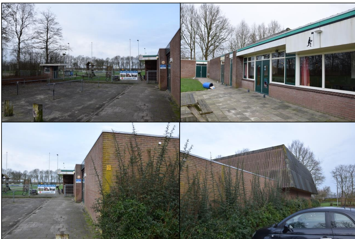
Foto's 1 t/m 4. Impressie van het plangebied op 2 maart 2020. Linksboven het aanzicht vanuit het noordoosten van het plangebied. Rechtsboven het aanzicht op het kantinegebouw vanuit het zuidwesten. Linksonder het aanzicht op de zuidoostzijde van het gebouw. Rechtsonder het aanzicht op de oostzijde van het gebouw.