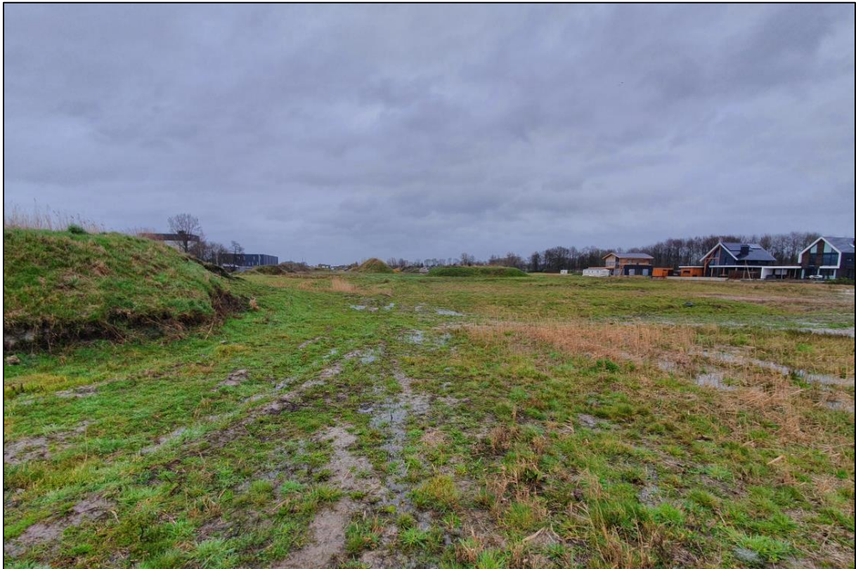
Figuur 2. Het plangebied bestaat vooral uit braakliggend terrein met relatief lage natuurwaarden.

het plangebied maar één grote boom aanwezig, waardoor kan worden uitgesloten dat er sprake is van een meld- of herplantingsplicht met betrekking tot houtopstanden.