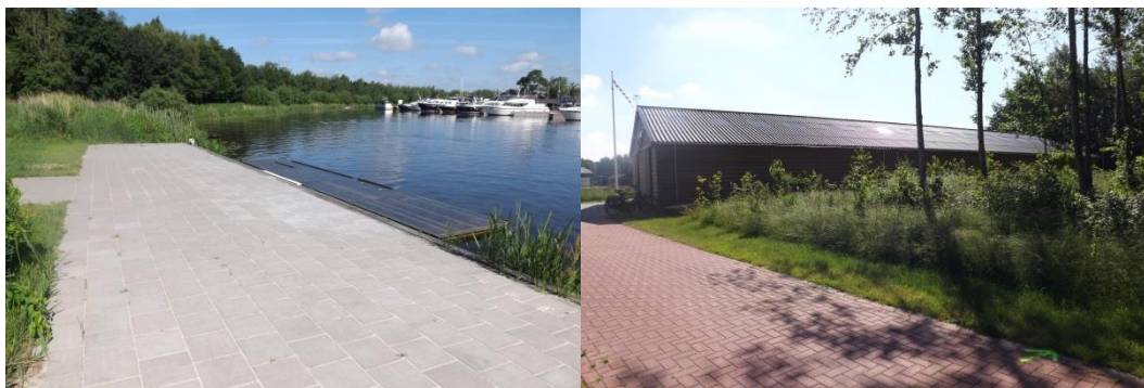
Figuur 7. Deelgebied 1 locatie steiger (links) en locatie nieuwbouw (rechts).

iets vergroot. Hiertoe wordt enige beplanting verwijderd. Voor de verharding wordt gebruik gemaakt van grastegels.