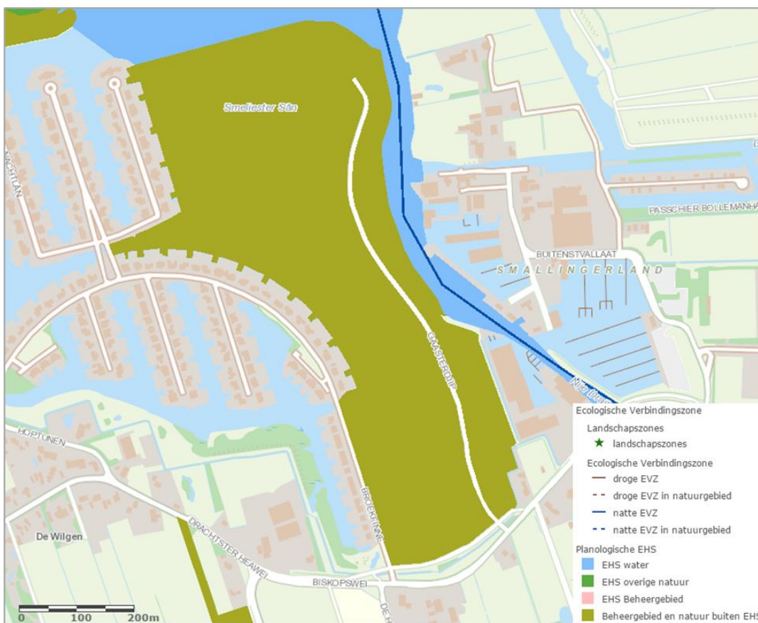
Figuur 6. Uitsnede Natuurkaart Verordening Romte Fryslân 2014

Het plangebied is gelegen in een gebied dat de Provincie Fryslân aangewezen heeft als 'Natuur buiten de EHS', weergegeven in navolgende figuur. Op basis van de Verordening Romte stelt de provincie dat op basis van de artikelen 7.2.1 en 7.2.4 onderdeel c van toepassing zijn en dat compensatie moet plaatsvinden.