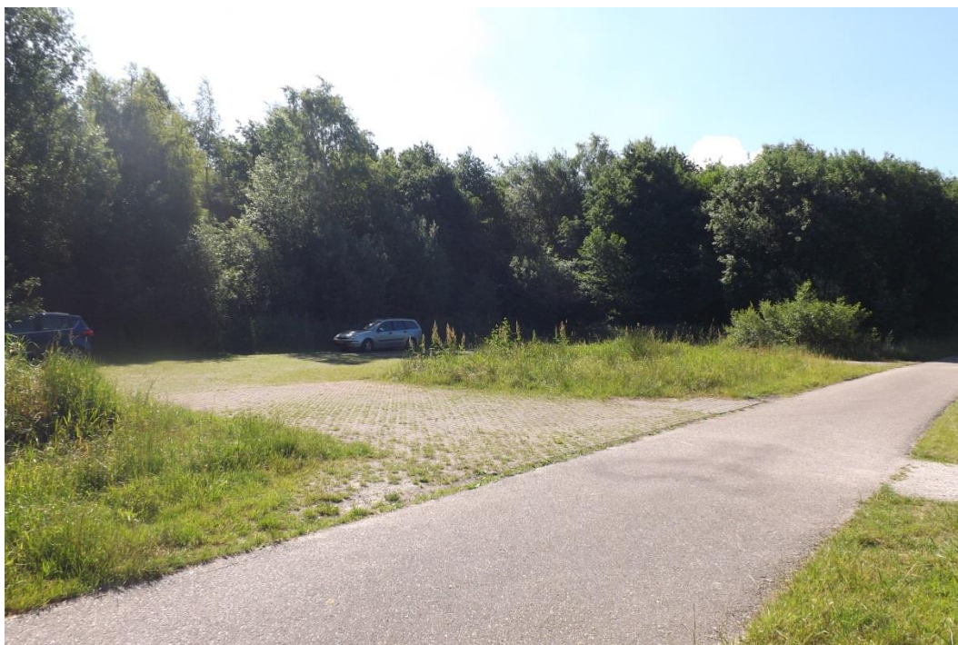
Figuur 8. Deelgebied 2 Parkeerplaats met grasstenen.