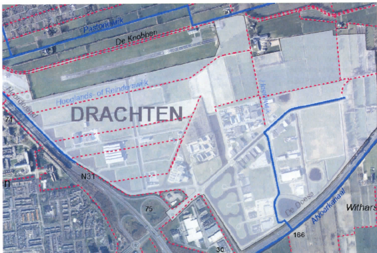
Figuur 1, overzicht locatie met aangegeven de hoofdwaterring, blauwe lijn en schouwwatergangen, blauwe stippellijn