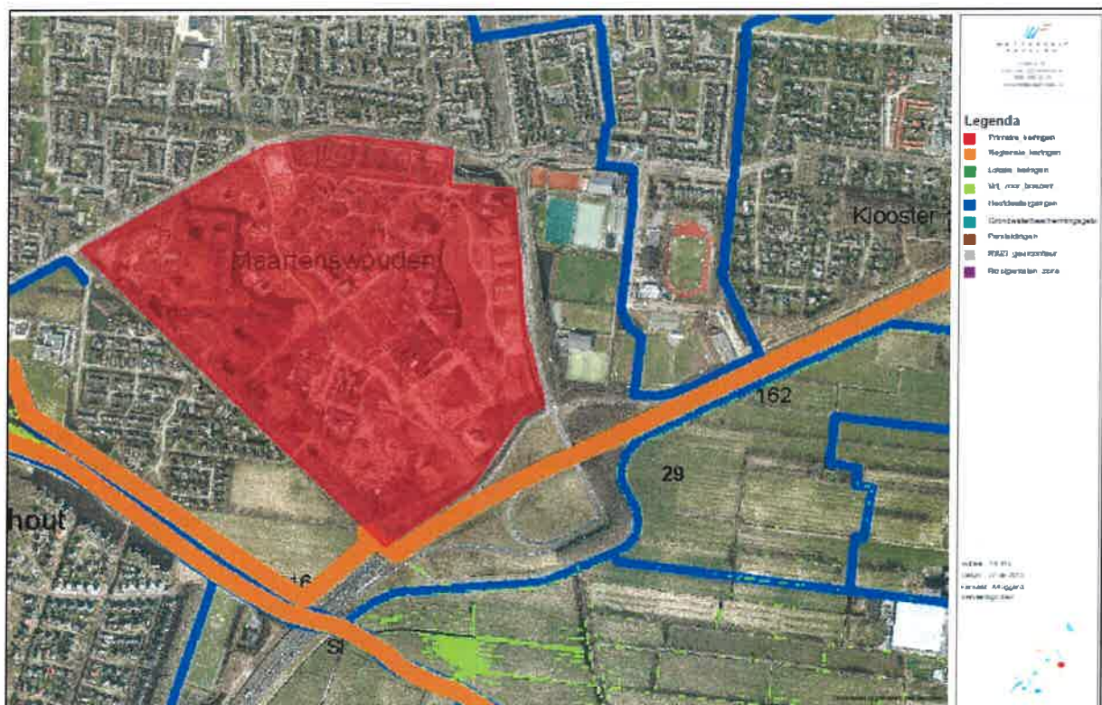
Figuur 1, overzicht plangebied

G. Oosterwoud, J. Gerbensma, H. Grasman en w.dijkstra@smallingerland.nl