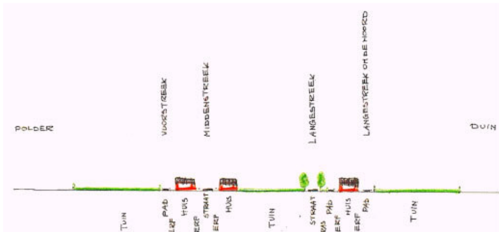
Afbeelding 8 Dwarsprofiel van het dorp