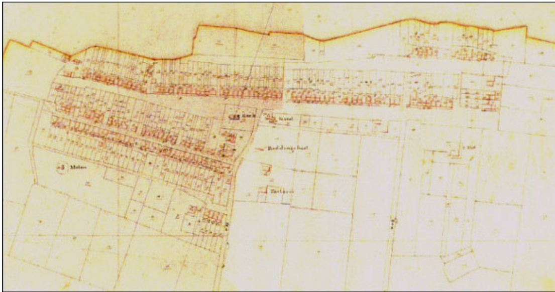
Afbeelding 1 Situatie 1830