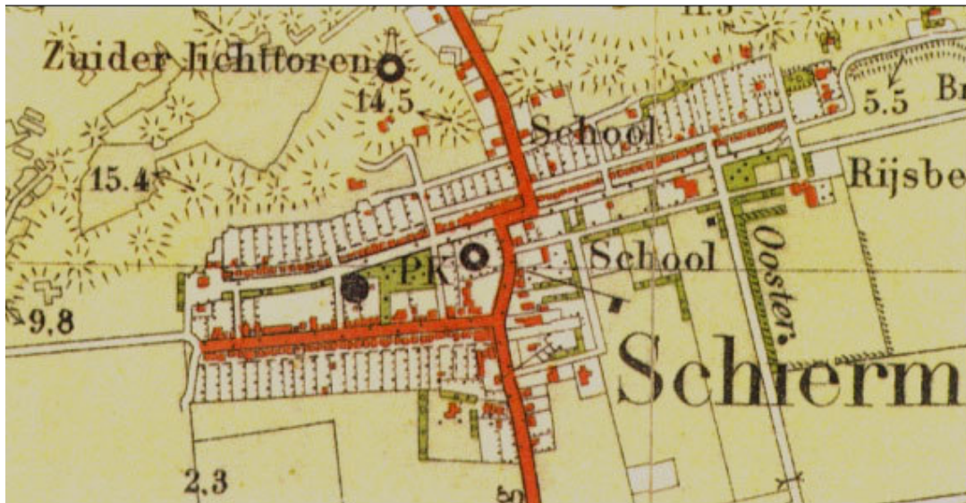
Afbeelding 3 Situatie 1927