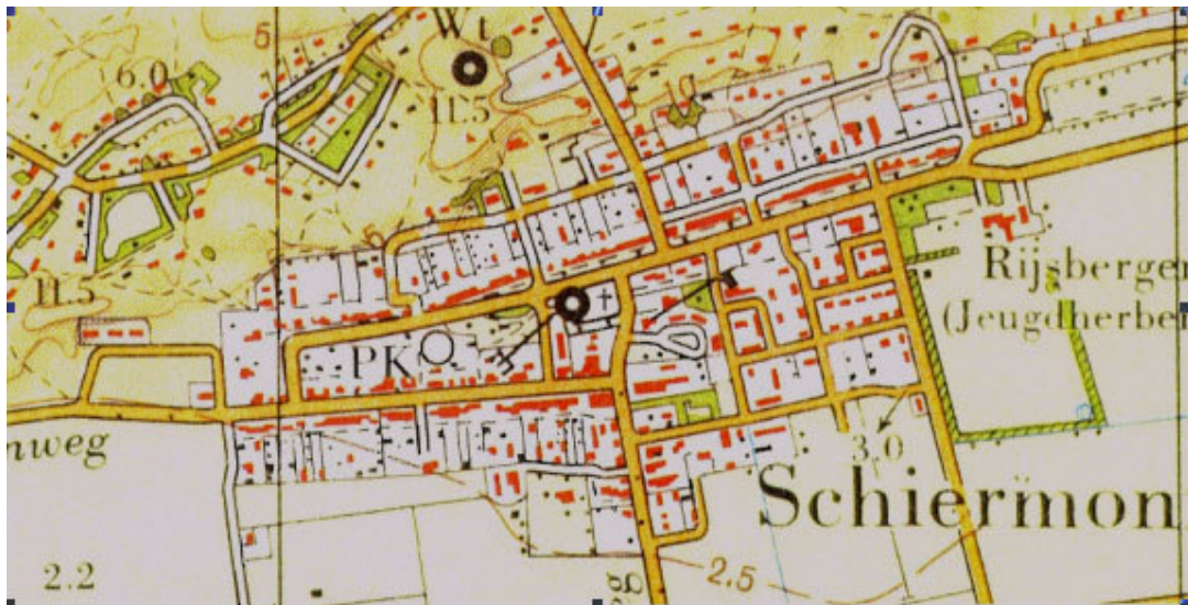
Afbeelding 4 Situatie 1969