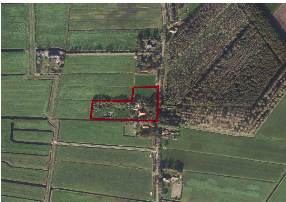
Figuur 1 Begrenzing van het plangebied.

Het perceel De Warren 17 is gelegen ten noordwesten van Tijnje. De Warren is een zijweg van de Warrewei. Het perceel De Warren bevindt zich ten noorden van de Warrewei. Aan de noordkant komt De Warren uit op een T-splitsing op de Riperwei. De Warren 17 is een landelijk gelegen perceel en grens direct aan een bosrand.