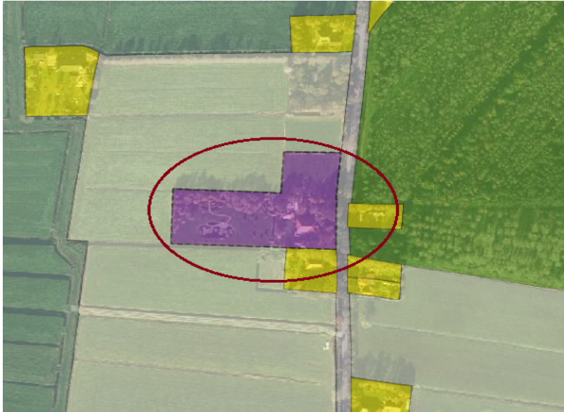
Figuur 2 uitsnede uit het bestemmingsplan

Om de bestemming te wijzigen moet toepassing gegeven worden aan artikel 5.7 onder a van het bestemmingsplan. In dit wijzigingsplan wordt geregeld dat het bestemmingsvlak van 'Bedrijf' wordt gewijzigd in de bestemming 'Wonen - Woonboerderij'.