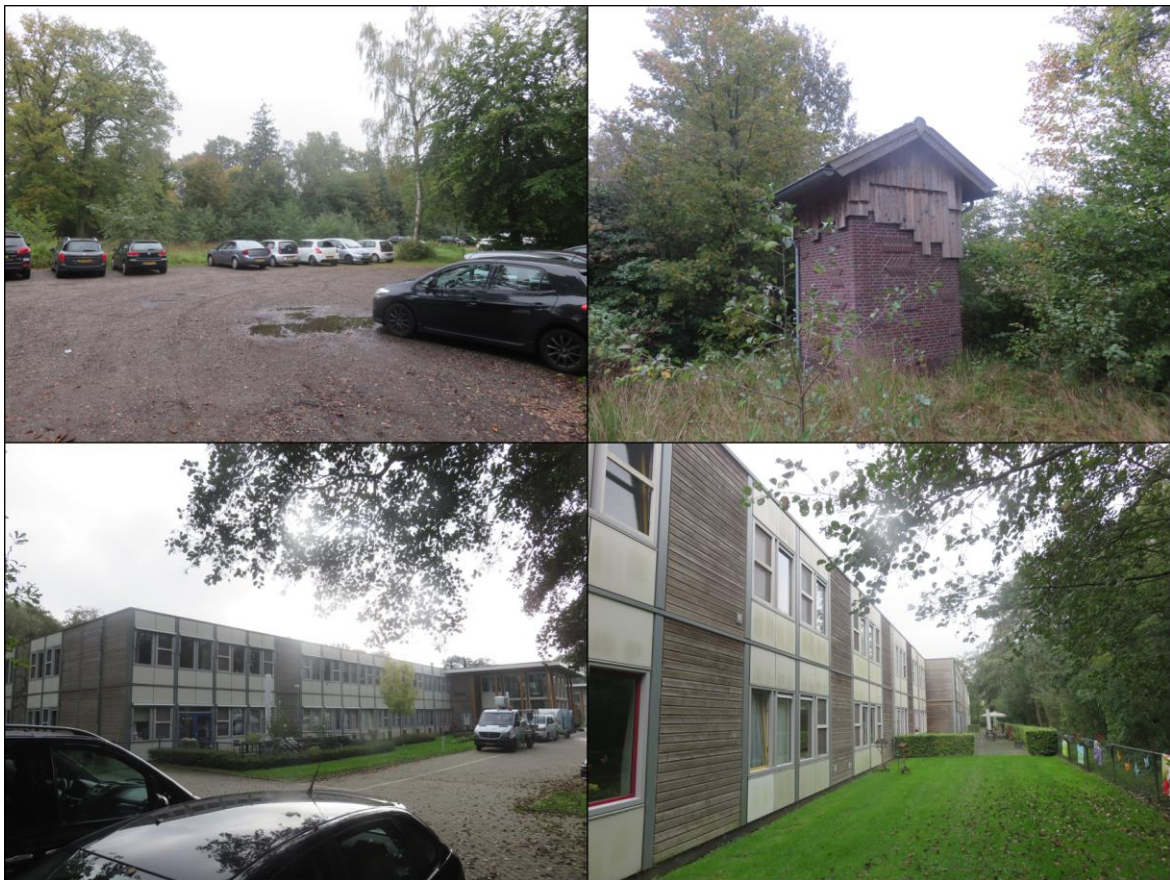
Figuur 1.2. Impressie van het plangebied.

Het planvoornemen bestaat uit het realiseren van een nieuwe zorginstelling op het perceel Commissieweg 3 en de sloop van de bestaande zorginstelling op het perceel Commissieweg 5. Binnen het huidige planvoornemen worden geen demp- en oeverwerkzaamheden aan de sloten binnen en vlak buiten het plangebied uitgevoerd.