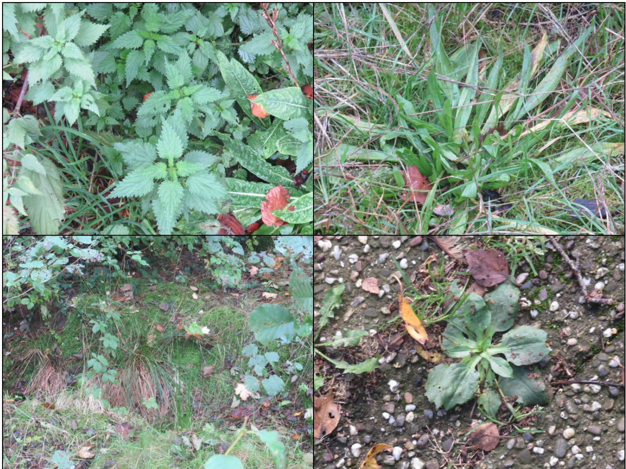
Figuur 2.1. Impressie van de flora in het plangebied met v.l.b.n.r.o.: grote brandnetel, smalle weegbree, braam (spec.) en brede weegbree.