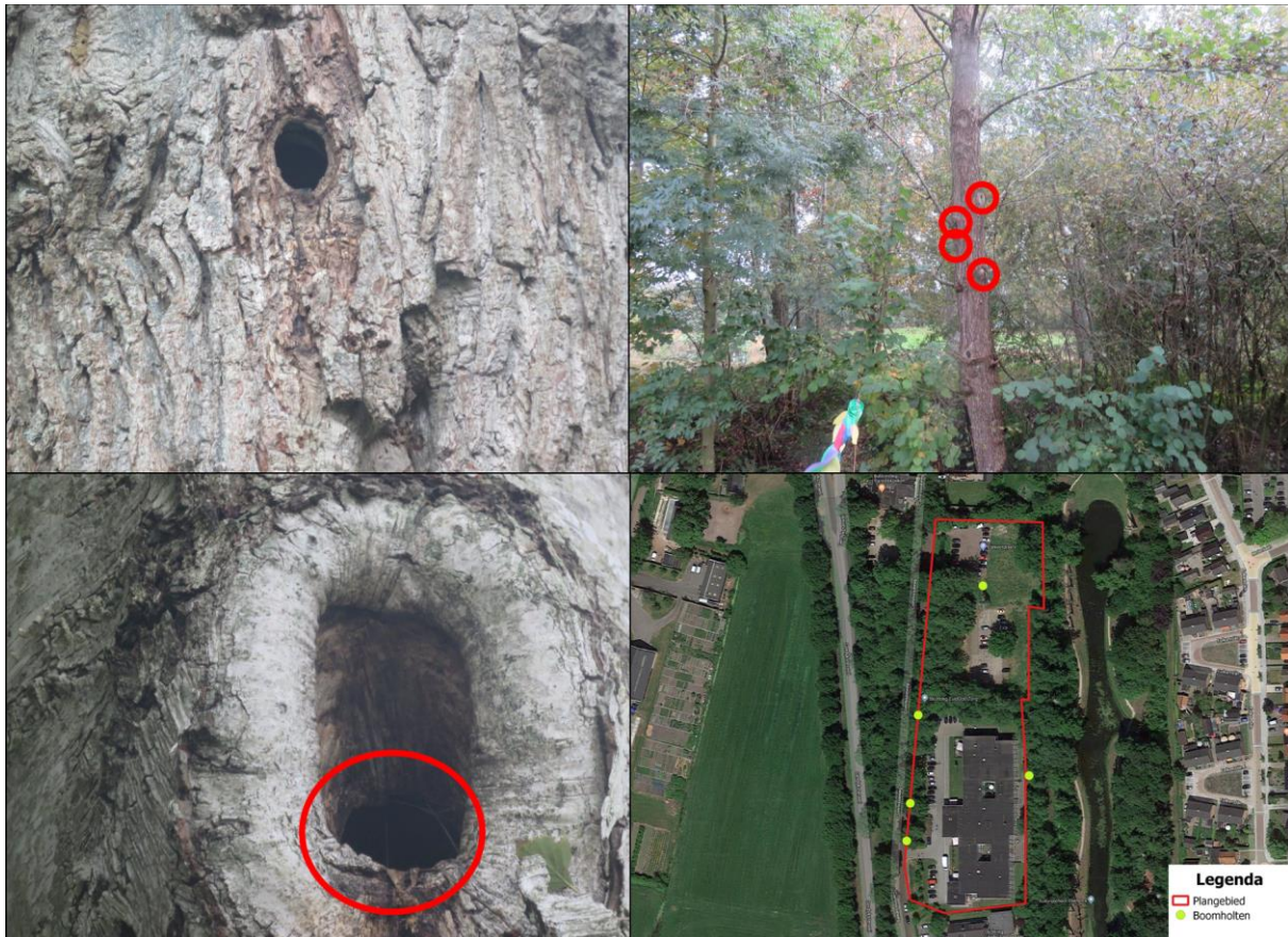
Figuur 2.4. Aangetroffen boomholten binnen het plangebied en de locatie hiervan.

De bestaande gebouwen binnen het plangebied zijn tevens gecontroleerd op openingen en ruimten welke kunnen functioneren als (toegangen tot) verblijfplaatsen van vleermuissoorten als de gewone dwergvleermuis. Hierbij is de geschiktheid van de vleermuistoren vanzelfsprekend. Dit correspondeert met meerdere waarnemingen van de gewone dwergvleermuis, de ruige dwergvleermuis en de laatvlieger in de directe omgeving van de vleermuistoren (figuur 2.5). Echter, doordat deze onderdeel is van eerdere compensatie van verblijfplaatsen van vleermuizen in de voormalige school aan de commissiewei, dient deze gehandhaafd te blijven. Wanneer er geen werkzaamheden worden uitgevoerd aan en rondom deze vleermuistoren, kunnen negatieve effecten op deze verblijfplaatsen op voorhand worden uitgesloten. Hiernaast zijn er onder de daklijst van de zorginstelling openingen aangetroffen welke mogelijk als doorgangen tot verblijfplaatsen van vleermuizen kunnen functioneren (figuur 2.6). De aanwezigheid van verblijfplaatsen in de zorginstelling kan derhalve niet worden uitgesloten.