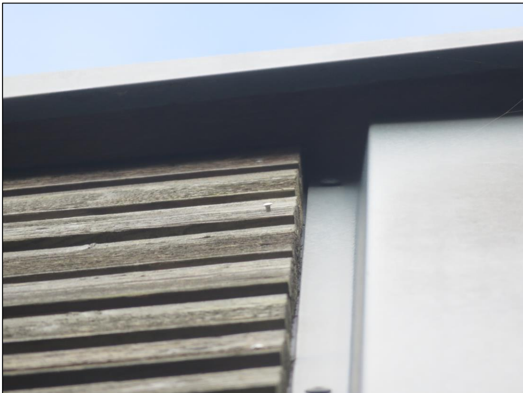
Figuur 2.6. Ruimte onder de daklijst van de zorginstelling.