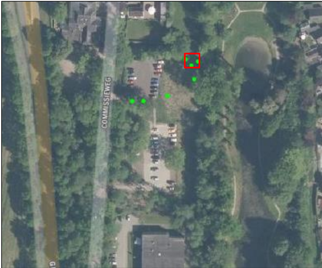
Figuur 2.7. Waarnemingen van de gewone dwergvleermuis, ruige dwergvleermuis en laatvlieger (groen) in de directe omgeving van de vleermuistoren (rood).