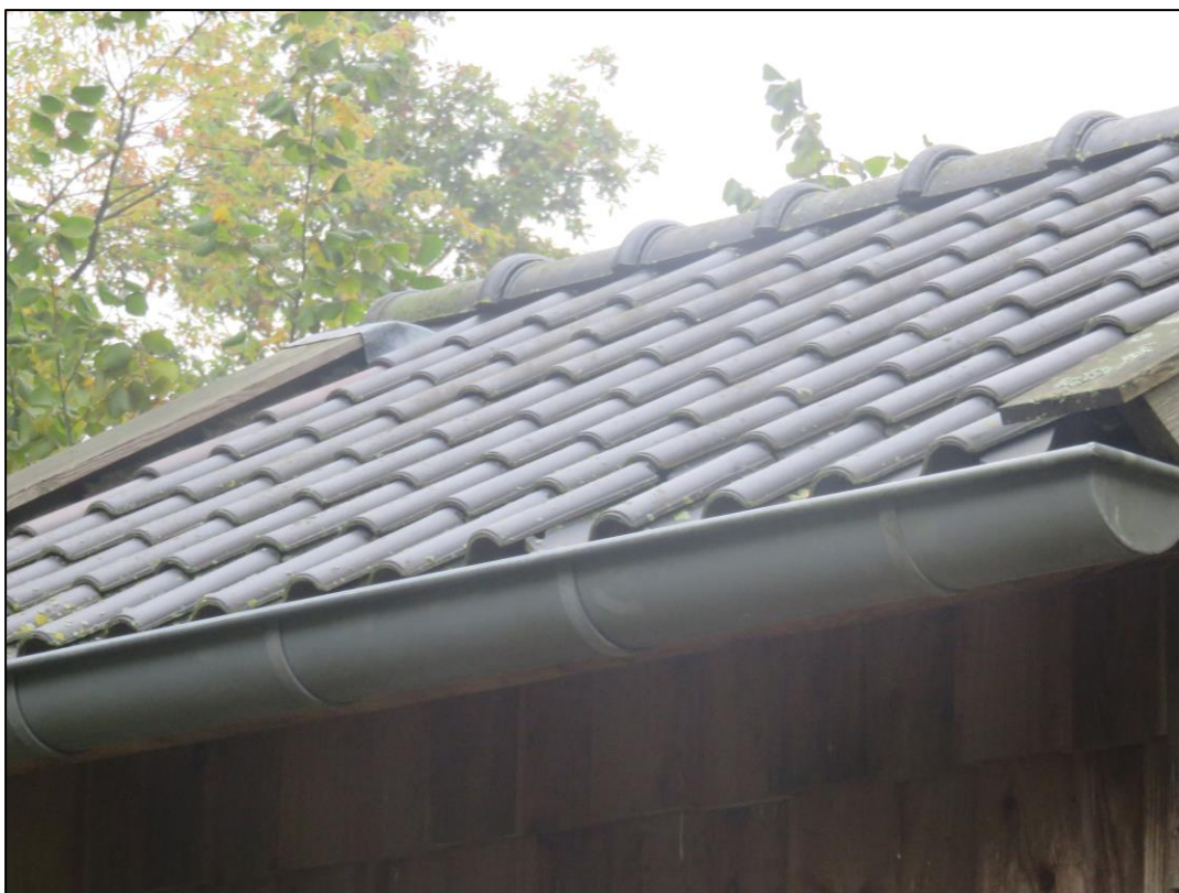
Figuur 2.3. De vleermuistoren te Beetsterzwaag, Commissieweg