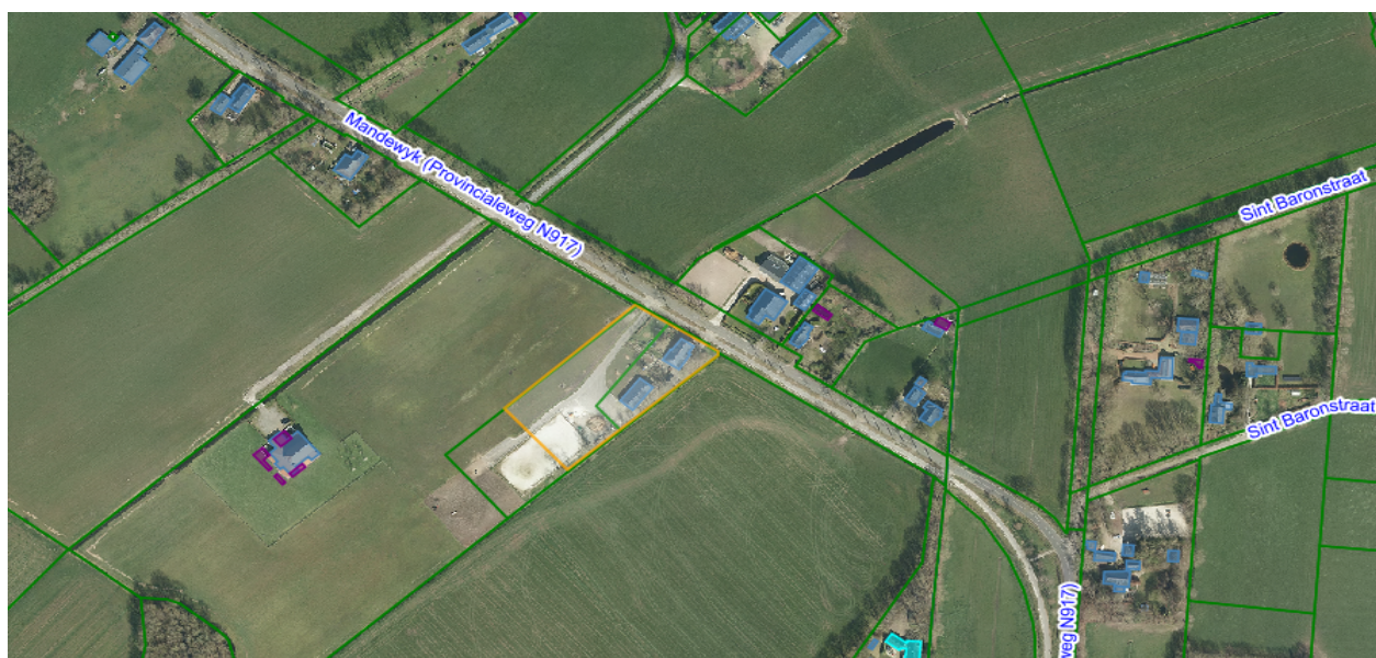
Figuur 1 Begrenzing van het plangebied.

Het perceel Mandewyk 18 is gelegen ten zuidoosten van Bakkeveen aan de weg naar Waskemeer.