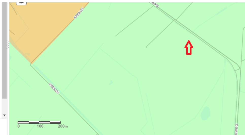
Figuur 3 Archeologische waarden Mandewyk 18 Bakkeveen, IJzertijd en Middeleeuwen (rode pijl)

Help . Trust Center . Juridisch . Contact opnemen met Esri . Misbruik melden . Contact