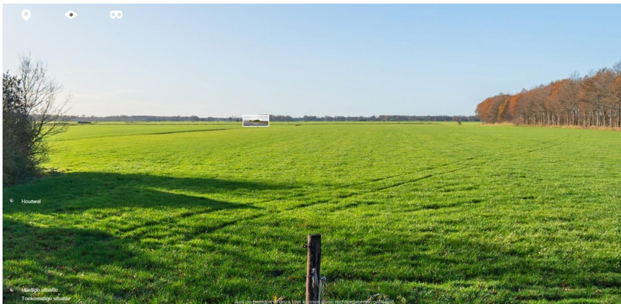
Huidige situatie (vanuit fotopunt Houtwal)

Voor de landschappelijke inpassing van het project is een 3D visualisatie gemaakt door The Imagineers. Dit bureau werkt op zeer gedetailleerde wijze de visualisaties uit, waarbij ook wordt gewerkt met de hoogteligging van percelen. Vanaf de Houtwal is een fotopunt gemaakt van waaruit de huidige en toekomstige situatie in beeld is gebracht. Dat is hieronder weergegeven. De visualisatie laat zien dat het project het vrije uitzicht niet gaat belemmeren en het open landschap behouden en beleefbaar blijft.