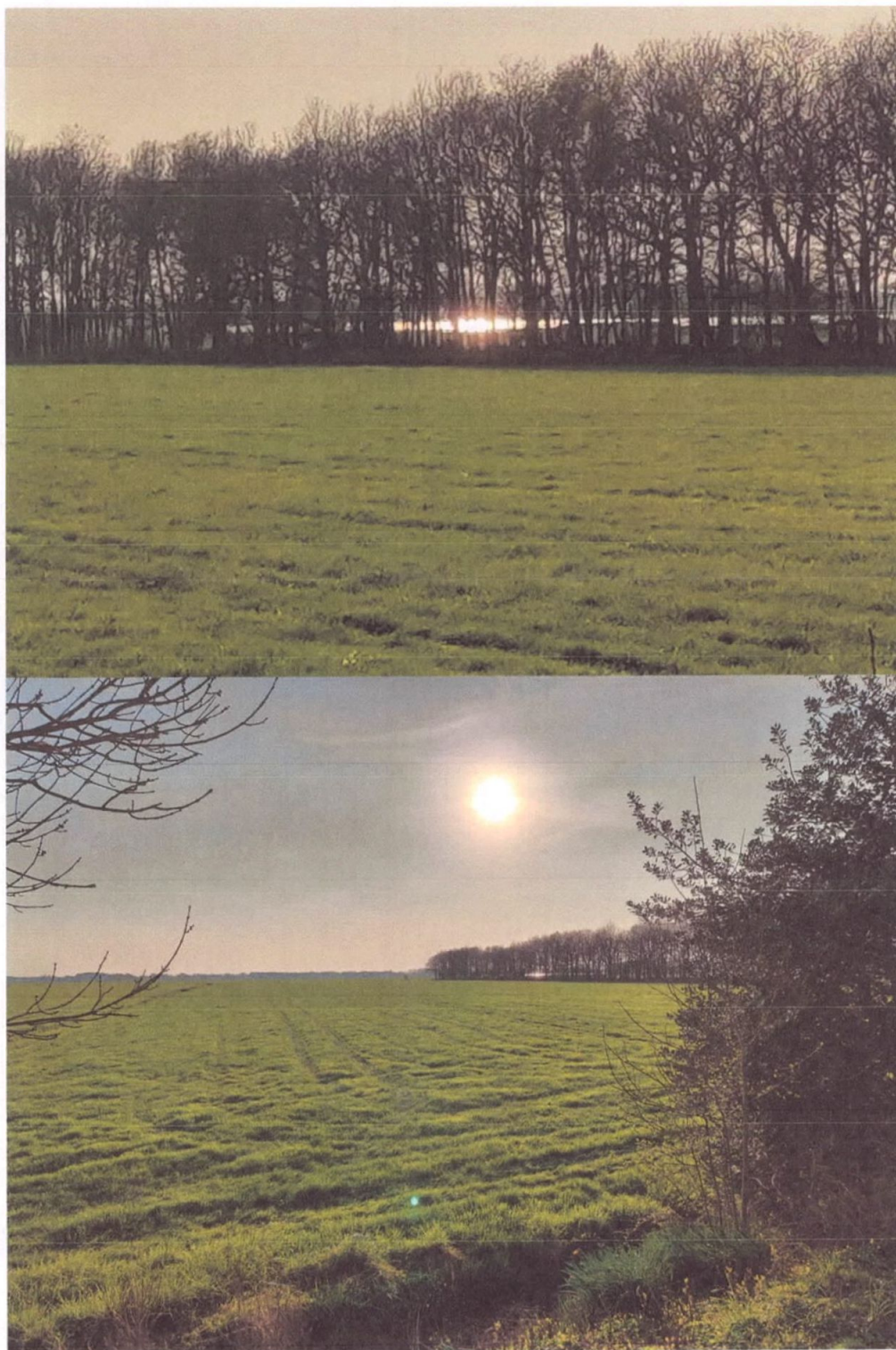
foto genomen 7-4-2019 om 18:40 vanuit onze achtertuin van houtwal . Richting het bestaande zonnepark fase 1. het bestaande park is voor ons nu nog niet hinderlijk, deze zit volledig achter de bomenwal verscholen. Maar is ondanks dat toch goed zichtbaar. Maar we zijn heel bang dat het park zo groot word dat de gehele horizon vanuit de achtertuin (waar wij graag zitten) straks zon zonnepark zichtbaar is. Foto 1 is ingezoomd, foto2 is normaal. (het nieuwe zonnepark komt veel dichterbij)