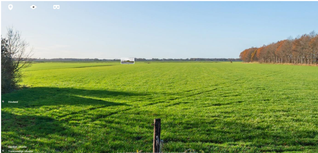
Toekomstige situatie met zonnepanelen (vanuit fotopunt Houtwal)

Ten aanzien van de schittering van de zonnepanelen merken wij op dat zonnepanelen vaak in verband worden gebracht met reflectie van licht. Moderne zonnepanelen hebben echter niet veel reflecties om de eenvoudige reden dat licht dat gereflecteerd wordt niet effectief is voor het opwekken van elektriciteit. Paragraaf 4.2 van de ruimtelijke onderbouwing gaat in op reflecties en laat zien dat er geen sprake zal zijn van hinder voor de omgeving. Voor het toe te passen zonnepaneel wordt in beginsel uitgegaan van het paneel REC Twinpeak 72 Series range 330-345 of het paneel WP REC Twinpeak 2 Serie range 275-300 WP. Voor dit type panelen is het percentage reflecties 3 à 5% bij een normale lichtinval (zie: