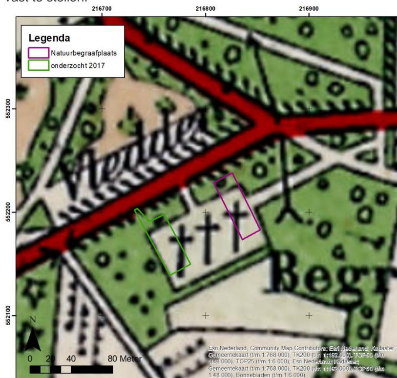
Afbeelding 2. Historische kaart circa 1940 (Esri Nederland/Kadaster, top25)

De begraafplaats verschijnt in het kaartbeeld in de jaren '20 van de 20 e eeuw (zie afb. 2). Tot en met de jaren '50 lijkt de omvang van de begraafplaats groter te zijn en ook grotendeels het huidige plangebied te omvatten. Of er daadwerkelijk begravingen hebben plaatsgevonden ter plekke van het plangebied is op basis van de beschikbare bronnen niet vast te stellen.