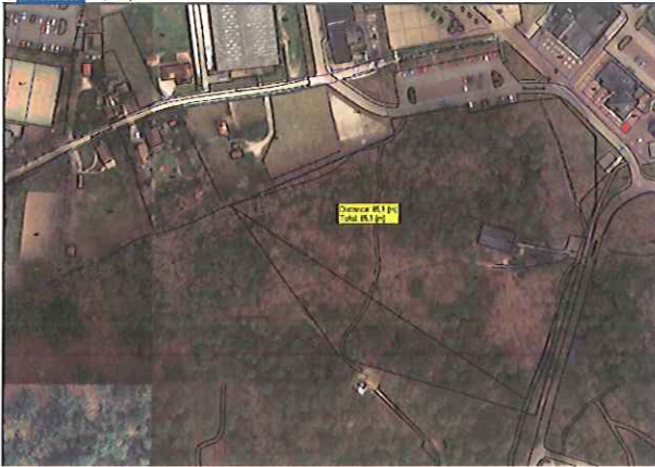
Afstand tot de woning