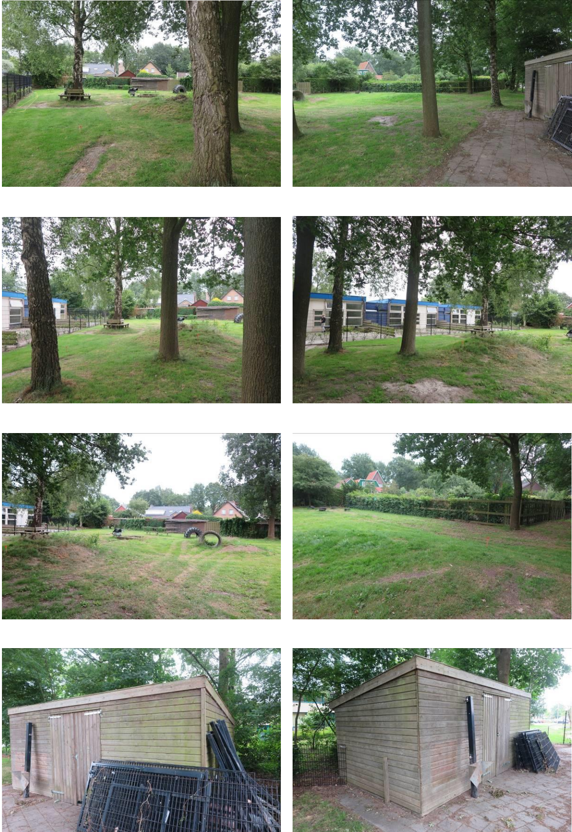
Figuur 2. Foto-impressie van het plangebied ten zuiden van de Boekhorsterweg 21 te Oosterwolde.