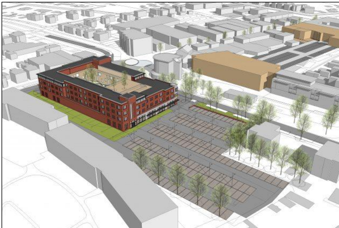
Figuur 3. Impressie van de plansituatie op de hoek van de Dertien Aprilstraat en de Snellingerdijk te Oosterwolde.