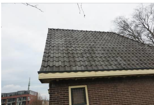
Vervolg figuur 2. Foto-impressie van het plangebied op de hoek van de Dertien Aprilstraat en de Snellingerdijk te Oosterwolde.