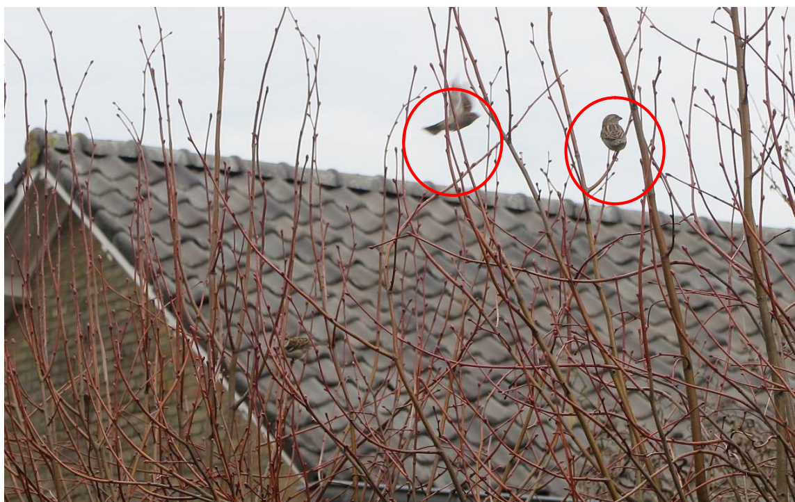
Figuur 4. De huismus in het plangebied op de hoek van de Dertien Aprilstraat en de Snellingerdijk te Oosterwolde.