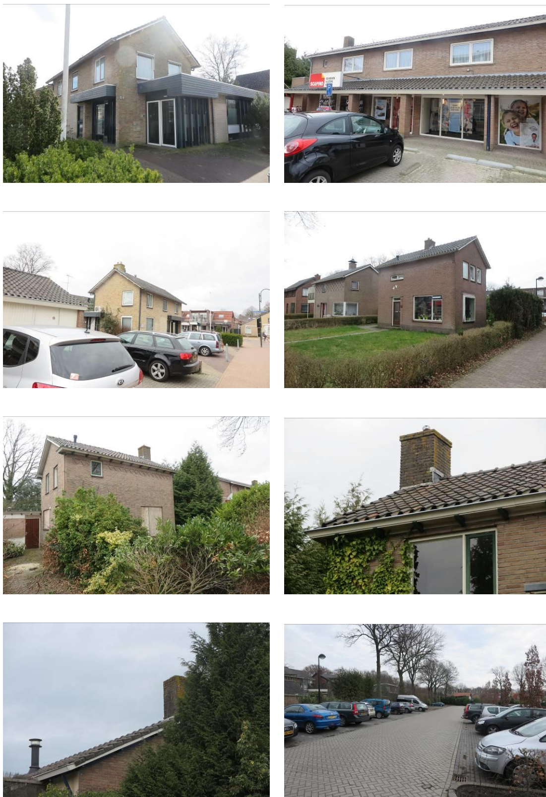
Figuur 2. Foto-impressie van het plangebied op de hoek van de Dertien Aprilstraat en de Snellingerdijk te Oosterwolde.