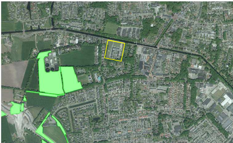
Ligging van Natuurnetwerk Nederland (groene kleur) in de omgeving van het plangebied.

Het plangebied ligt buiten het NNN. Gronden die tot het NNN behoren liggen op minimaal 270 meter afstand van het plangebied. Op onderstaande afbeelding wordt de ligging van het NNN in de omgeving van het plangebied weergegeven. De ligging van het plangebied wordt met de gele lijn aangeduid.