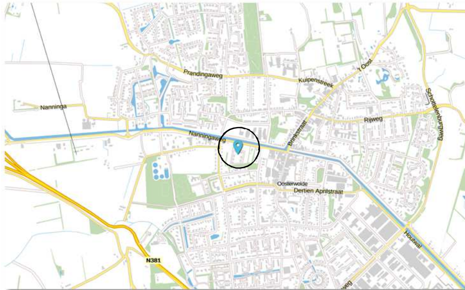
Globale ligging van het plangebied. De ligging van het plangebied wordt met de cirkel aangeduid.

Het plangebied is gesitueerd aan de Wrongel (ongenummerd) in Oosterwolde. Het ligt in de kern Oosterwolde en wordt aan alle zijden omgeven door stedelijk gebied. Op onderstaande afbeeldingen wordt de globale ligging van het plangebied aangeduid met de cirkel.