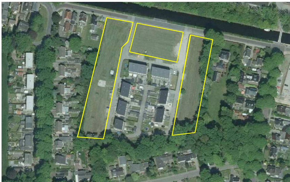
Detailweergave en begrenzing van het plangebied.

Het plangebied bestaat uit drie, naast elkaar gelegen percelen grasland (gazon), van elkaar gescheiden door een verharde weg. Aan de westzijde van het plangebied staan enkele speeltoestellen in het gazon. Op onderstaande luchtfoto wordt het plangebied in detail weergegeven.