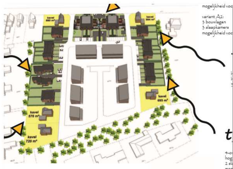
Impressie van de mogelijke inrichting van het plangebied

Het concrete voornemen bestaat om het plangebied te ontwikkelen als woningbouwlocatie voor de realisatie van grondgebonden woningen. Op onderstaande afbeelding wordt een impressie gegeven van het mogelijke eindbeeld van het plangebied na planrealisatie.