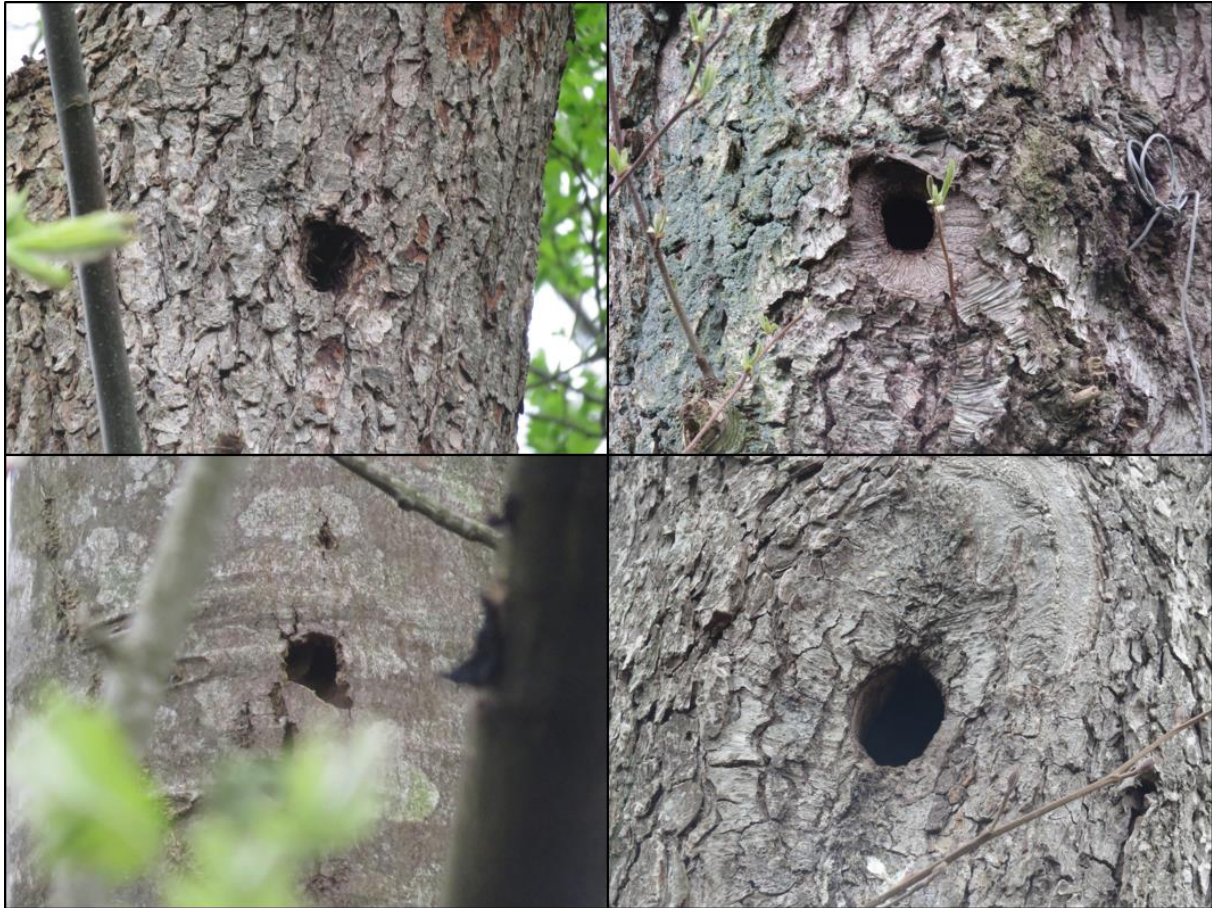
Figuur 2.3. Boomholten binnen het plangebied die mogelijk verblijfplaatsen van vleermuizen vormen.

Naast verblijfplaatsen van vleermuizen, kunnen ook vliegroutes en/of foerageergebieden van vleermuizen een beschermde status hebben als deze van essentieel belang zijn voor het in stand houden van een verblijfplaats. Als vliegroute worden afhankelijk van de soort waterlichamen, bosranden, bomenlanen of gebouwen gebruikt. Door het verwijderen van de beplantingsstrook worden er mogelijk vliegroutes doorbroken. Er zijn echter in de directe omgeving alternatieve vliegroutes en foerageergebieden aanwezig. Negatieve effecten op essentiële vliegroutes of foerageergebieden kunnen daarom op voorhand worden uitgesloten.