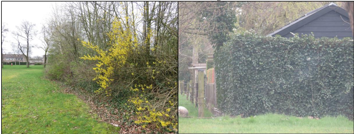
Figuur 2.2. Nestgelegenheid voor merel in de vorm van hagen en struiken binnen, en tegen het plangebied

Naast de aanwezigheid van jaarrond beschermde nesten is het plangebied ook beoordeeld op waarden voor broedvogels waarvan de nesten niet jaarrond beschermd zijn. De nesten van deze soorten zijn uitsluitend beschermd tijdens het broedproces. Het plangebied biedt mogelijkheden voor diverse soorten broedvogels. Tijdens het veldbezoek zijn soorten aangetroffen als pimpelmees, merel en spreeuw. Binnen de beplantingsstrook zijn er voldoende mogelijkheden aangetroffen in de vorm van hagen en struiken waar de soort merel in tot broeden kan komen. Hiernaast staat er zuidelijk een haag tegen het plangebied aan waar deze soort ook in tot broeden zou kunnen komen (figuur 2.2).