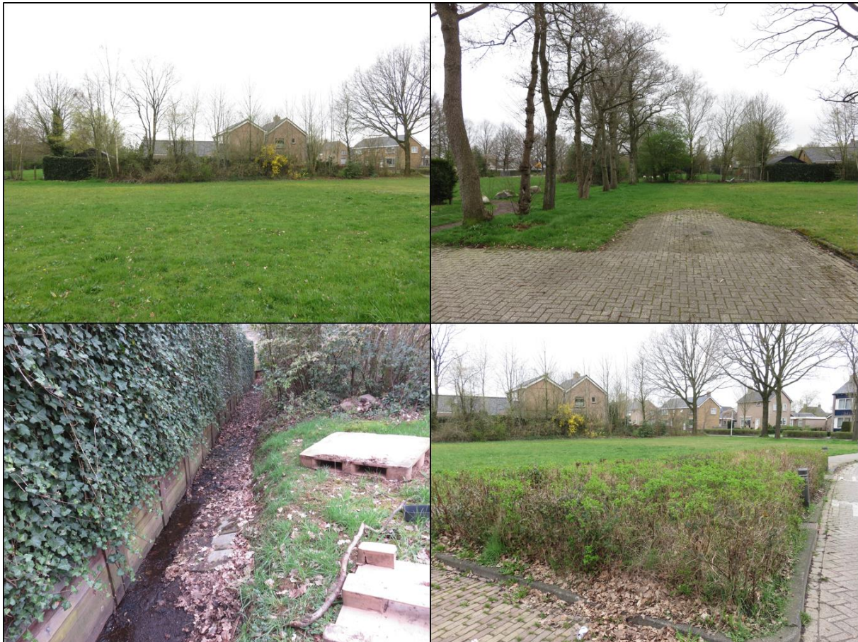
Figuur 1.2. Impressie van het plangebied.

Het planvoornemen bestaat uit het verwijderen van de beplantingsstroken en bomen en het realiseren van zeven woningen binnen het plangebied.