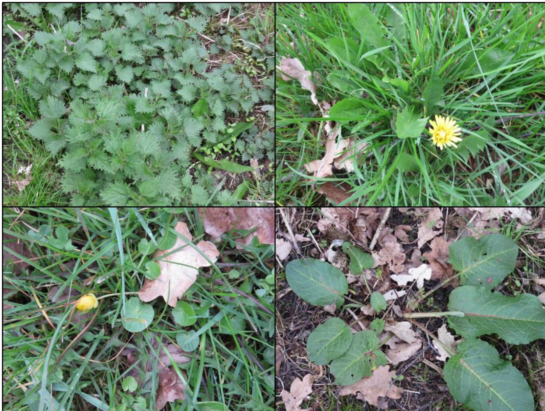
Figuur 2.1. Impressie van de flora in het plangebied met v.l.b.n.r.o.: grote brandnetel, paardenbloem, speenkruid en ridderzuring.