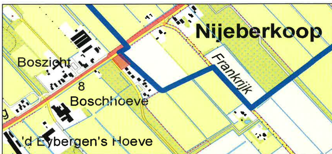
Figuur 1, overzicht locatie, rode vlak

Het plan bestaat uit een functiewijziging voor het realiseren van een woning. Onderstaande figuur toont de toekomstige inrichting van het gebied.