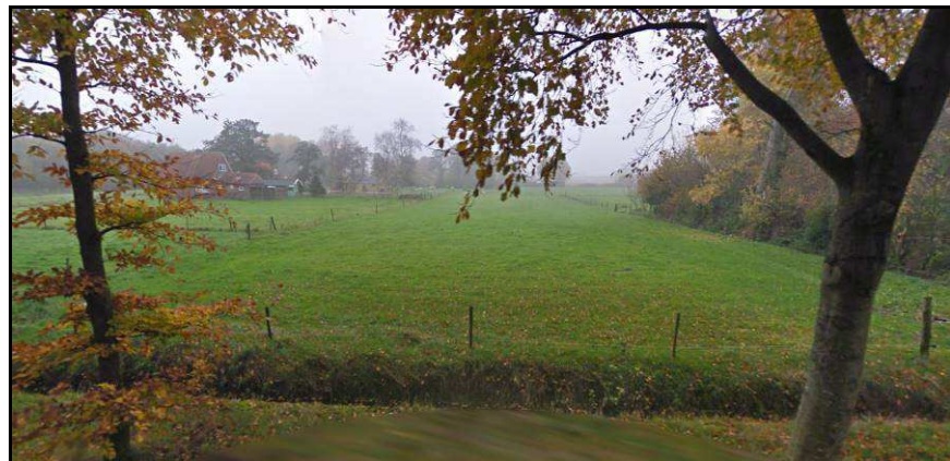
Afbeelding 1: Plangebied met op de bovenste foto de af te breken twee-onder-een-kapwoning en op de onderste foto het zuidelijker gelegen perceel grasland.

In het kader van de plannen voor de bouw van twee vrijstaande woningen zal de bodem worden verstoord.