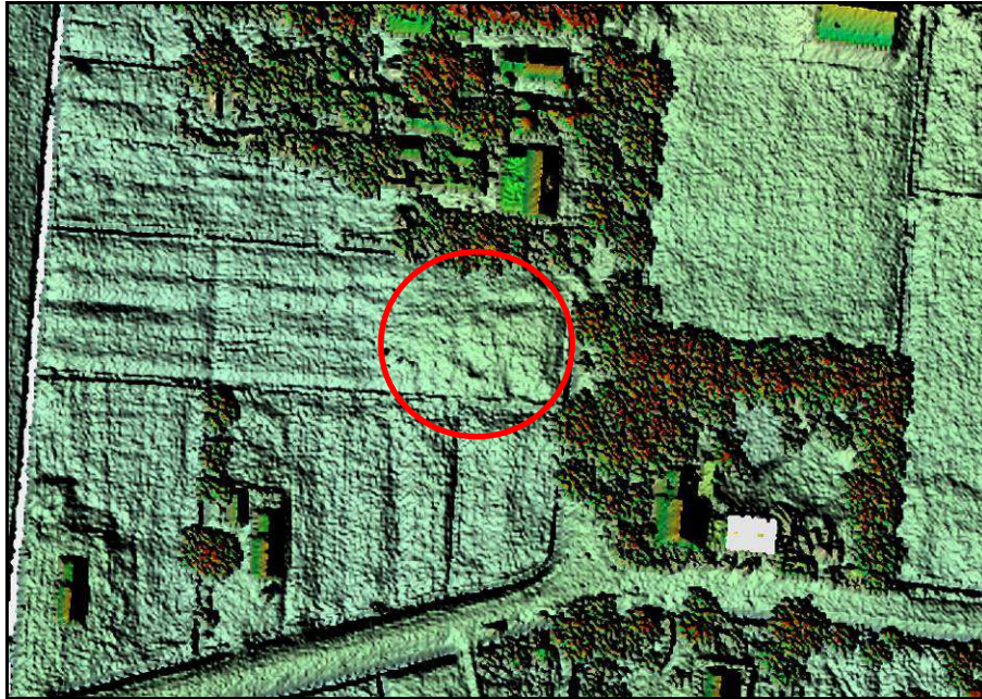
Afbeelding 5: Uitsnede uit het Actueel Hoogtebestand Nederland met binnen de rode cirkel het 'geroerde' deel van perceel nr. 1751.