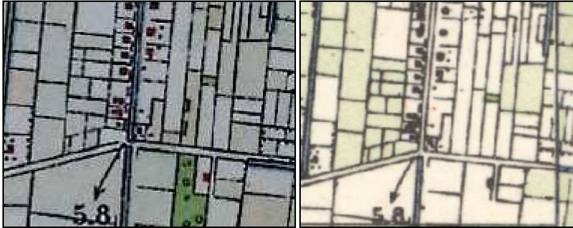
Afbeelding 3: Links een uitsnede uit de Bonnekaart uit 1927 en rechts een uitsnede uit de topografische kaart uit circa 1950.