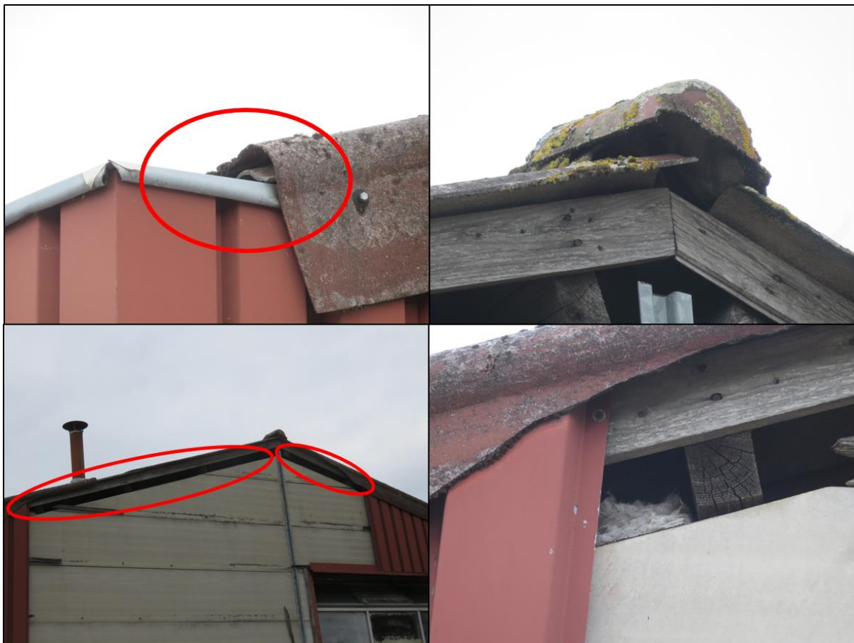
Figuur 2.2. Holten waar broedvogels als huismus en gierzwaluw tot broeden kunnen komen en een opening tussen plafond en dak van de bebouwing.

Het plangebied is tevens gecontroleerd op jaarrond beschermde nesten van vogels die over het algemeen vaker in bebouwing tot broeden komen, zoals de kerkuil, huismus en gierzwaluw. Voor de gierzwaluw zijn er rondom de bebouwing voldoende kieren en gaten met geschikte in- en uitvliegopeningen aangetroffen welke deze soort als nestgelegenheid kan gebruiken. Hiernaast zijn er voldoende openingen en holten aangetroffen die als nestgelegenheid voor de huismus kunnen functioneren (figuur 2.2). Het voorkomen van deze soorten kan hierdoor niet op voorhand worden uitgesloten. De kerkuil maakt gebruik van ruimten met grotere in- en uitvliegmogelijkheden. Tijdens het veldbezoek is er een relatief grote open ruimte aangetroffen tussen het plafond en het dak van de overdekte werkplaats (figuur 2.2). Echter zijn er geen sporen van deze soort aangetroffen in de vorm van uitwerpselen of braakballen. Hiernaast is deze ruimte voor de soort kerkuil aan de kleine kant en is de omgeving dusdanig ongeschikt dat het voorkomen hiervan zeer onwaarschijnlijk wordt geacht.