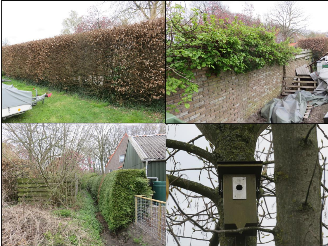
Figuur 2.3. Nestgelegenheid voor merel in de vorm van hagen en struiken binnen en tegen het plangebied en een vogelkast vlak buiten het plangebied.