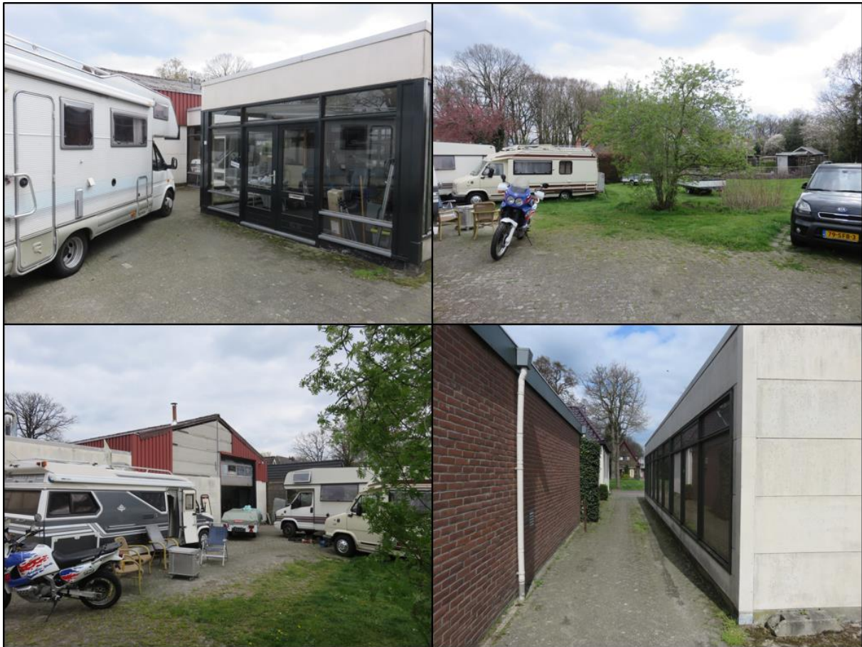
Figuur 1.2. Impressie van het plangebied.

Het planvoornemen bestaat uit het slopen van de bestaande bebouwing op het perceel Houtwal 13 te Oosterwolde.