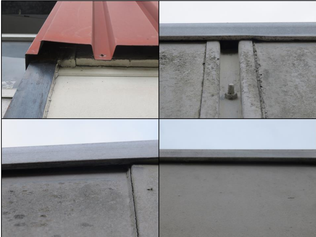
Figuur 2.4. Kieren en gaten rondom de bebouwing die mogelijk toegangen tot verblijfplaatsen van vleermuizen vormen.

Naast verblijfplaatsen van vleermuizen, kunnen ook vliegroutes en/of foerageergebieden van vleermuizen een beschermde status hebben als deze van essentieel belang zijn voor het in stand houden van een verblijfplaats. Als vliegroute worden afhankelijk van de soort waterlichamen, bosranden, bomenlanen of gebouwen gebruikt. Mogelijk vormt de Opsterlândske Kompanjonsfeart welke noordelijk langs het plangebied stroomt een vliegroute en/of foerageergebied voor soorten als de meervleermuis. Wanneer er tijdens de werkzaamheden tussen zonsondergang en zonsopgang lichtuitstraling boven het wateroppervlak van de Opsterlândske Kompanjonsfeart plaatsvindt, kunnen deze soorten hier negatieve effecten van ondervinden. Het voorkomen van negatieve effecten op vliegroutes en/of foerageergebieden kan hierdoor niet op voorhand worden uitgesloten.