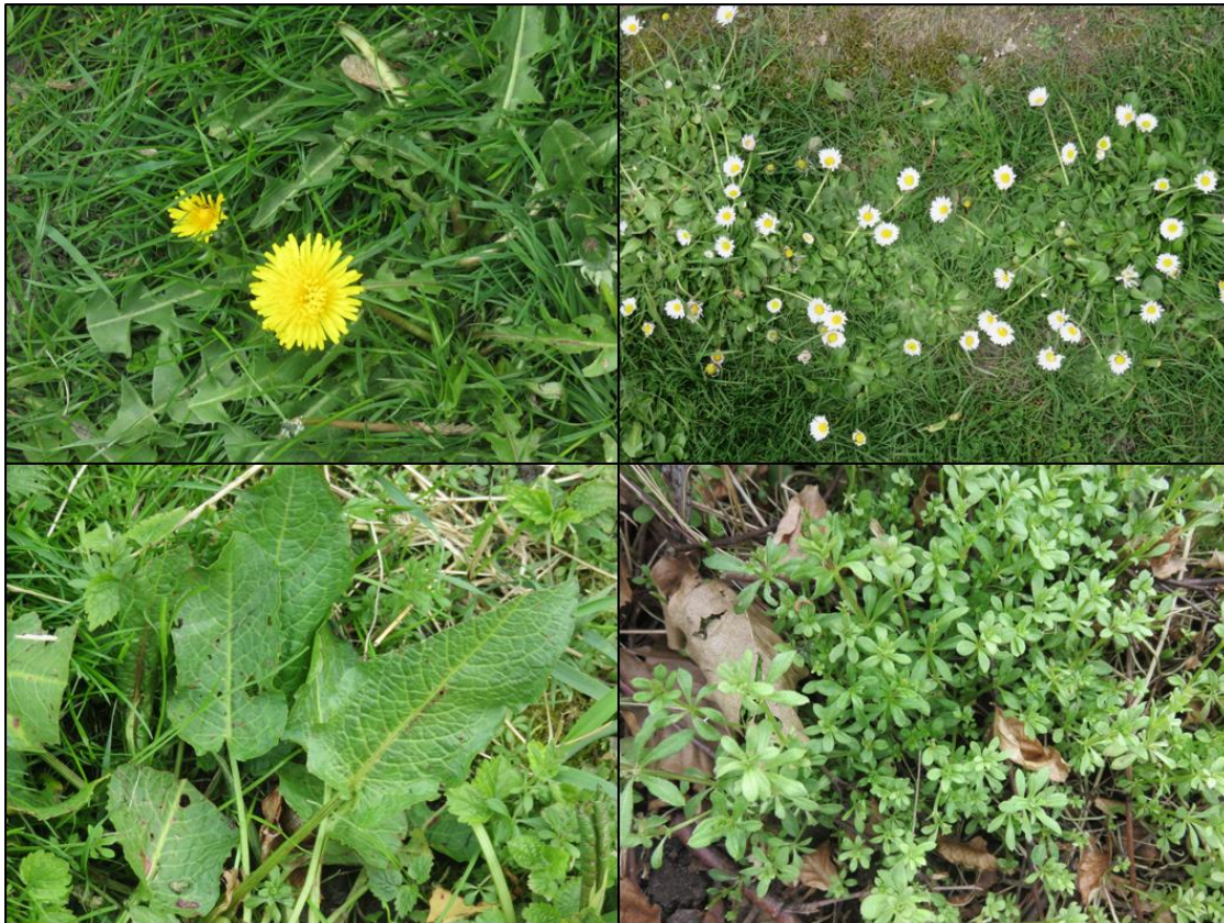
Figuur 2.1. Impressie van de flora in het plangebied met v.l.b.n.r.o.: paardenbloem, madeliefje, ridderzuring en kleeftkruid.