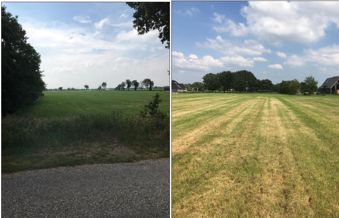
Afb. 1 Impressie van het plangebied op 27 juni 2020

Voorliggend addendum betreft een actualisatie van het onderzoek uit 2012 met als doel na te gaan of aanvullend onderzoek in het kader van de Wet natuurbescherming (Wnb) of het provinciaal ruimtelijk natuurbeleid noodzakelijk is. Deze actualisatie is opgesteld op basis van foto's van het plangebied op 27 juni 2020.