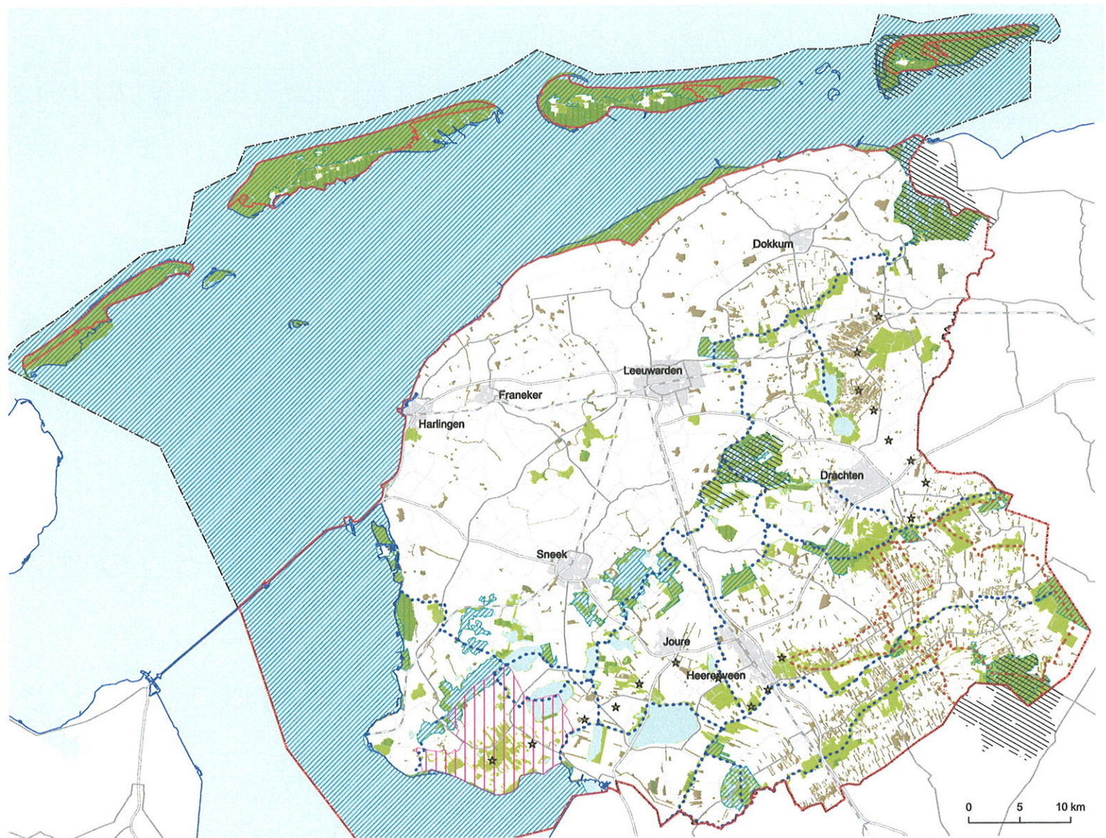
kaart 11 Provinciale Ecologische Hoofdstructuur