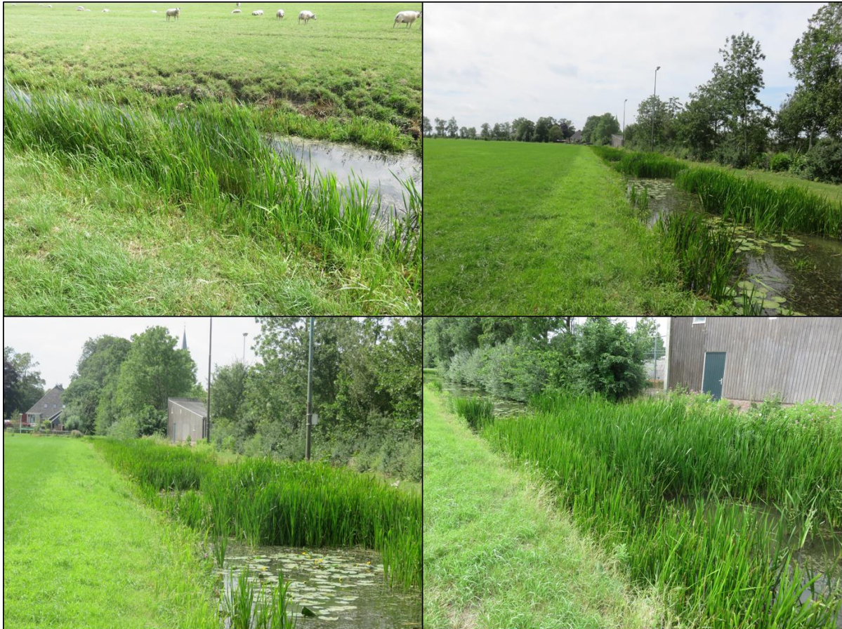
Figuur 2.2. suboptimale mogelijkheden voor de waterspitsmuis in de sloten langs het plangebied

Deze soort maakt gebruik van dichte oevervegetatie langs stilstaande tot sterk stromende wateren. Hierin biedt het plangebied enkele, suboptimale, mogelijkheden in de vorm van oevervegetatie van de sloten langs het plangebied (figuur 2.2). Echter, in de omgeving van het plangebied zijn geen waarnemingen van de soort bekend (bron: NDFF). Dit maakt dat het voorkomen van een leefgebied van de waterspitsmuis binnen het plangebied zeer onwaarschijnlijk wordt geacht. Het uitvoeren van nader onderzoek naar het voorkomen van een leefgebied van de waterspitsmuis is naar onzes inziens niet reëel. Binnen het plangebied kunnen tevens lichter beschermde (vrijgestelde) zoogdiersoorten voorkomen, zoals de veldmuis. Hoewel deze soorten voor ruimtelijke ingrepen zijn vrijgesteld binnen de provincie Fryslân, dient men zich wel te houden aan de voor deze soorten geldende zorgplicht.