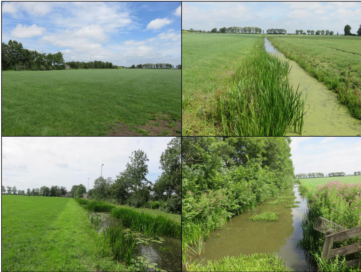
Figuur 1.2. Impressie van het plangebied.

Het planvoornemen bestaat uit het realiseren van nieuwe woningen en aanlegplaatsen voor boten op het perceel dat tot op heden voor landbouw wordt gebruikt. Deze aanlegplaatsen zullen noordwestelijk van het plangebied worden gerealiseerd. Hiernaast zullen enkele andere bodemwerkzaamheden worden uitgevoerd en worden de oevers van de sloten naar alle waarschijnlijkheid aangepast.