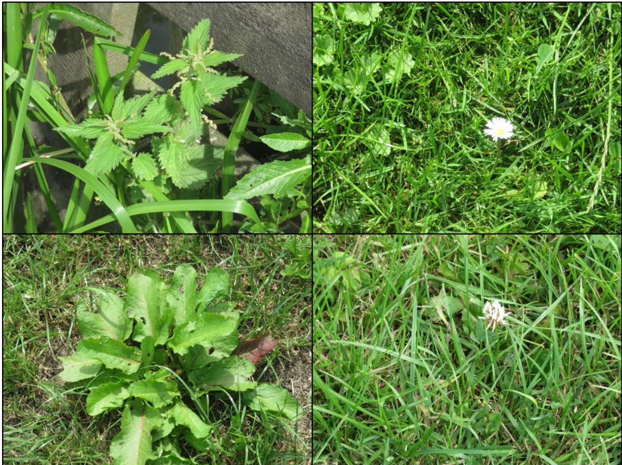
Figuur 2.1. Impressie van de flora in het plangebied met v.l.b.n.r.o.: grote brandnetel, madeliefje, ridderzuring en witte klaver.