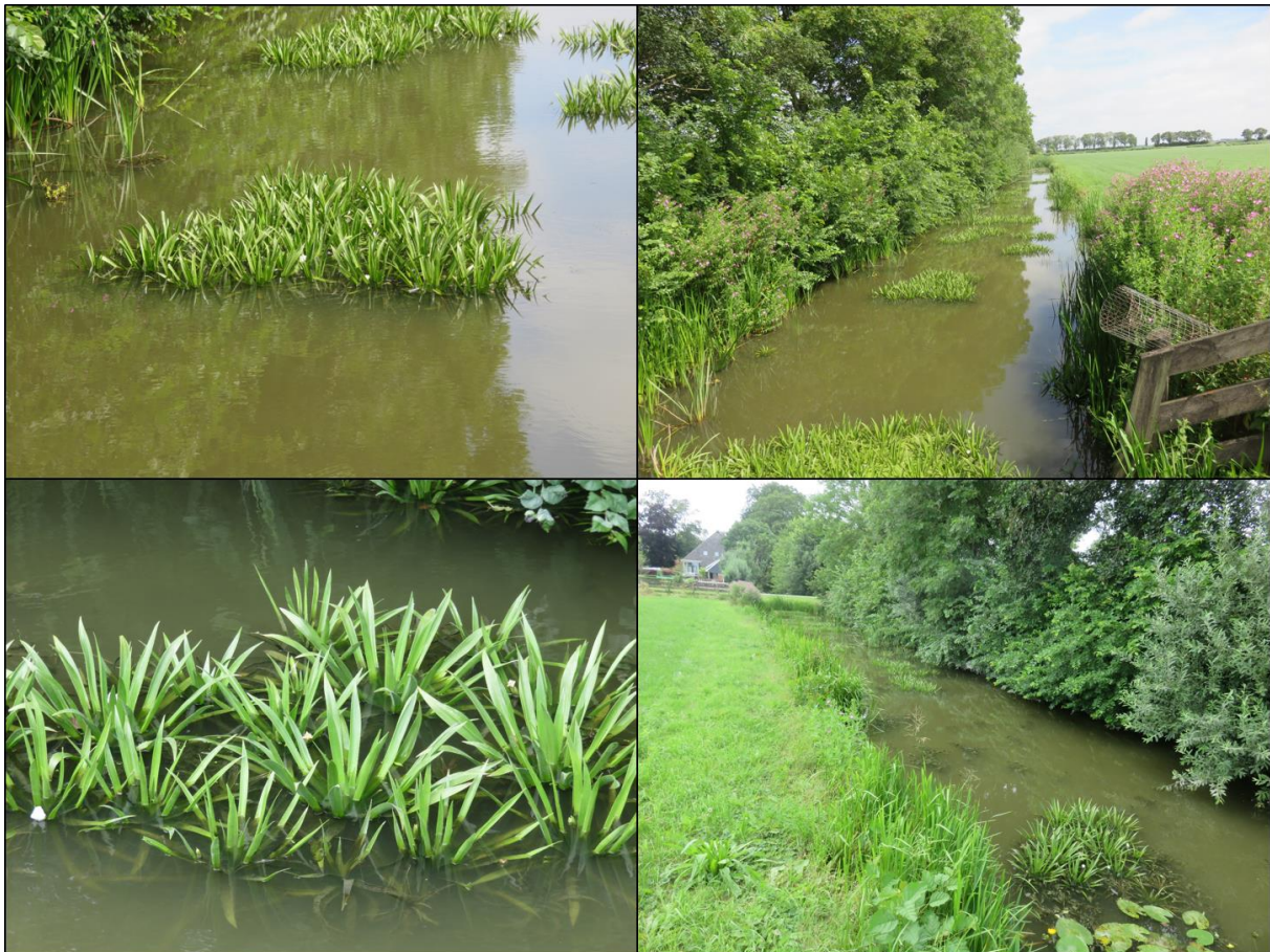
Figuur 2.4. Kleine hoeveelheden krabbenscheer in de sloot langs de noordwest zijde van het plangebied.