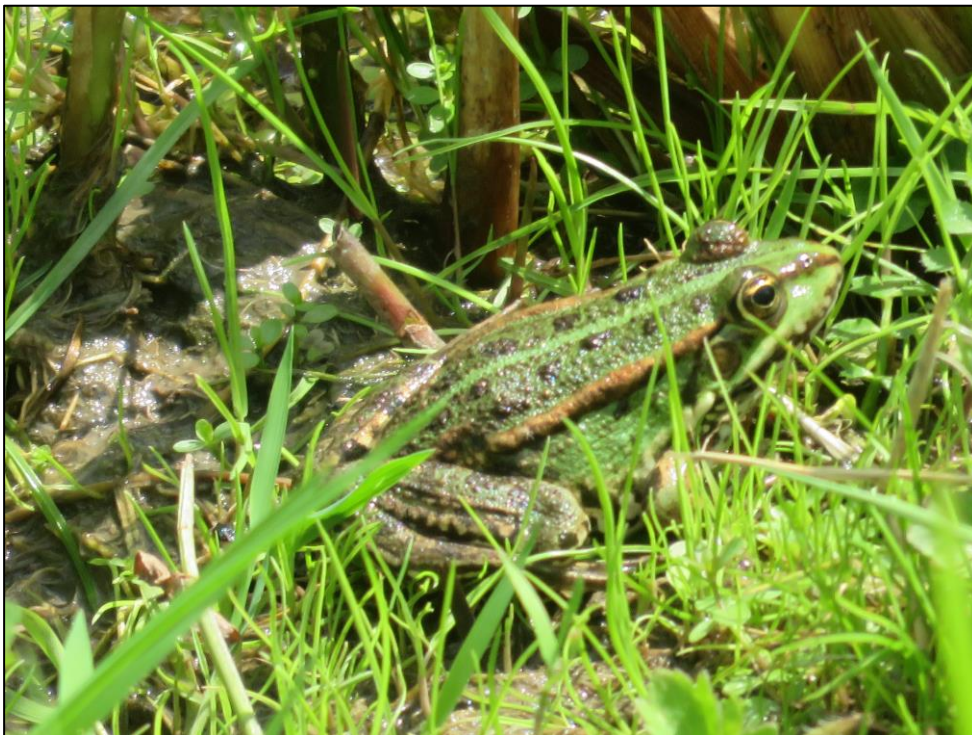
Figuur 2.3. aangetroffen groene kikker in de sloten langs het plangebied.

Voor amfibieën geldt dat het voorkomen van alle beschermde soorten op voorhand kan worden uitgesloten op basis van verspreidingsgegevens (bron: NDFF). Omdat de verspreidingsgegevens van beschermde amfibieën met regelmaat worden geactualiseerd door RAVON, mag worden aangenomen dat de NDFF in deze een compleet beeld geeft. Binnen het plangebied is een populatie groene kikkers aangetroffen (figuur 2.4). Het is zonder de kikkers te vangen niet mogelijk om te bepalen of het hier meerkikkers en/of bastaardkikkers betreft. Echter, beide soorten zijn binnen de provincie Fryslân voor ruimtelijke ingrepen vrijgesteld. Voor deze soorten geldt de zorgplicht. Ook voor andere, meer algemene, (vrijgestelde) soorten die in het plangebied aangetroffen kunnen worden, zoals gewone pad geldt de zorgplicht (Bijlage I).