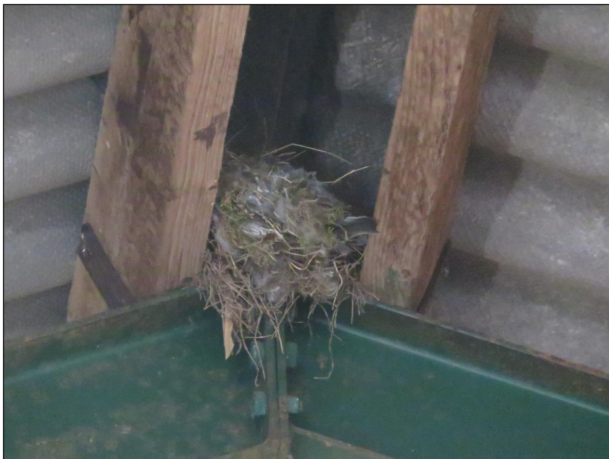
Figuur 1. Huisumusnest in gebruik in de loods binnen het perceel Rijksweg 155 te Jirnsum