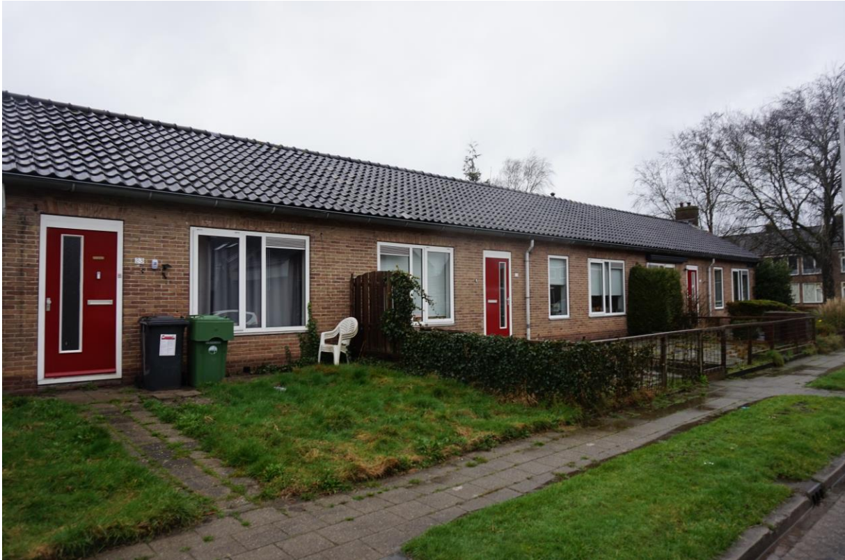
Figuur 2.2. Nij Dijkstraatje 2-1 t/m 2-3(van rechts naar links).

In figuur 2.2 tot en met 2.5 zijn overzicht foto's opgenomen van de onderzoekslocatie.