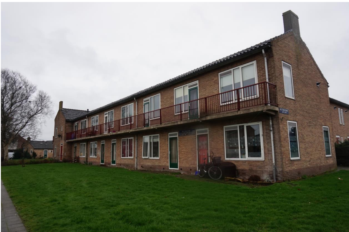
Figuur 2.3. Meester P.J. Troelstrawei 2-9 t/m 2-14 (van rechts naar links).