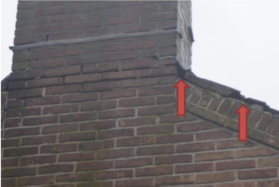
Figuur 5.2. Mogelijke toegang tot nestlocaties van gierzwaluwen t.p.v. Lynbaenstrjitte.

De ransuil wordt aangetroffen in diverse landschapstypen met in de nabije omgeving de aanwezigheid van open velden waar ze jagen. Veelal wordt voor het nest gebruik gemaakt van oude nesten van kraaien of eksters in bomen. De ransuil heeft voor het broeden en roesten een voorkeur voor naaldbomen die hem dekking bieden. Het is een soort die niet in of op bebouwing voorkomt (bron: Vogelbescherming). Nestlocaties van de ransuil worden vanwege het ontbreken van een geschikt habitat niet verwacht binnen de onderzoekslocatie.