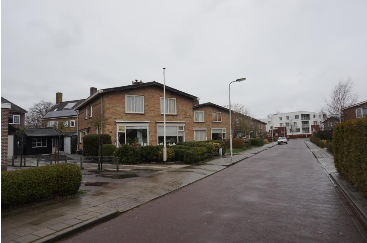
Figuur 2.4. Jogchum Nieuwenhuisstrjitte 18 t/m 36 (van links naar rechts).