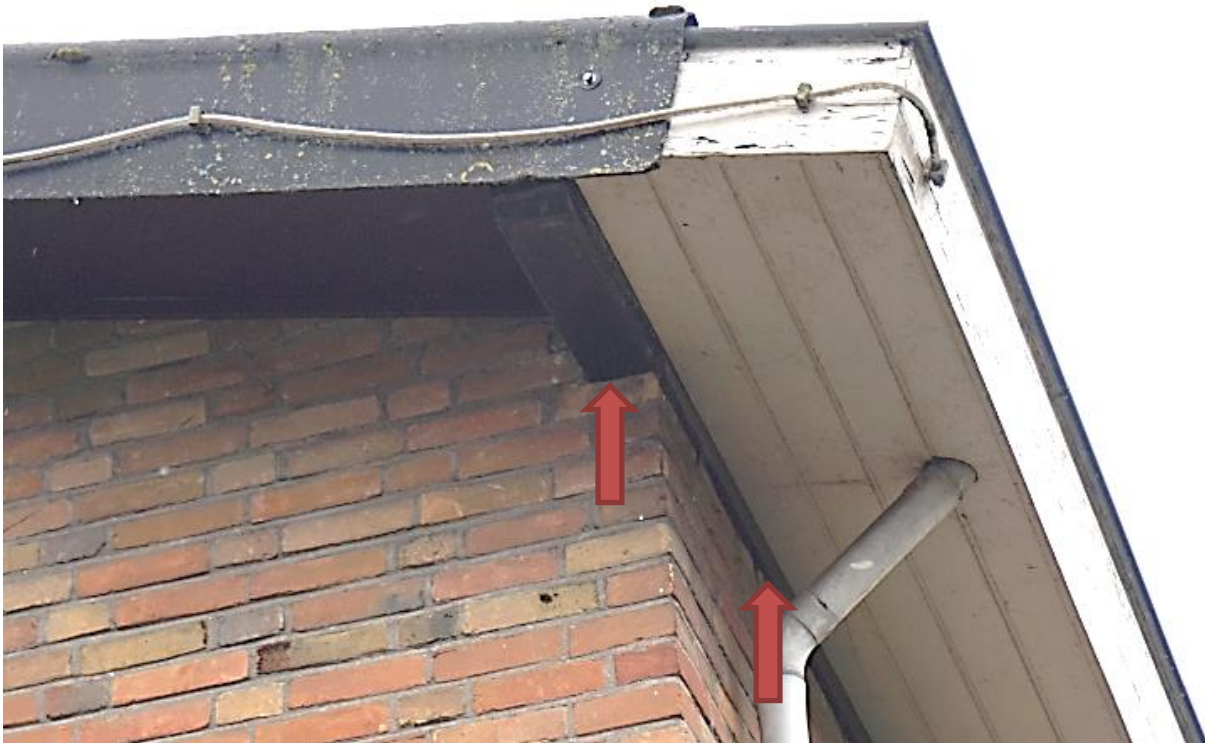
Figuur 5.1. Mogelijke toegang tot nestlocaties van huismussen t.p.v. de Jogchum Nieuwenhuisstrjitte.

Gierzwaluwen zijn heel plaatstrouw, jaren achtereen gebruiken ze dezelfde nestplaats. In de regel is de nestplaats gebonden aan bebouwing. Hij broedt voornamelijk in steden en dorpen waar ze zich nestelen in ventilatieschachten, spleten in de muur of onder dakpannen. De voorkeur gaat uit naar wat oudere woonwijken. In de regel geldt dat de gierzwaluw niet instaat is om vanuit het nest op te stijgen. Hij moet zich eerste z'n drie meter naar beneden laten vallen om vervolgens weg te vliegen. Voor een geschikte nestlocatie mogen geen belemmerende elementen zoals bomen voor de in- en uitvliegrouete staan (Vogelbescherming).