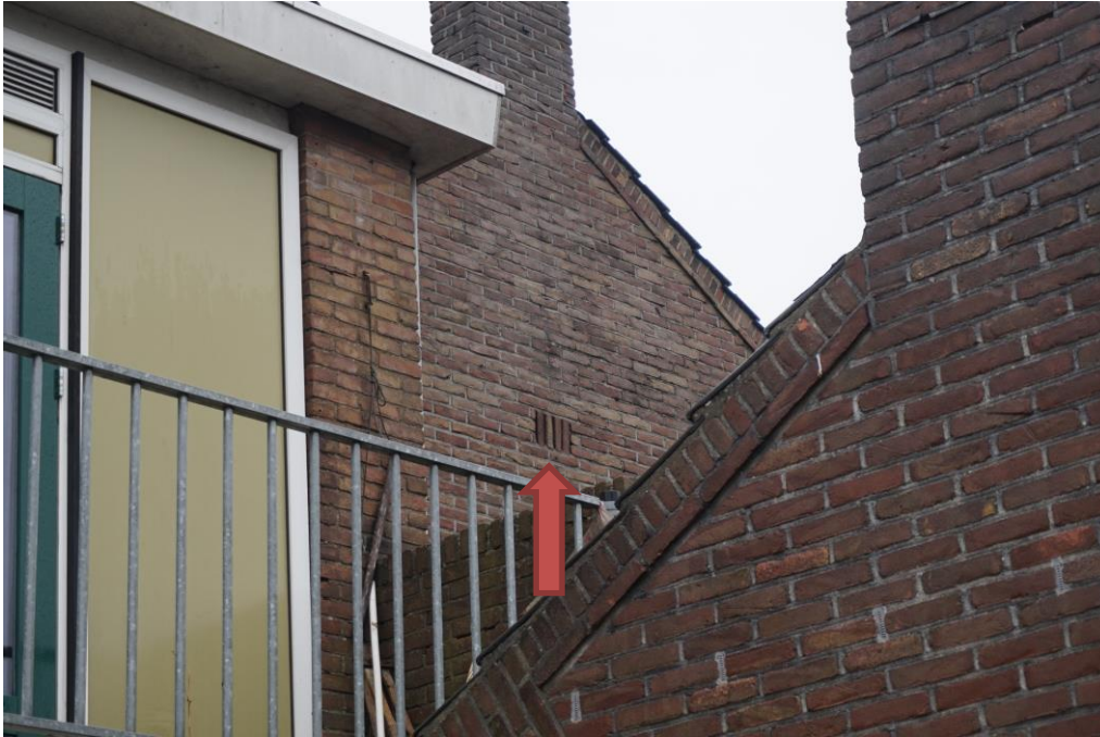
Figuur 5.3. Open stootvoegen die toegang bieden voor vleermuizen aan de Meester P.J. Troelstrawei.

Gewone dwergvleermuizen kunnen in grote groepen overwinteren. In de nazomer worden deze massawinterverblijfplaatsen in grote groepen verkend door voor een dergelijke verblijfplaats te zwermen. Dit gedrag is tot nu toe met name aangetoond bij grotere, hoge gebouwen, zoals flats of kerken. Een zwermlocatie van gewone dwergvleermuizen wordt niet verwacht binnen het onderzoeksgebied.