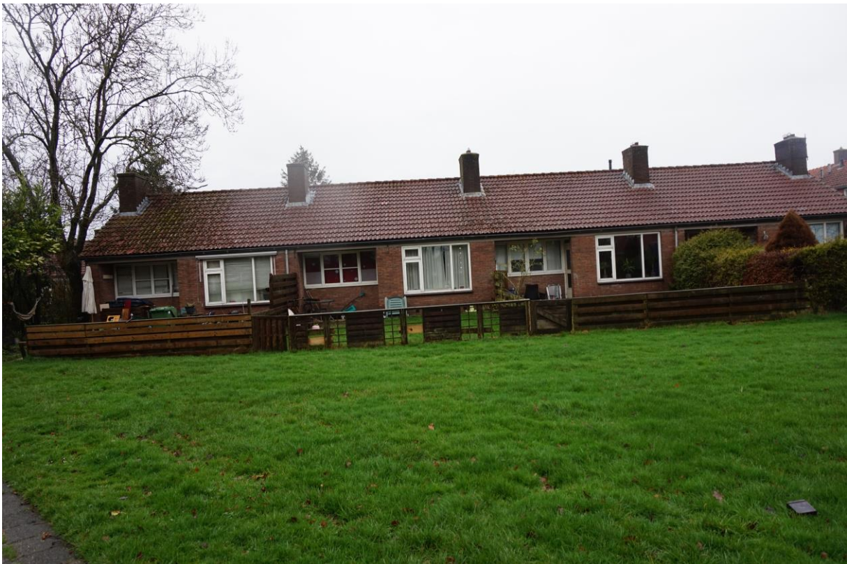
Figuur 2.5. Friesmastrjitte 6-9 (van links naar rechts).