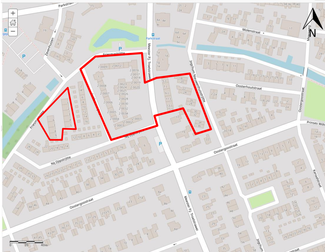
Figuur 2.1. Plangebied (rood omlijnd).