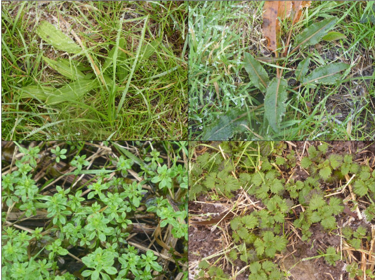
Figuur 2.1. Impressie van de flora in het plangebied met v.l.b.n.r.o.: Smalle weegbree, ridderzuring, kleeftuif en grote brandnetel.

Binnen het plangebied zijn soorten aangetroffen als smalle weegbree, ridderzuring, grote brandnetel, madeliefje, kleeftuif en grote lisdodde. Tijdens het veldbezoek zijn geen beschermde plantensoorten aangetroffen, noch is het geschikte biotoop hiervoor aanwezig. De onder de Wnb beschermde plantensoorten stellen veelal kritische eisen aan hun standplaatsen. Aan deze eisen wordt binnen het plangebied niet voldaan. De omstandigheden zijn te voedselrijk.