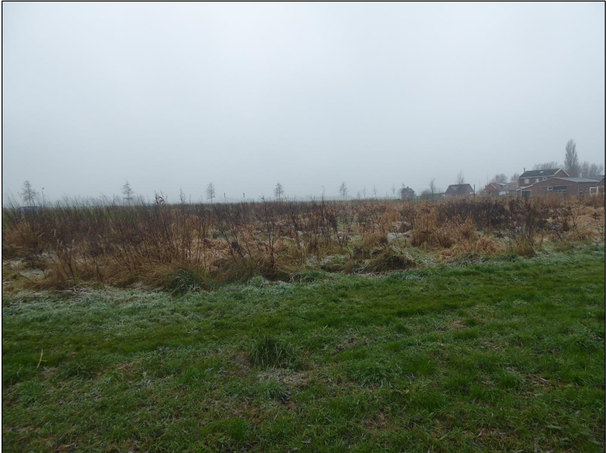
Figuur 2.3. De ruderale vegetatiestrook biedt op zichzelf geen geschikt leefgebied voor kleine marterachtigen.