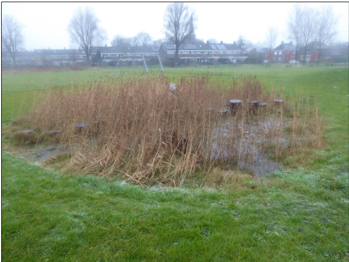
Figuur 2.2. Watervogels zoals wilde eend en meerkoet kunnen onder andere tot broeden komen in de geïsoleerde poel binnen het plangebied.

Naast de aanwezigheid van jaarrond beschermde nesten is het plangebied ook beoordeeld op waarden voor broedvogels waarvan de nesten niet jaarrond beschermd zijn. De nesten van deze soorten zijn uitsluitend beschermd tijdens het broedproces. Het plangebied en de omgeving hiervan bieden mogelijkheden voor verschillende soorten broedvogels. Zo kunnen verschillende watervogels, zoals wilde eend en meerkoet tot broeden komen in de oevers van de vaart en sloot rond het plangebied en in de geïsoleerde poel in het plangebied. Hiernaast kunnen weidevogels tot broeden komen in de strook met ruderaal vegetatie binnen het plangebied.