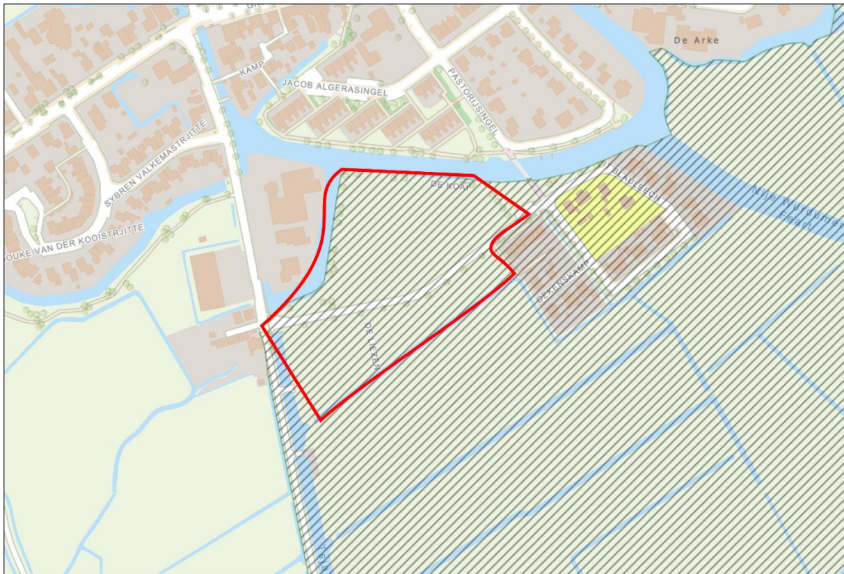
Figuur 2.5. Het plangebied (rood omlind) valt binnen de begrenzingen van een door de provincie Fryslân aangewezen weidevogelkansgebied (diagonale lijnen) (bron: Kaartenkijkdoos Provincie Fryslân).

Tijdens de bureaustudie is één vorm van gebiedsbescherming naar voren gekomen die betrekking heeft op het plangebied. Op basis van de uitgevoerde bureaustudie en een analyse van de door de provincie Fryslân gepubliceerde gegevens is gebleken dat het plangebied geen onderdeel is van het NatuurNetwerk Nederland (NNN) en Natura2000. Hiernaast valt het plangebied niet binnen een door de provincie Fryslân aangewezen ganzenfoerageergebied (bron: Kaartenkijkdoos Provincie Fryslân). Echter, het plangebied valt wel binnen de begrenzingen van een door de provincie Fryslân aangewezen weidevogelkansgebied (figuur 2.5). Negatieve effecten op gebiedsbescherming kunnen derhalve niet op voorhand worden uitgesloten. De provincie Fryslân is bevoegd gezag in deze.