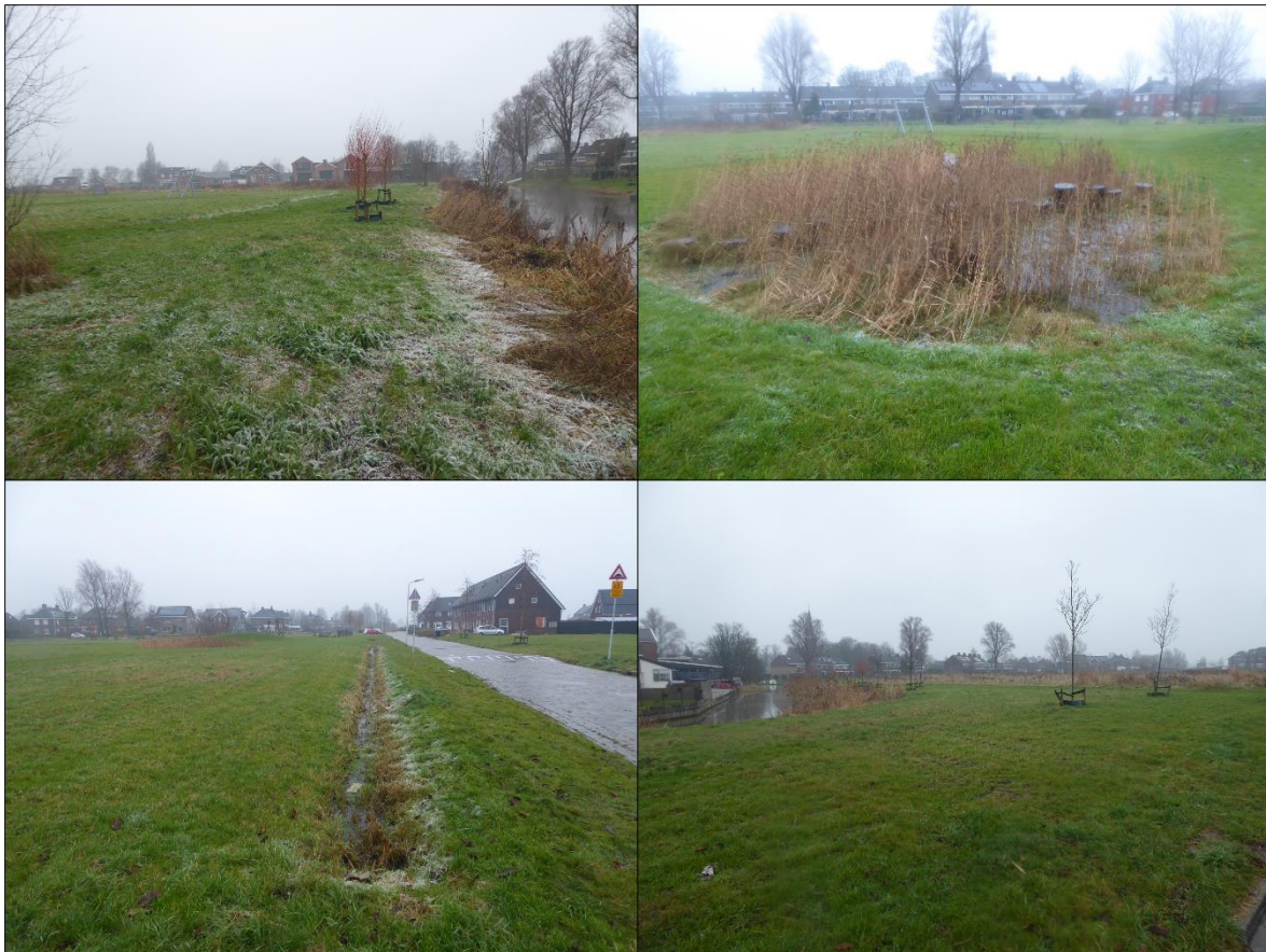
Figuur 1.2. Een impressie van het plangebied.

Het planvoornemen bestaat uit het realiseren van nieuwbouwwoningen binnen het plangebied. Het is ten tijde van dit schrijven niet bekend of er binnen het planvoornemen bomen worden gekapt of waterpartijen/watergangen worden aangetast.