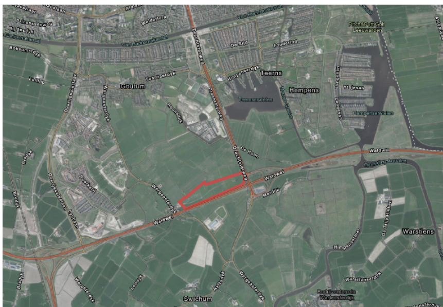
Situering zonnepark

De oorspronkelijke omgevingsvergunning voor de realisatie van een zonnepark is verleend op 23 september 2016 voor de duur van 10 jaar. Het zonnepark is inmiddels gerealiseerd. Er is een aanvraag omgevingsvergunning ingediend voor het verlengen van de termijn van 10 naar 25 jaar.