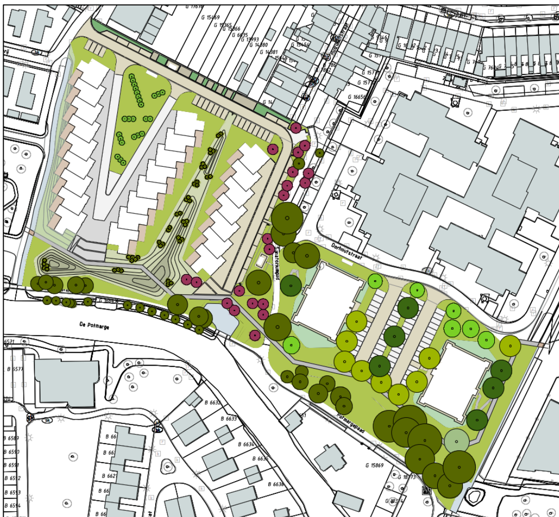
Figuur 2 Ontwerp Parkhoven

Slokker B.V. is van plan om drie rijen van in totaal 24 grondgebonden woningen op het Smedingterrein te bouwen en twee appartementenblokken van in totaal 50 appartementen op het Parkhoventerrein (figuur 2). De appartementen bestaan uit maximaal vijf woonlagen. De woningen worden ingepast in de groene omgeving naast de Potmarge. In totaal neemt de verharding met ongeveer 10.000 m 2 toe ten opzichte van de huidige braakliggende situatie. In figuur 2 is het ontwerp van beide locaties te zien.