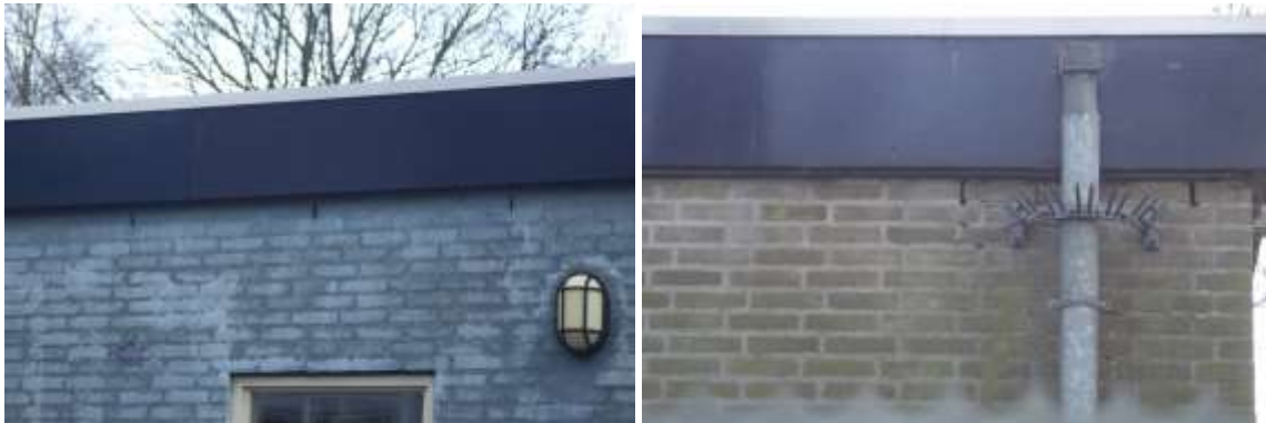
Open stootvoegen in de buitengevel bieden vleermuizen de kans een verblijfplaats te bezetten in de spouw.

Er zijn tijdens het veldbezoek geen vleermuizen waargenomen en er zijn geen directe aanwijzingen gevonden die op de aanwezigheid van een verblijfplaats van vleermuizen in het plangebied duiden, maar de te slopen gebouwen worden als een potentiële verblijfplaats van vleermuizen beschouwd. De te slopen bebouwing beschikt over een (holle) spouw en in beide gebouwen zijn potentiële invliegopeningen, zoals open stootvoegen en andere gaten en kieren waargenomen die vleermuizen die kans bieden een verblijfplaats te bezetten in de bebouwing. Vleermuissoorten als gewone dwergvleermuis en laatvlieger kunnen een verblijfplaats in de spouw en de dakconstructie benutten als zomer-, winter-, kraam- en paarverblijfplaats.