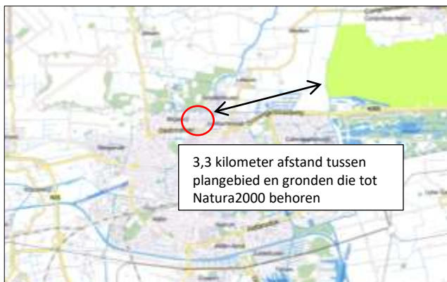
Ligging van Natura2000-gebied in de omgeving van het plangebied. De ligging van het plangebied wordt met de rode cirkel aangegeven. Gronden die tot Natura2000 behoren worden met de okergele kleur aangeduid.

Het plangebied ligt buiten de begrenzing van Natura2000. Gronden die tot Natura2000 behoren liggen op minimaal 3,3 kilometer afstand van het plangebied. Op onderstaande kaart wordt de ligging van Natura2000-gebied in de omgeving van het plangebied weergegeven.