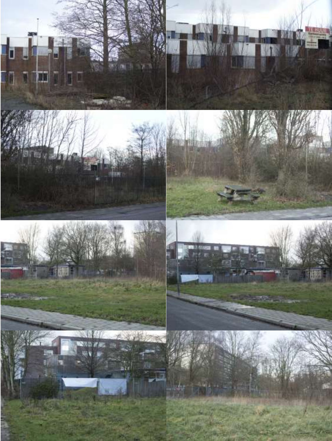
Bijlage 3. Fotobijlage. Impressie van het plangebied en de directe omgeving.