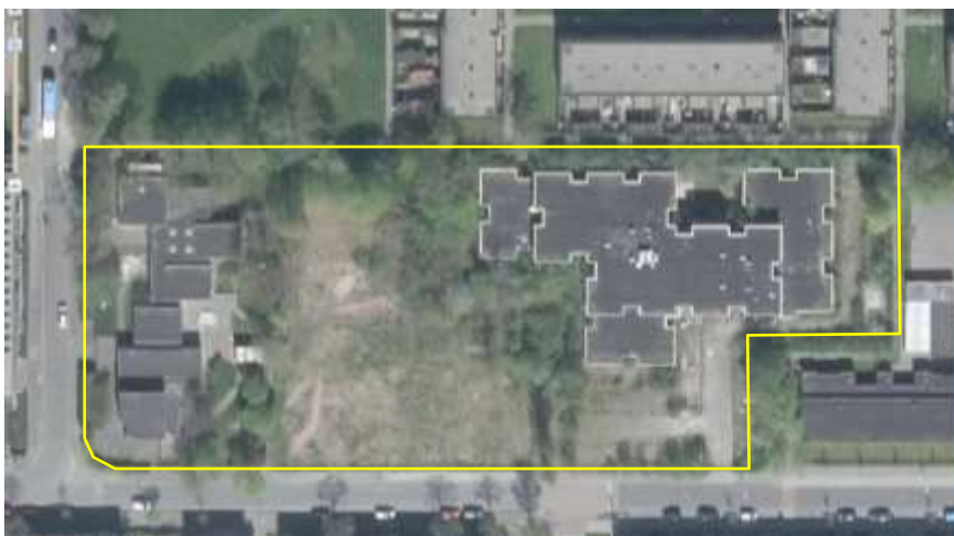
Detailopname van het plangebied. De begrenzing van het plangebied wordt met de gele lijn aangeduid.

Het plangebied bestaat uit bebouwing, erfverharding, braakland met een soortenarme grazige vegetatie en opgaande beplanting in de vorm van ruigte, bomen en struiken. In het plangebied staan twee forse bakstenen gebouwen met platte daken. De gebouwen beschikken over een (holle) spouw en zijn gedekt met bitumen dakleer. De gebouwen staan al enige tijd leeg en sommige ramen van de gebouwen zijn ingegooid of staan open. Op onderstaande afbeelding wordt het plangebied in detail weergegeven, evenals de begrenzing. Voor een verbeelding van het plangebied wordt naar de fotobijlage verwezen.