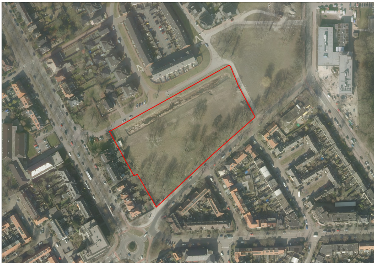
Figuur 1: De ligging van het plangebied