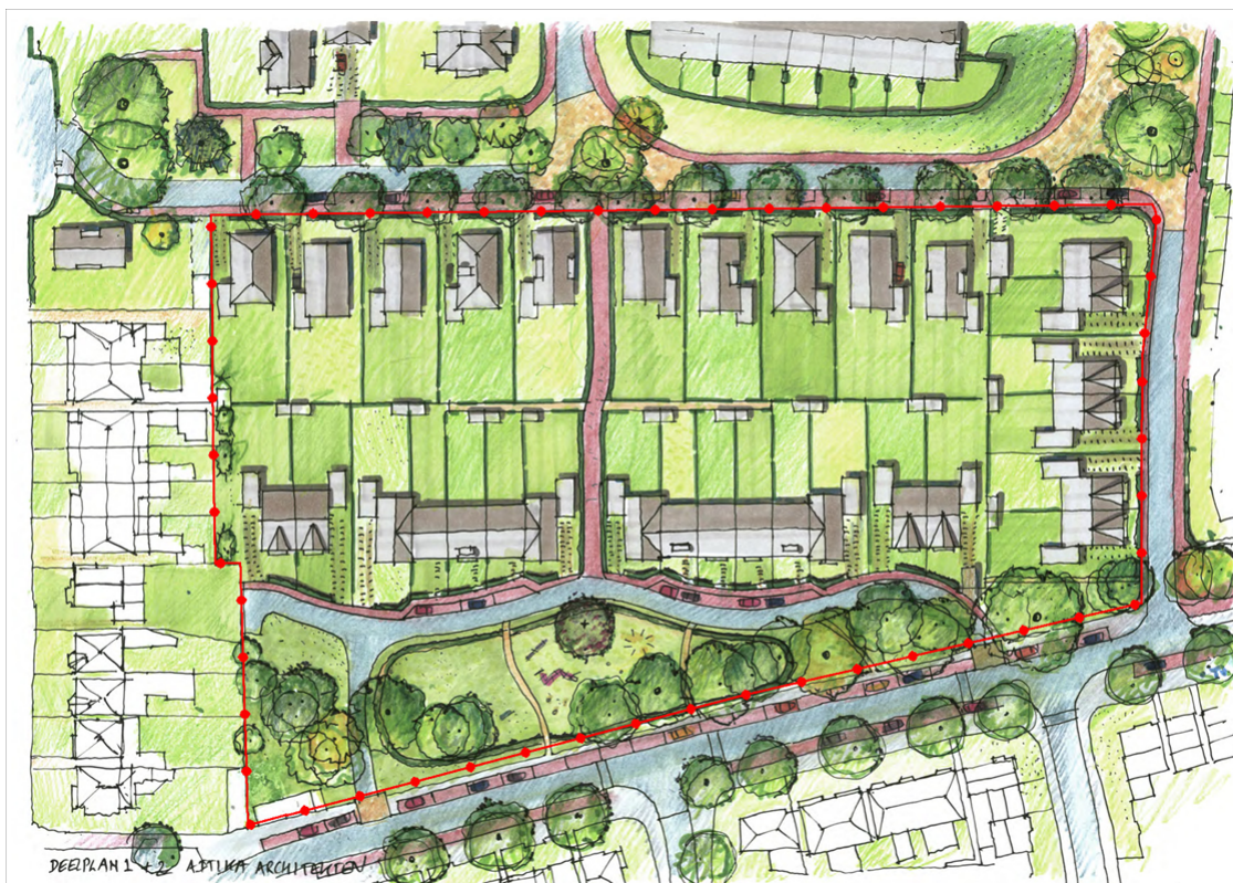
Figuur 2: Mogelijke stedenbouwkundige situering

Het bestemmingsplan maakt de bouw mogelijk van grondgebonden vrijstaande woningen, geschakelde woningen dan wel twee-onder-één-kap woningen aan de Bonnehosstraat en twee-onder-één-kap woningen en aaneengesloten woningen aan de nog aan te leggen Walburgastraat. Aan de Gertrudisstraat kunnen aaneengesloten woningen dan wel twee-onder-één-kap woningen worden gebouwd. De aanleg van de Walburgastraat is nodig voor de ontsluiting van de woningen. In totaal worden maximaal 38 woningen mogelijk gemaakt. Figuur 2 laat een mogelijke stedenbouwkundige situering zien.