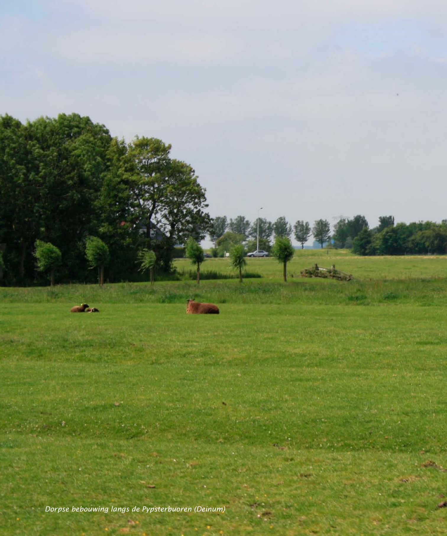
Dorpse bebouwing langs de Pypsterbuoren (Deinum)