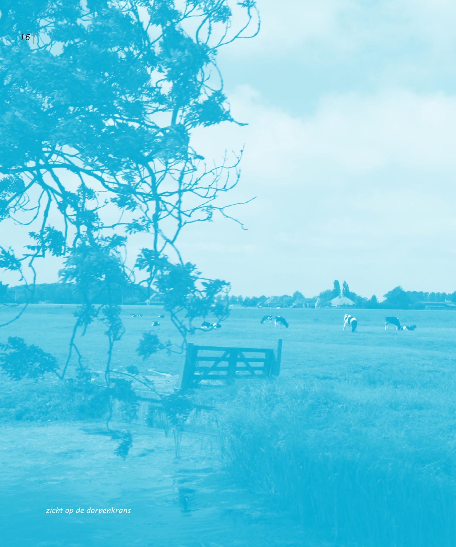
zicht op de dorpenkrans