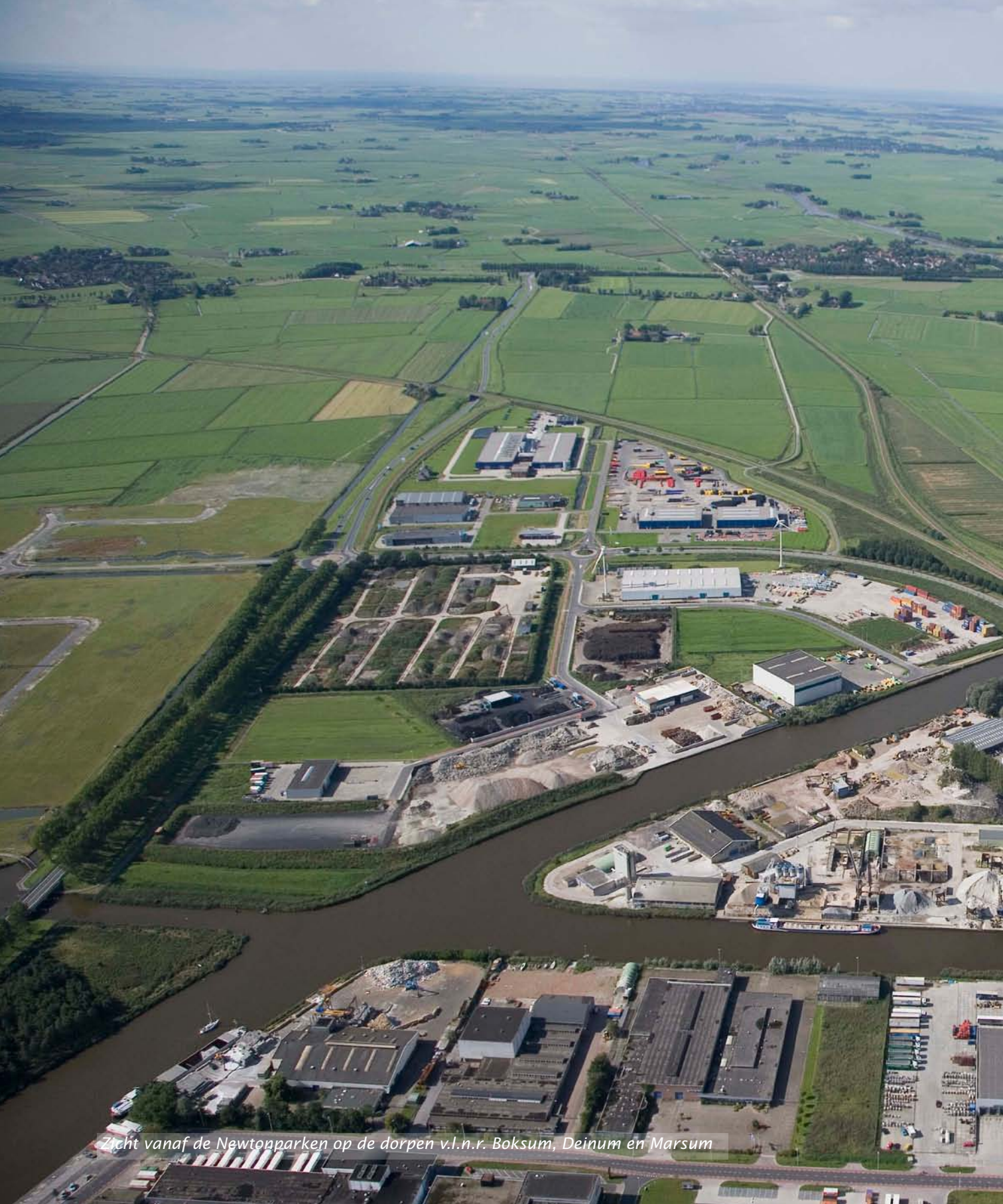
Zicht vanaf de Newtonparken op de dorpen v.l.n.r. Boksum, Deinum en Marsum