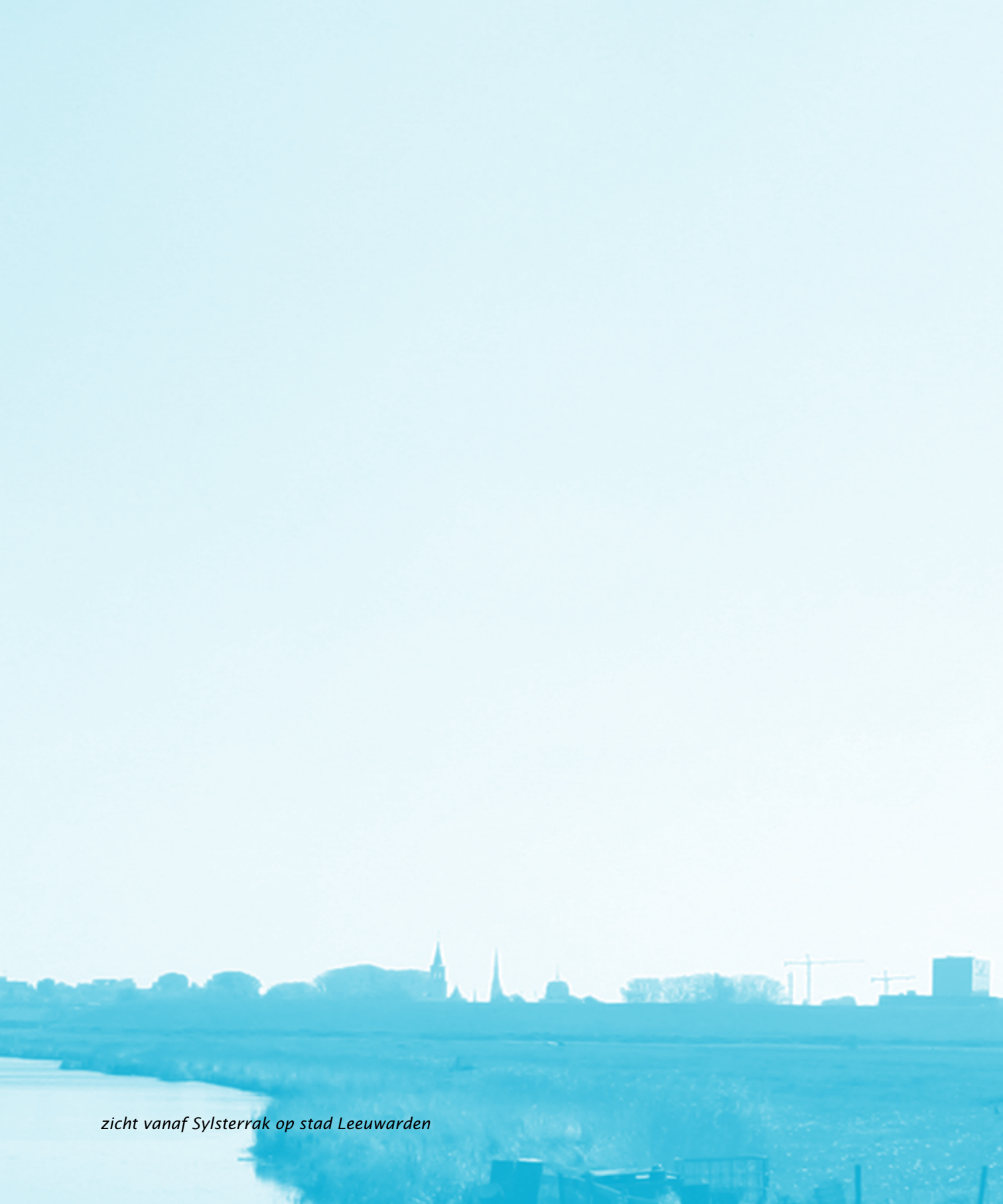
zicht vanaf Sylterrak op stad Leeuwarden