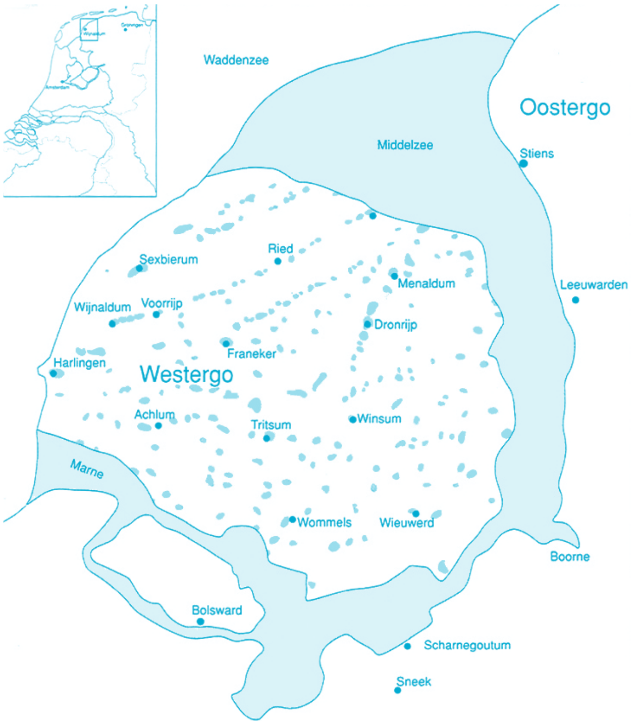
oorspronkelijke ligging Middelzee