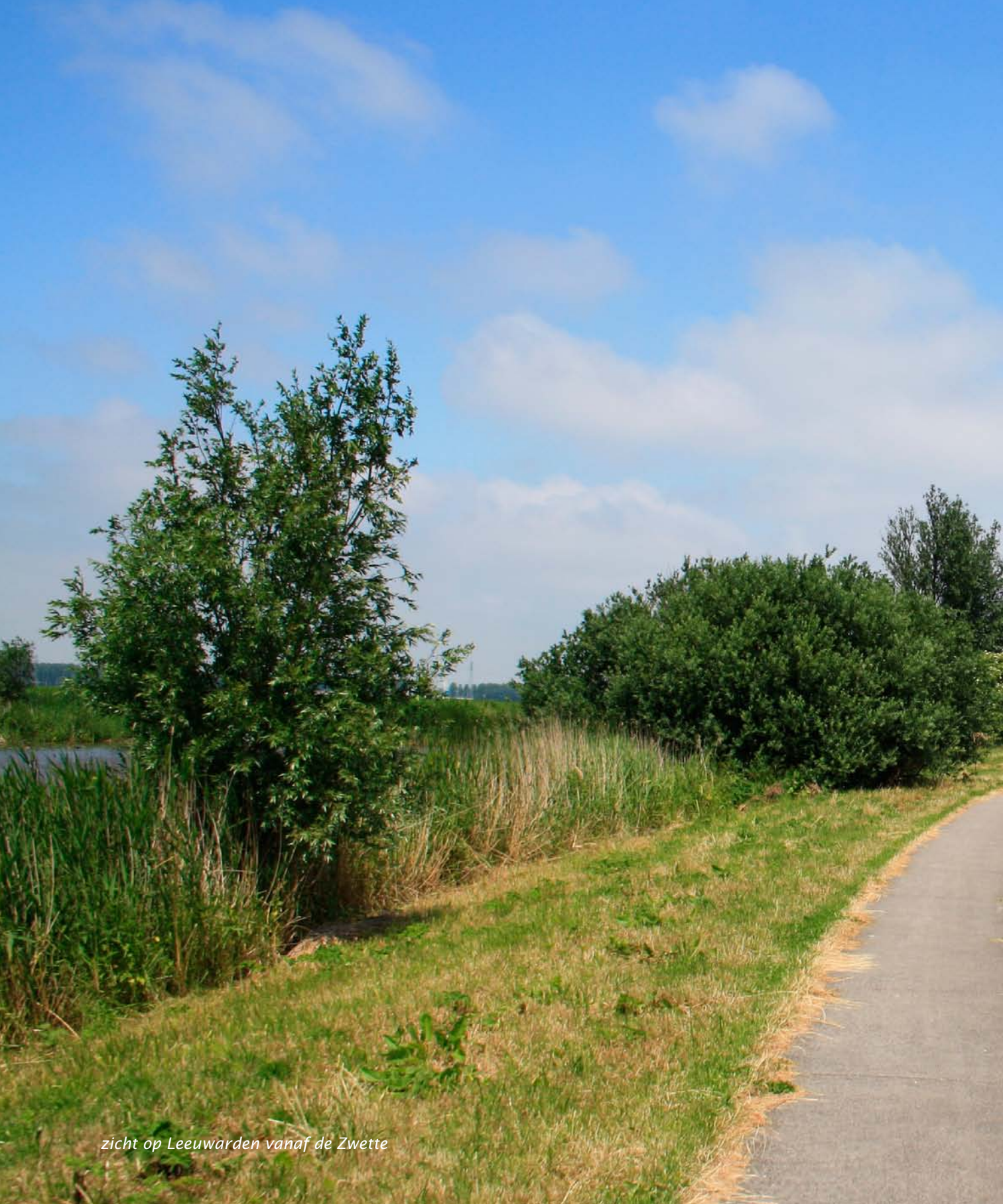
zicht op Leeuwarden vanaf de Zwette