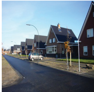
Sterke onderlinge samenhang