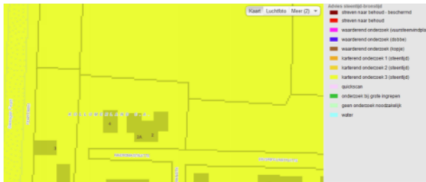
Steentijd-Bronstijd, bron: FAMKE

Op de provinciale archeologiekartaat Famke is het terrein voor zowel de periode IJzertijd-Middeleeuwen als de periode Steentijd-Bronstijd aangewezen als gebied voor karterend onderzoek 3.