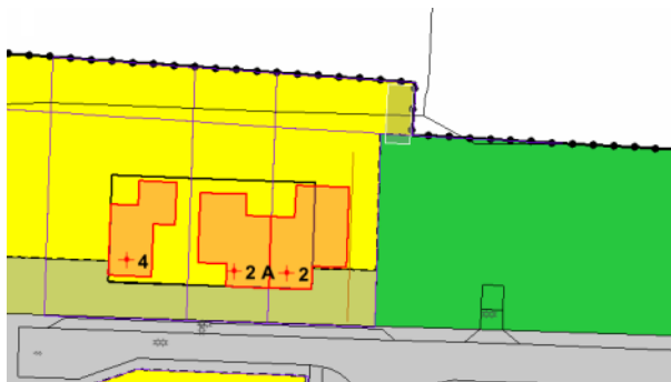
Fragment plankaart bestemmingsplan Kollumerzwaag

Het perceel Maersmastrjitte 2 te Kollumerzwaag valt binnen het bestemmingsplan Kollumerzwaag en heeft de bestemming Wonen. Deze gronden zijn bestemd voor wonen en o.a. daarbij behorende groenvoorzieningen. De voorzijde van het perceel heeft de bestemming Tuin, deze gronden zijn o.a. bestemd voor tuinen en groenvoorzieningen. De groenstrook aan de oostkant van de Maersmastrjitte 2 valt echter binnen de bestemming Groen. De voor 'Groen' aangewezen gronden zijn bestemd voor groen- en speelvoorzieningen, openbare nutsvoorzieningen, verkeers- en verblijfsvoorzieningen en water. Op of in deze gronden mogen geen gebouwen worden gebouwd, anders dan ten behoeve van openbare nutsvoorzieningen. De groen bestemming is in principe een bestemming ten behoeve van de openbare ruimte. Wanneer deze gronden bij het erf betrokken zouden worden, is het gebruik ten behoeve van wonen en dat is op deze locatie niet toegestaan.