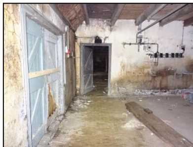
Figuur 16. Melkstal.