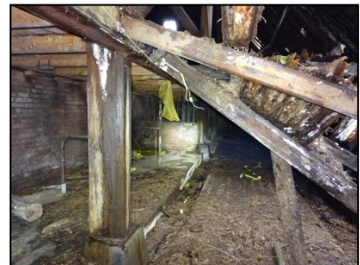
Figuur 14. Koestal, met verzakt plafond.