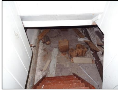
Figuur 10. Trap naar kelder.