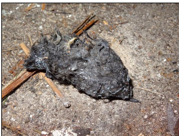
Figuur 21. Braakbal van een kerkuil.

De kerkuil broedt van oorsprong voornamelijk in bebouwing. Tegenwoordig broedt de soort nagenoeg uitsluitend nog in speciale nestkasten. Volgens verspreidingsgegevens van Sovon komt de kerkuil in de omgeving van de onderzoekslocatie voor. In het NDFF Uitvoerportaal staan geen meldingen van waarnemingen van kerkuil in de afgelopen 5 jaar in de omgeving van de onderzoekslocatie. Wegens het ontbreken van speciale nestkasten vormt de onderzoekslocatie geen geschikte broedlocatie voor de kerkuil. Tevens zijn er tijdens het veldbezoek geen nesten waargenomen. Tijdens het veldbezoek zijn wel meerdere oude en verse braakballen gevonden van de kerkuil (figuren 21 en 22). Kennelijk gebruikt de kerkuil de boerderij wel als rustplaats. De rustplaats van de kerkuil is niet (jaarrond) beschermd onder de Wet natuurbescherming. Echter kan het verlies van een rustplaats leiden tot het verlies van de functionaliteit van een nestplaats. Overtreding van de Wet natuurbescherming ten aanzien van de kerkuil is niet op voorhand uit te sluiten (zie hoofdstuk 6).