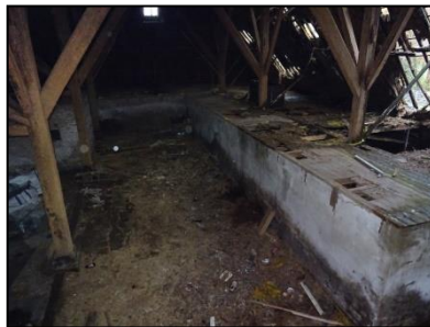
Figuur 13. Zicht op schuur, achter woonhuis.