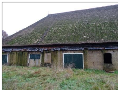
Figuur 4. Zijkant boerderij, gezien vanuit het oosten.