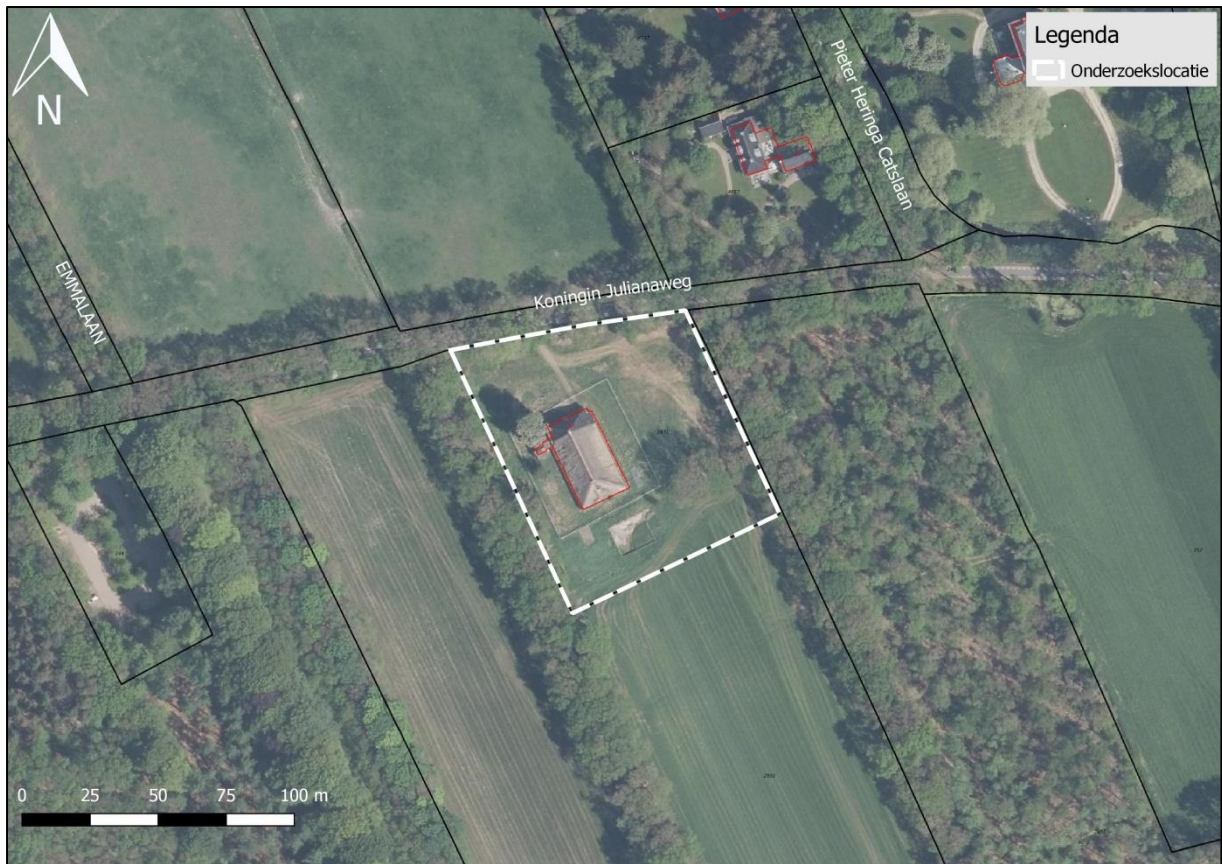
Figuur 2. Luchtfoto onderzoekslocatie en directe omgeving.