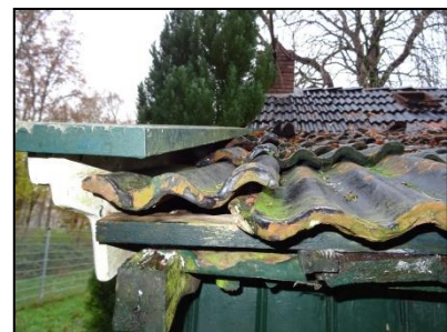
Figuur 25. Ruimte tussen betimmering en dakpannen.