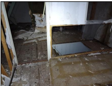
Figuur 12. Eerste verdieping.