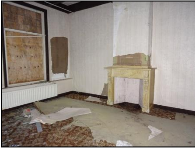
Figuur 9. Open haard in eerste voorste kamers.