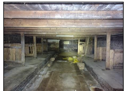
Figuur 17. Koestal, aan achterzijde schuur.