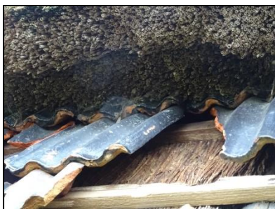
Figuur 23. Ruimte onder dakpannen.

De aanwezige bomen op de onderzoekslocatie zijn onderzocht op holtes, spleten en loshangend schors, wat kan dienen als potentiële vaste rust- en verblijfplaats voor boombewonende vleermuizen. Dit is niet aangetroffen en daarmee zijn boombewonende vleermuizen uit te sluiten.