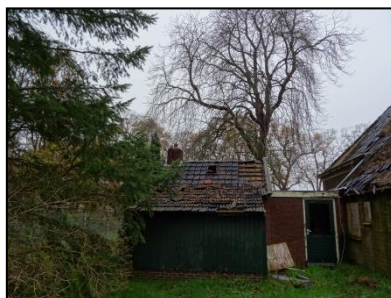
Figuur 7. Bijkeuken en overkapping, gezien vanuit het zuiden.