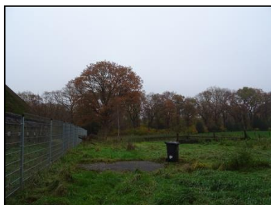
Figuur 19. Mestvaalt en rij eiken aan zuidgrens perceel, gezien vanuit het westen.