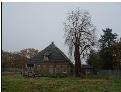
Figuur 3. Voorzijde boerderij met kastanje, gezien vanuit het noorden.