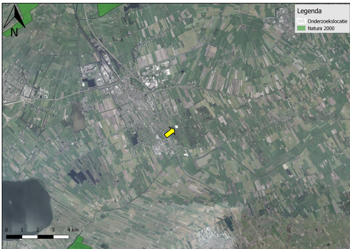
Figuur 26. Ligging onderzoekslocatie ten opzichte van Natura 2000.

De onderzoekslocatie is niet gelegen binnen de grenzen, of in de directe nabijheid van een gebied dat aangewezen is als Natura 2000. Het meest nabijgelegen Natura 2000-gebied, Deelen, bevindt zich op circa 8,5 km afstand ten noorden van de onderzoekslocatie (zie figuur 26).