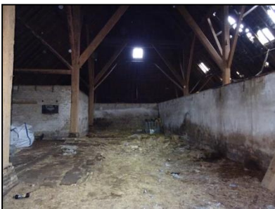
Figuur 15. Centrale deel van de schuur.