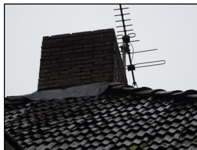
Figuur 24. Ruimte onder loodslobben.