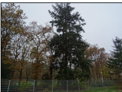
Figuur 18. Spar op westzijde van perceel, gezien vanuit het zuiden.