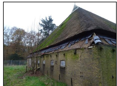
Figuur 5. Achterzijde boerderij, gezien vanuit het zuiden.