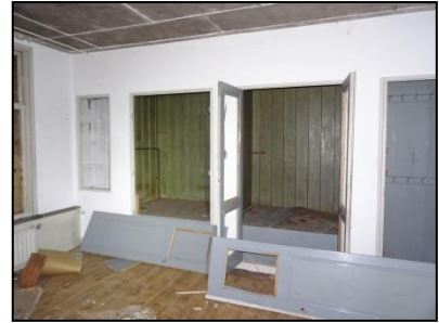
Figuur 11. Bedstee in tweede voorste kamer.