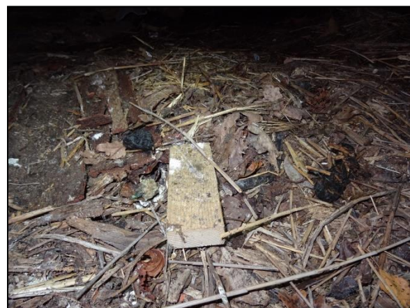
Figuur 22. Braakballen van een kerkuil.