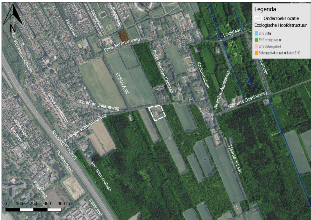
Figuur 27. Ligging onderzoekslocatie ten opzichte van het Natuurnetwerk Nederland.

De onderzoekslocatie maakt geen deel uit van het Natuurnetwerk, de voormalige Ecologische Hoofdstructuur (EHS). De onderzoekslocatie ligt echter wel in de nabijheid van een gebied, behorend tot het Natuurnetwerk Nederland. Het meest nabijgelegen gebied grenst aan de onderzoekslocatie en heeft beheertype N15.02 Dennen-, eiken- en beukenbos. In figuur 27 is de ligging van de onderzoekslocatie ten opzichte van het Natuurnetwerk Nederland weergegeven.