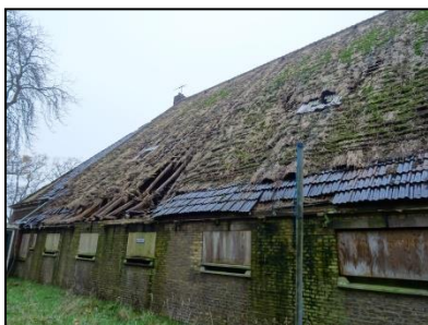
Figuur 6. Zijkant boerderij, gezien vanuit het westen.