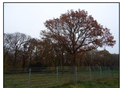
Figuur 20. Rij eiken, gezien vanuit het noorden.