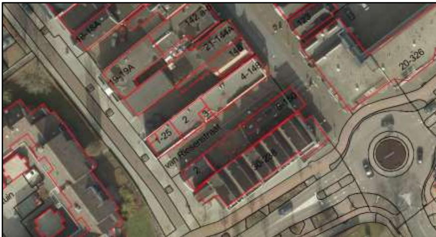
Afbeelding 4 Van Riesenstraat e.o.

In de bouwregels van de beheersverordening 'Heerenveen-Centrum' is bepaald dat gebouwen en overkappingen uitsluitend in een bouwvlak mogen worden gebouwd. Ter plaatse van de bebouwing tussen Van Riesenstraat en de Koornbeursweg is in de beheersverordening echter ten onrechte het bouwvlak weggefallen. De bestaande bebouwing is daarmee onder het overgangsrecht komen te vallen, hetgeen niet de intentie was. Daarmee is vervangende nieuwbouw ter plekke niet in overeenstemming met de beheersverordening. Door middel van deze correctieve herziening worden deze percelen alsnog van een bouwvlak voorzien.