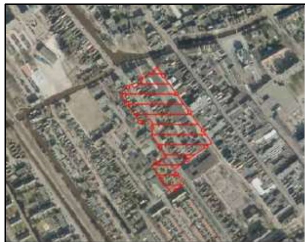
Afbeelding 2 Besluitgebied beheersverordening Centrum-West