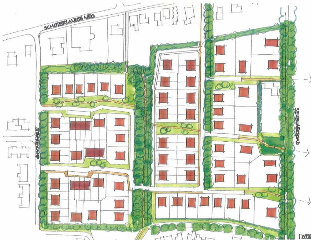
Figuur 1. Mogelijke invulling van het plangebied.

De herinrichting van het plangebied betreft de bouw van woningen op de vrijkomende sportvelden. Het aantal te bouwen woningen ligt tussen de 90 en 110, dit is afhankelijk van de uiteindelijke invulling van het gebied. In figuur 1 is een mogelijke invulling van het plangebied weergegeven. In deze variant blijft veel van de bestaande opgaande begroeiing behouden. Het is niet duidelijk of dit uiteindelijk ook het geval zal zijn.