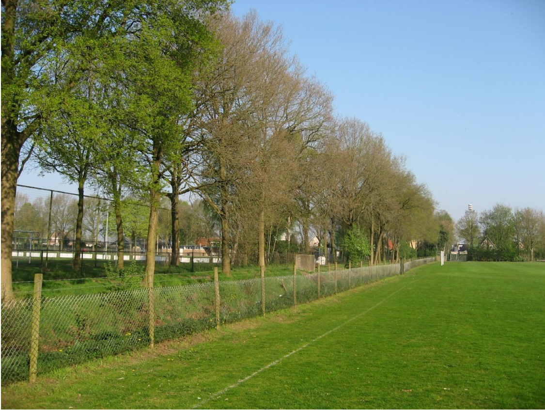
Foto 1. Impressie van het plangebied, de boomsingel centraal in het gebied.