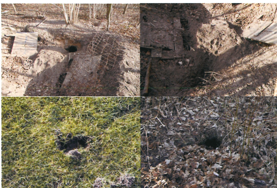
Foto's 1 t/m 4 (A&W). Foto 1 en 2 bijburcht met loopsporen. Foto 3. Graafsporen sportveld. Foto 4. vluchtpijp.

De bijburcht was ten tijde van het onderzoek in gebruik door Dassen, gezien de aanwezige loop- en graafsporen. Ook werden graafsporen op het voetbalveld aangetroffen, die erop duiden dat het plangebied wordt gebruikt als foerageergebied (foto 3). Op basis van deze waarnemingen wordt geconcludeerd, dat in de bijburcht in de winter van 2012/2013 in gebruik is geweest. Navraag bij de sportvereniging heeft vervolgens geleerd, dat sinds het najaar van 2012 graafsporen van Dassen op de sportvelden zijn aangetroffen. De vestiging van de bijburcht heeft waarschijnlijk toen plaatsgevonden. Bij de vluchtpijpen werden geen sporen van bewoning aangetroffen. Het is aannemelijk dat deze vluchtpijpen niet meer worden gebruikt omdat er nu een bijburcht is gevestigd.