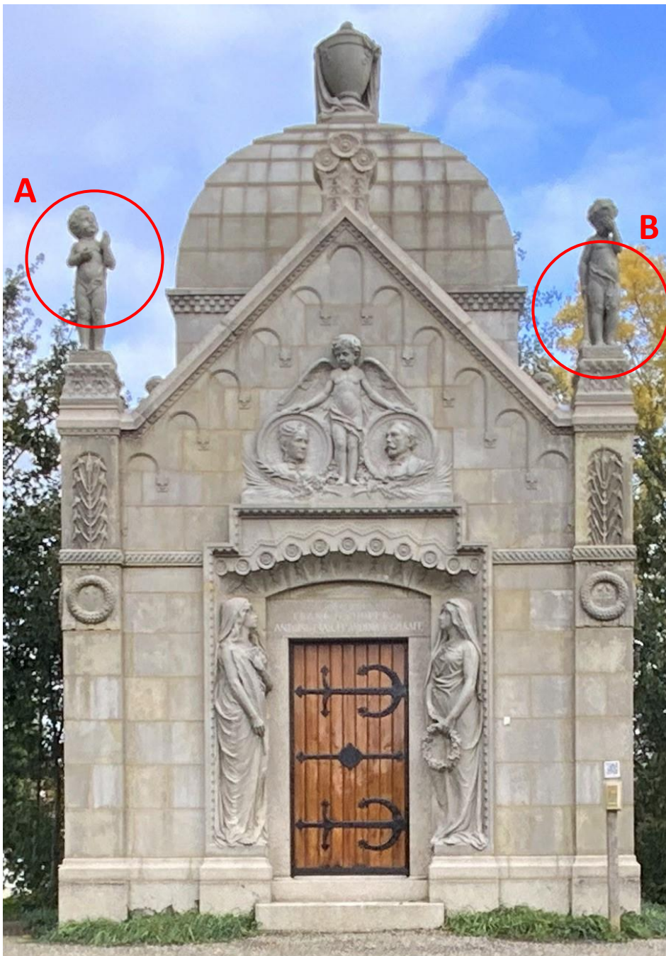
BESTAANDE WESTGEVEL 2021