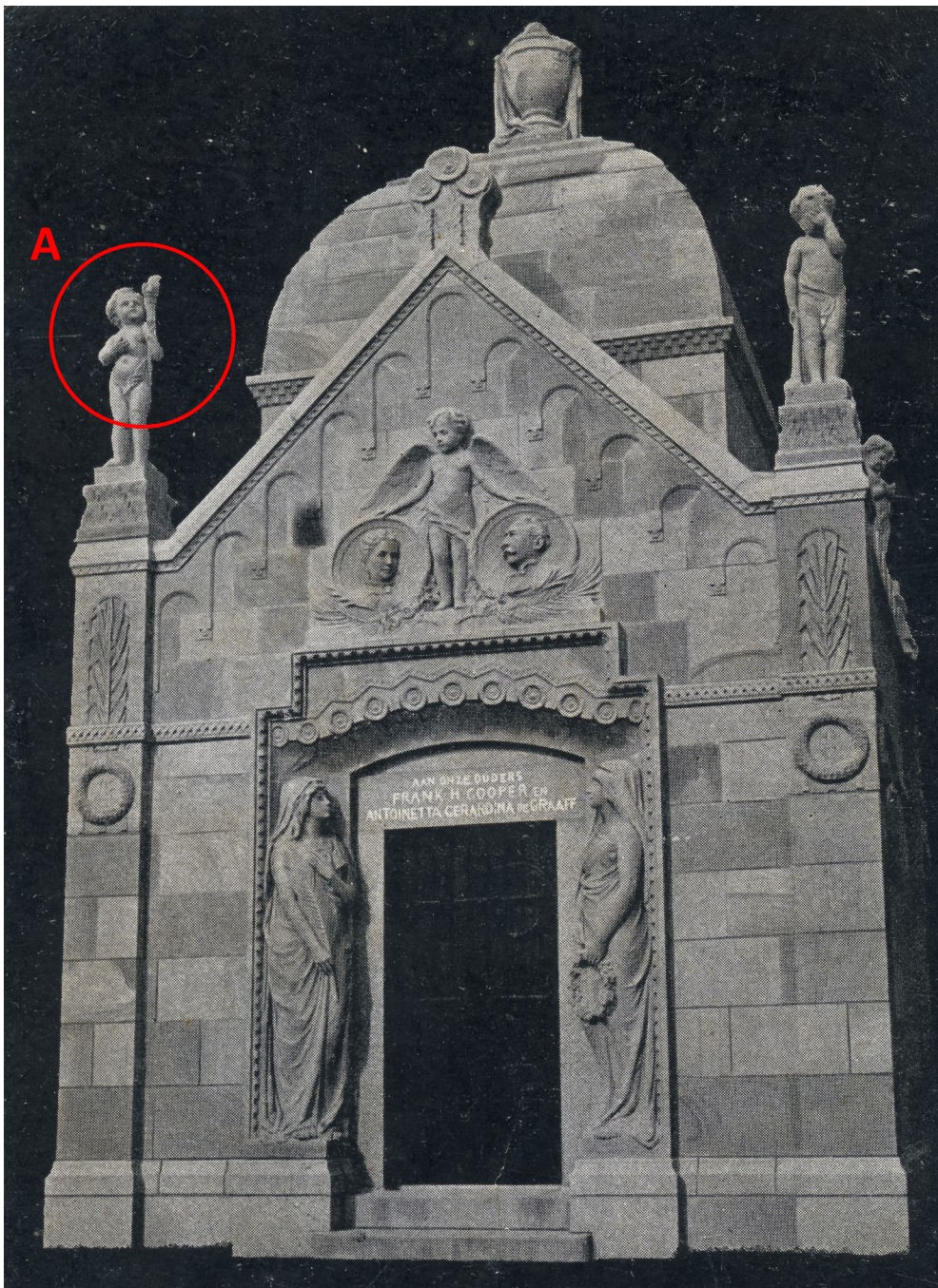
BESTAANDE WESTGEVEL BEGIN VORIGE EEUW